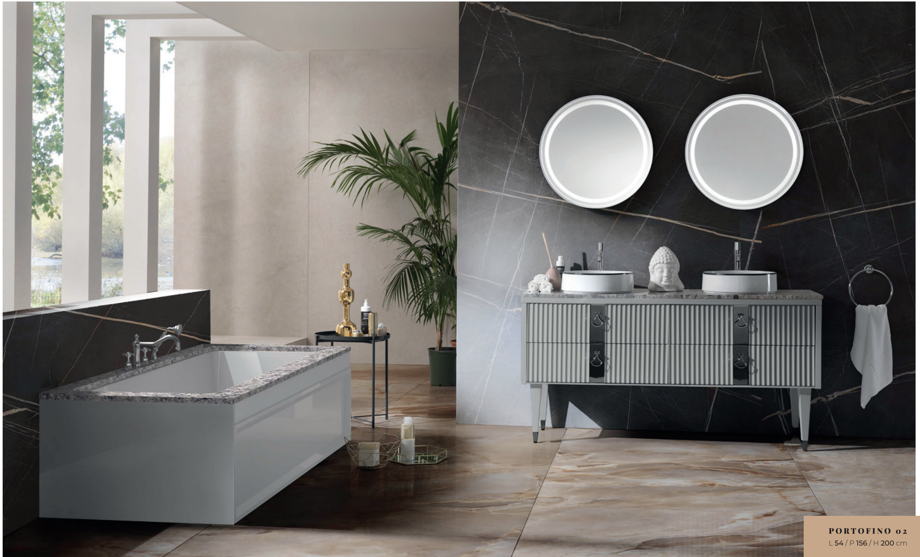
PORTOFINO 02 L 54 / P 156 / H 200 cm