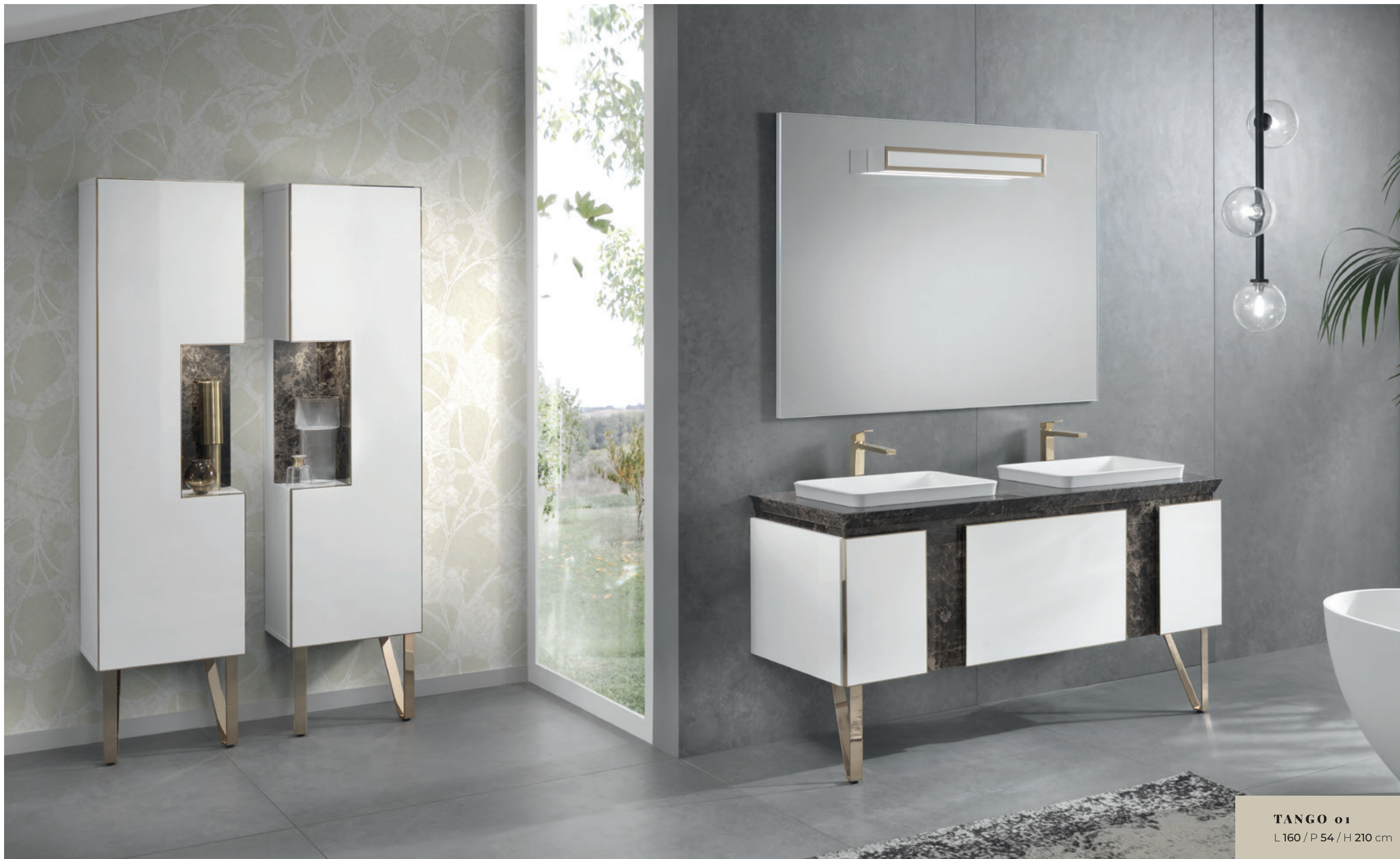
TANGO 01 L 160 / P 54 / H 210 cm