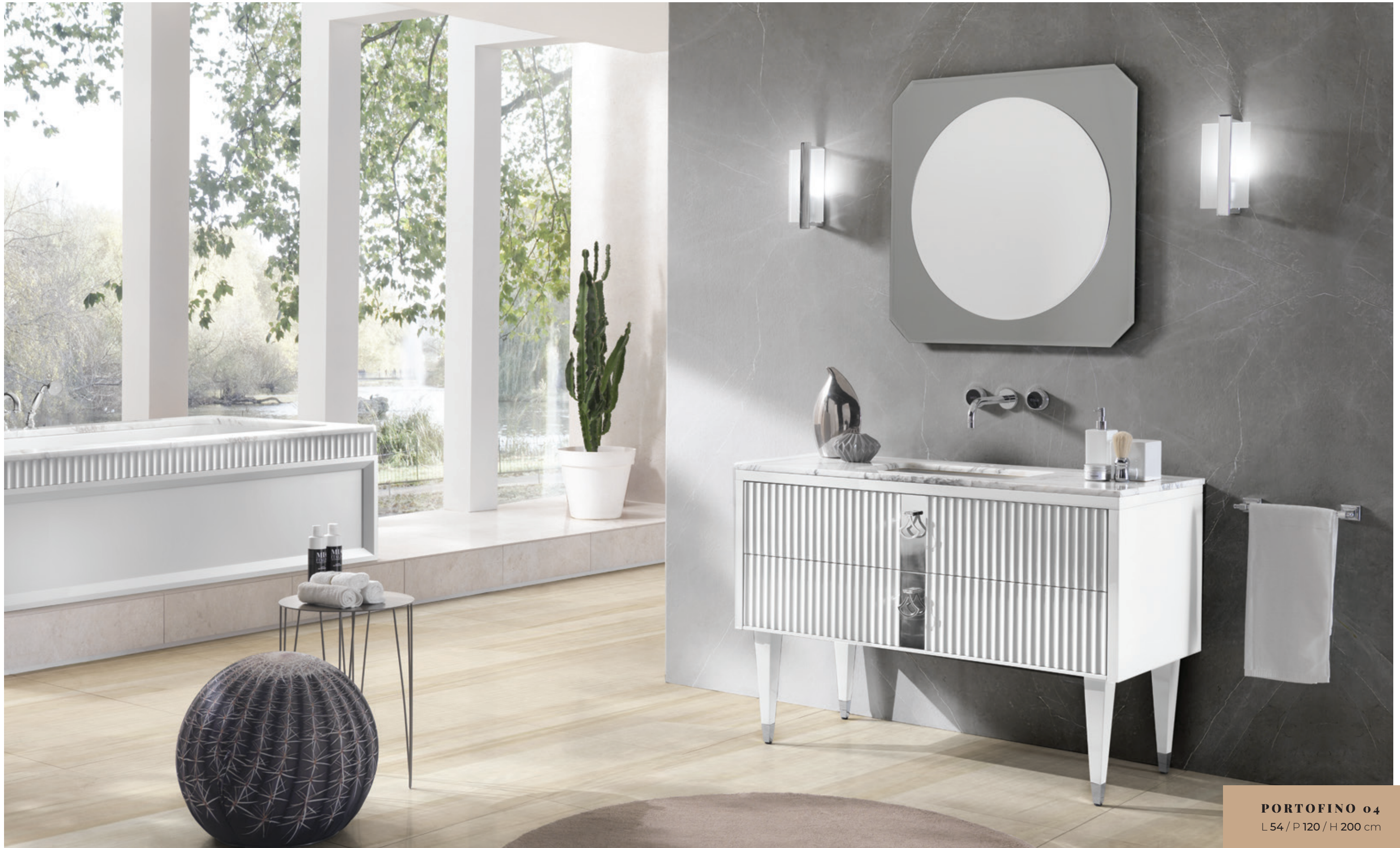
PORTOFINO 04 L 54 / P 120 / H 200 cm