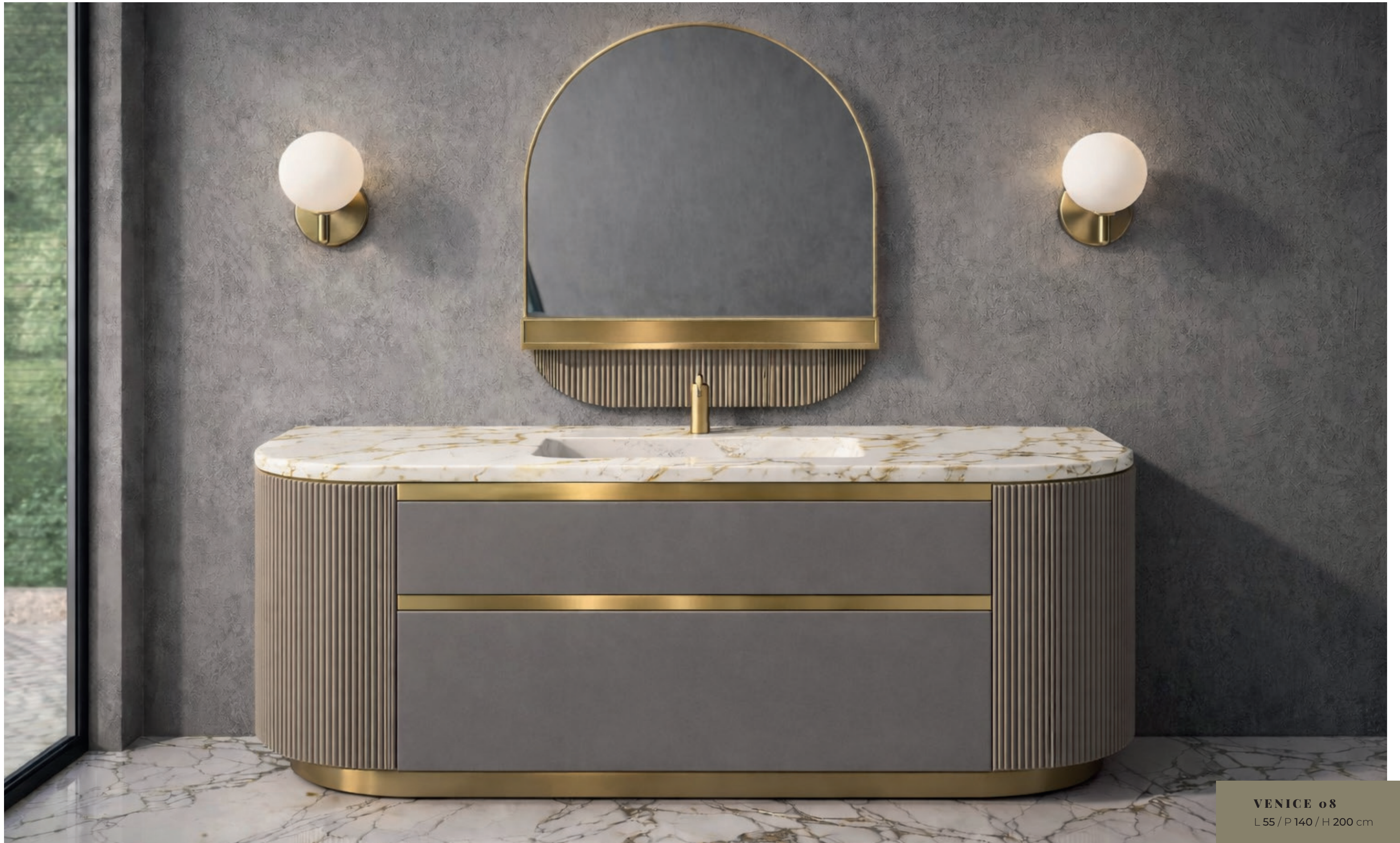
VENICE o8 L 55 / P 140 / H 200 cm