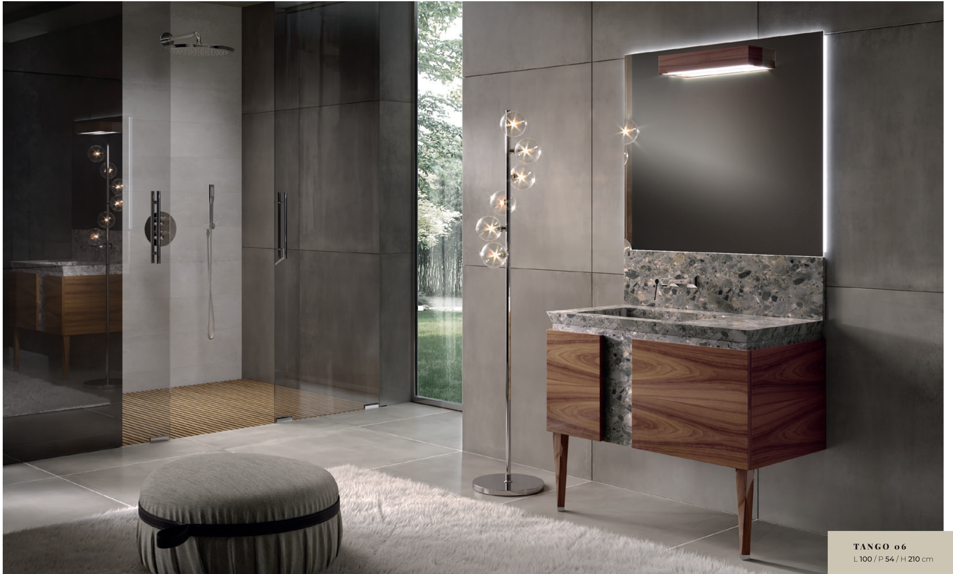
TANGO o6 L 100 / P 54 / H 210 cm