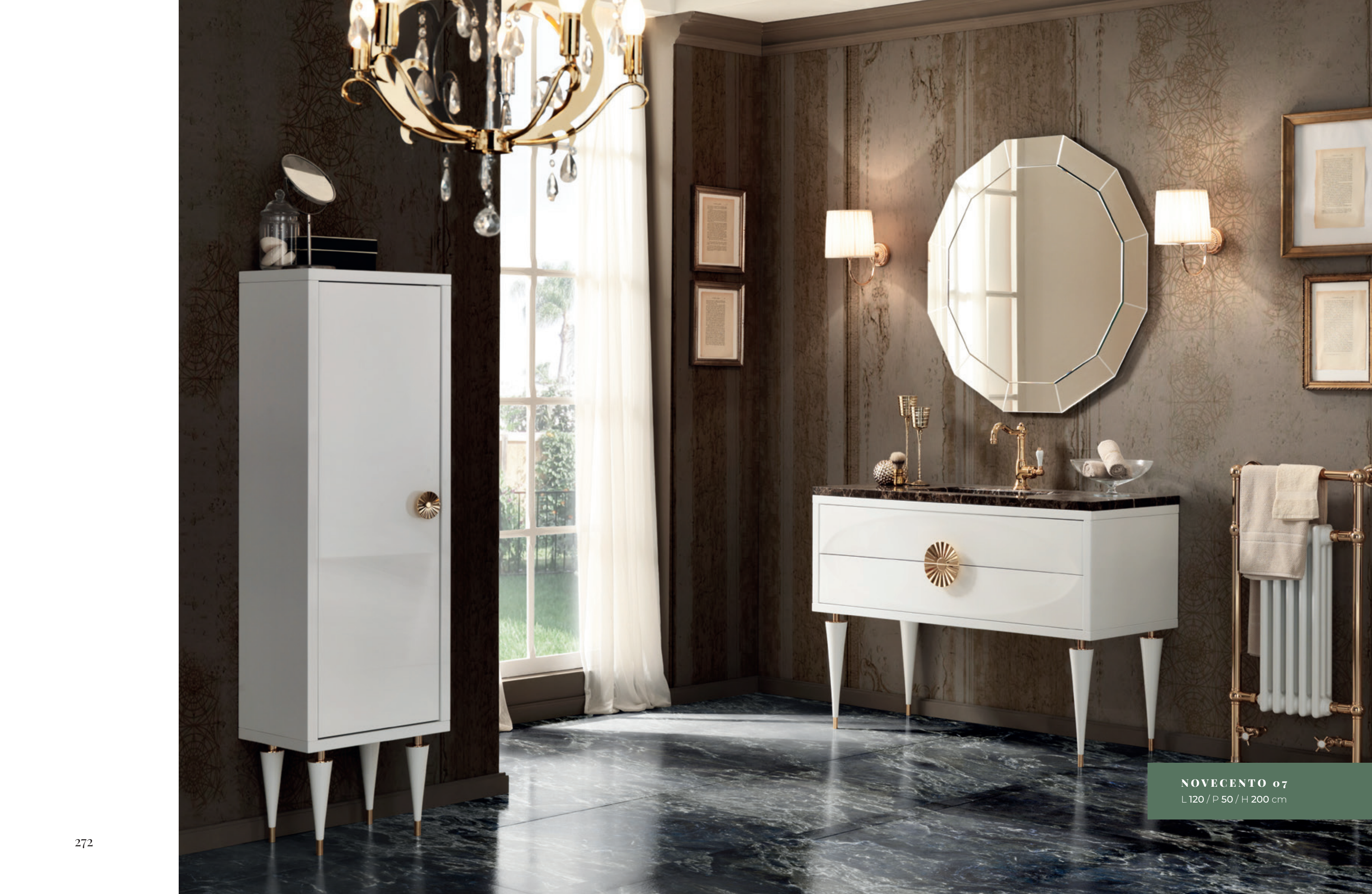
NOVECENTO 07 L120 / P 50 / H 200 cm