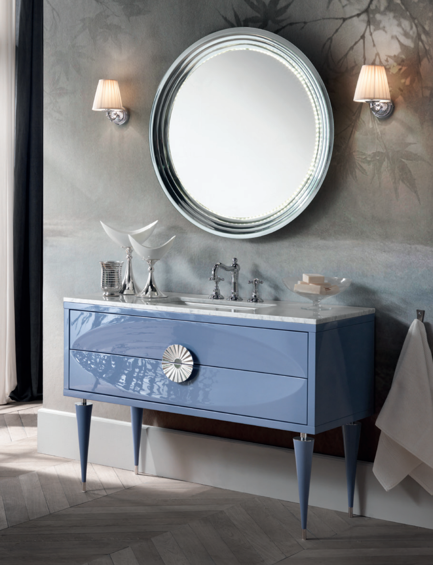
NOVECENTO 09 L100 / P 50 / H 200 cm