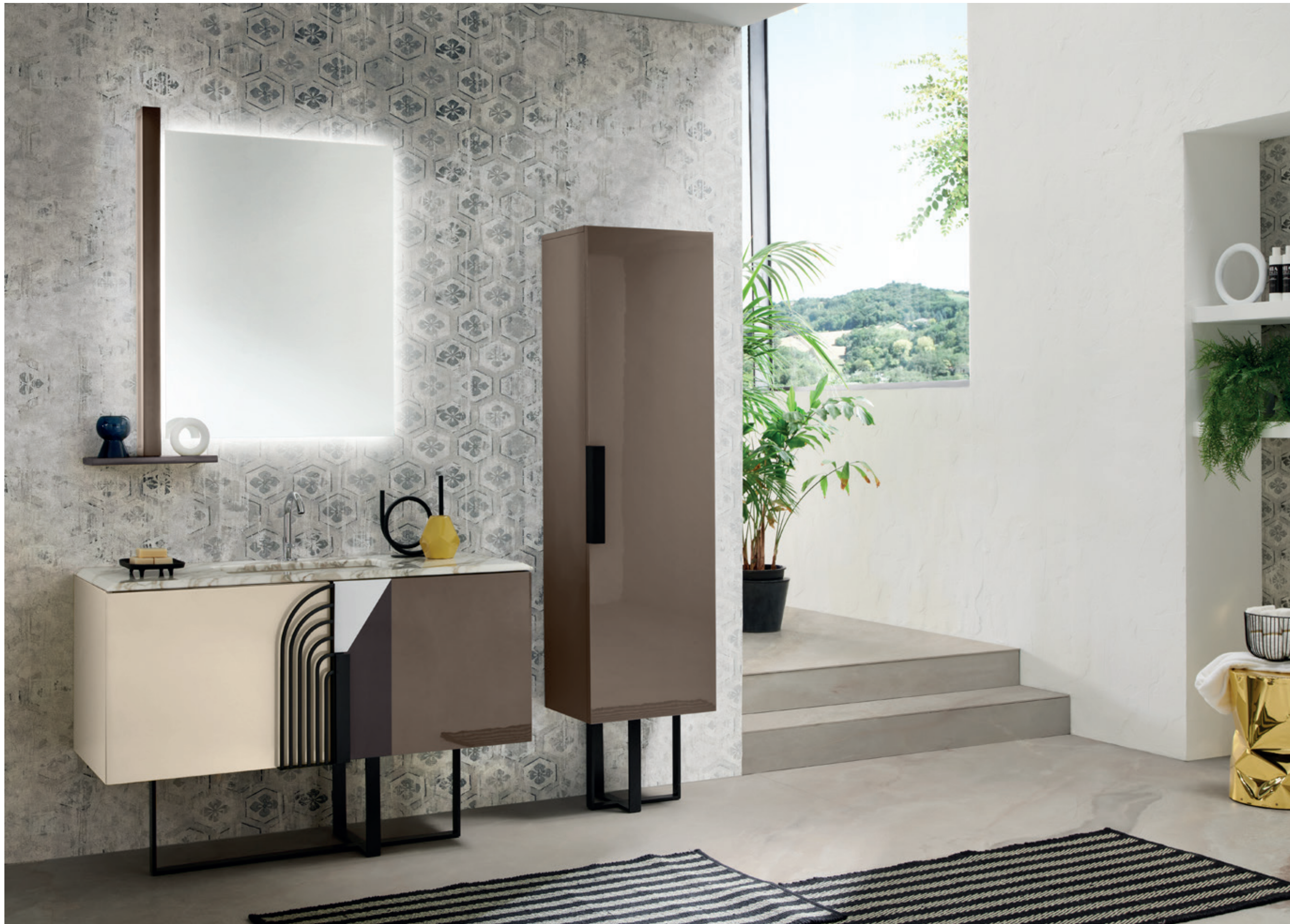
BALANCE 01 L 52 / P 190 / H 210 cm