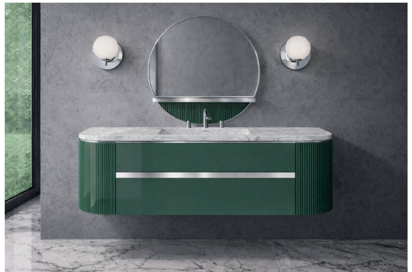
VENICE o6 L 55 / P 130 / H 200 cm