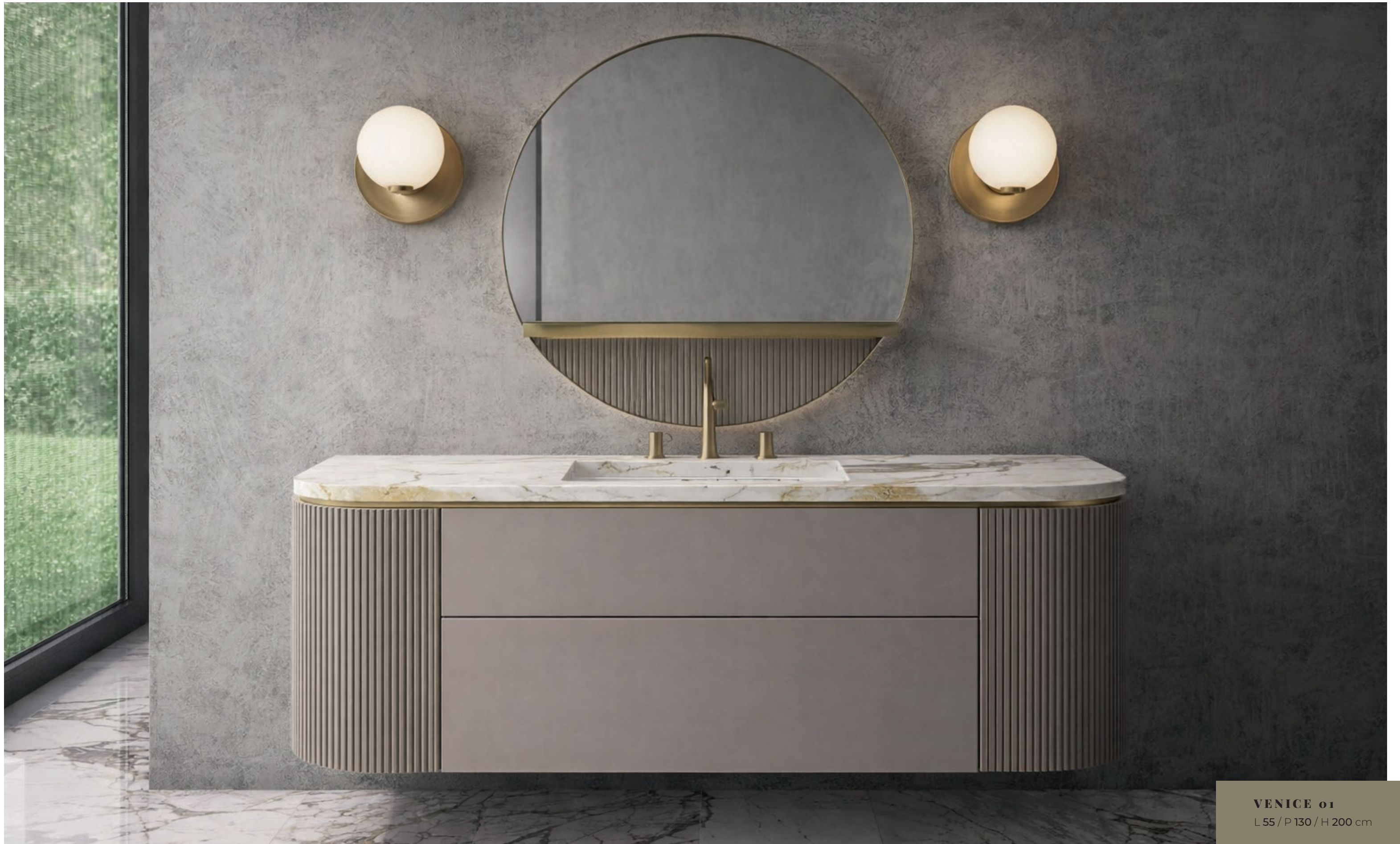
VENICE 01 L 55 / P 130 / H 200 cm