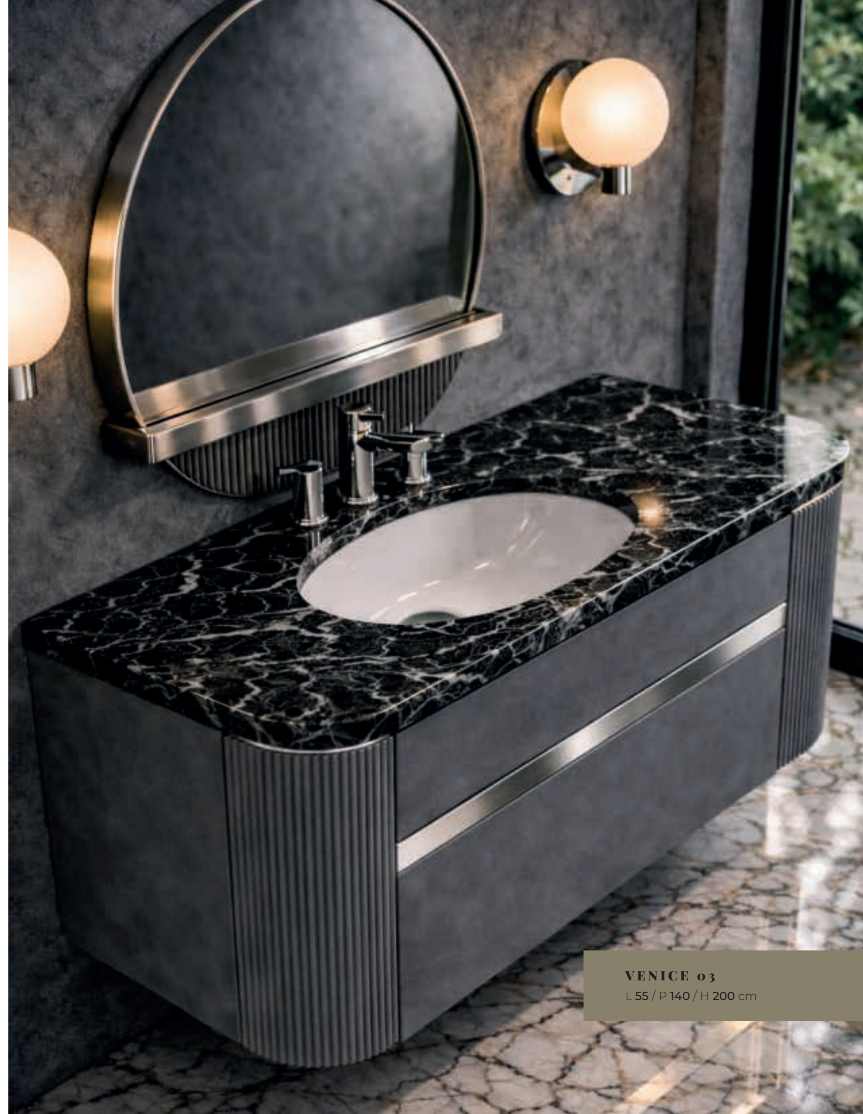
VENICE o3 L 55 / P 140 / H 200 cm