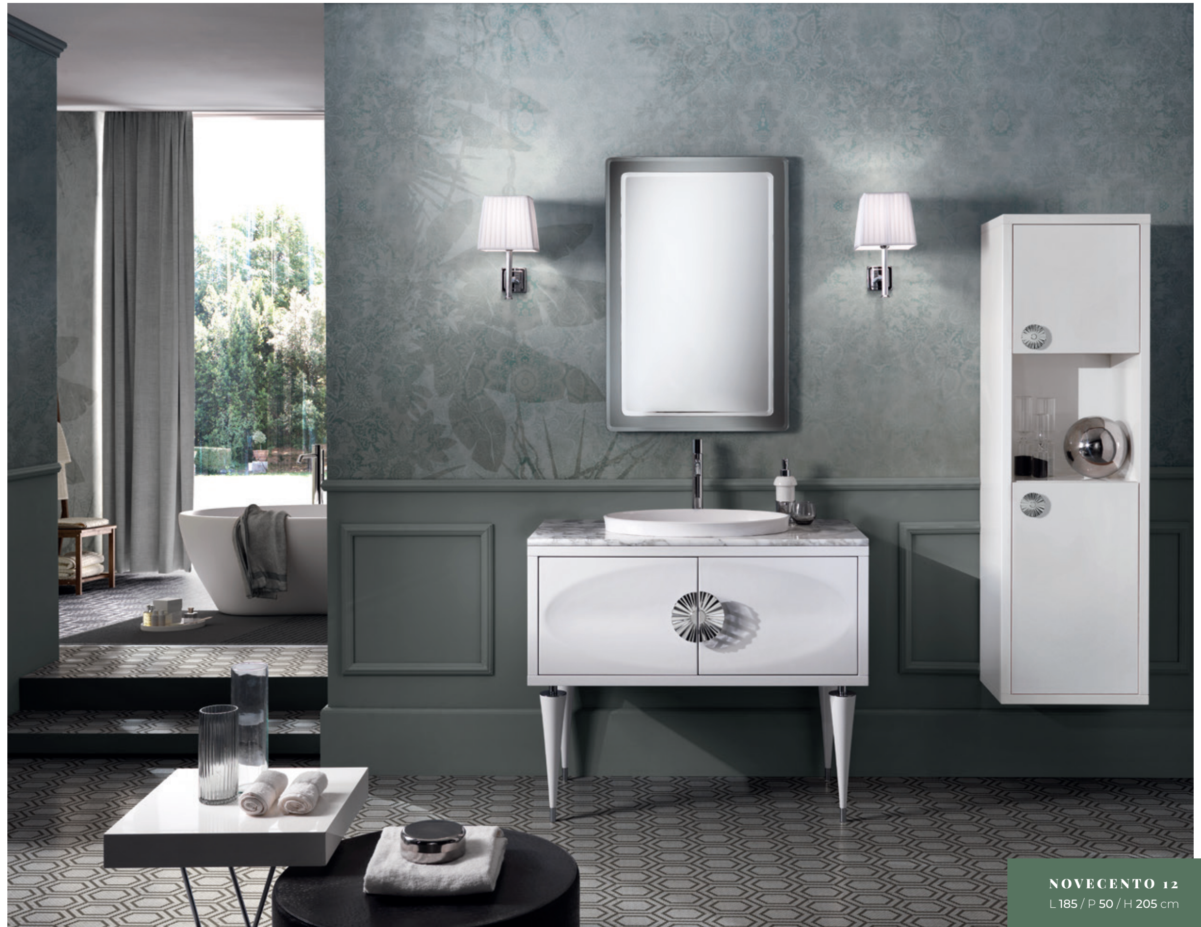
NOVECENTO 12 L185 / P 50 / H 205 cm