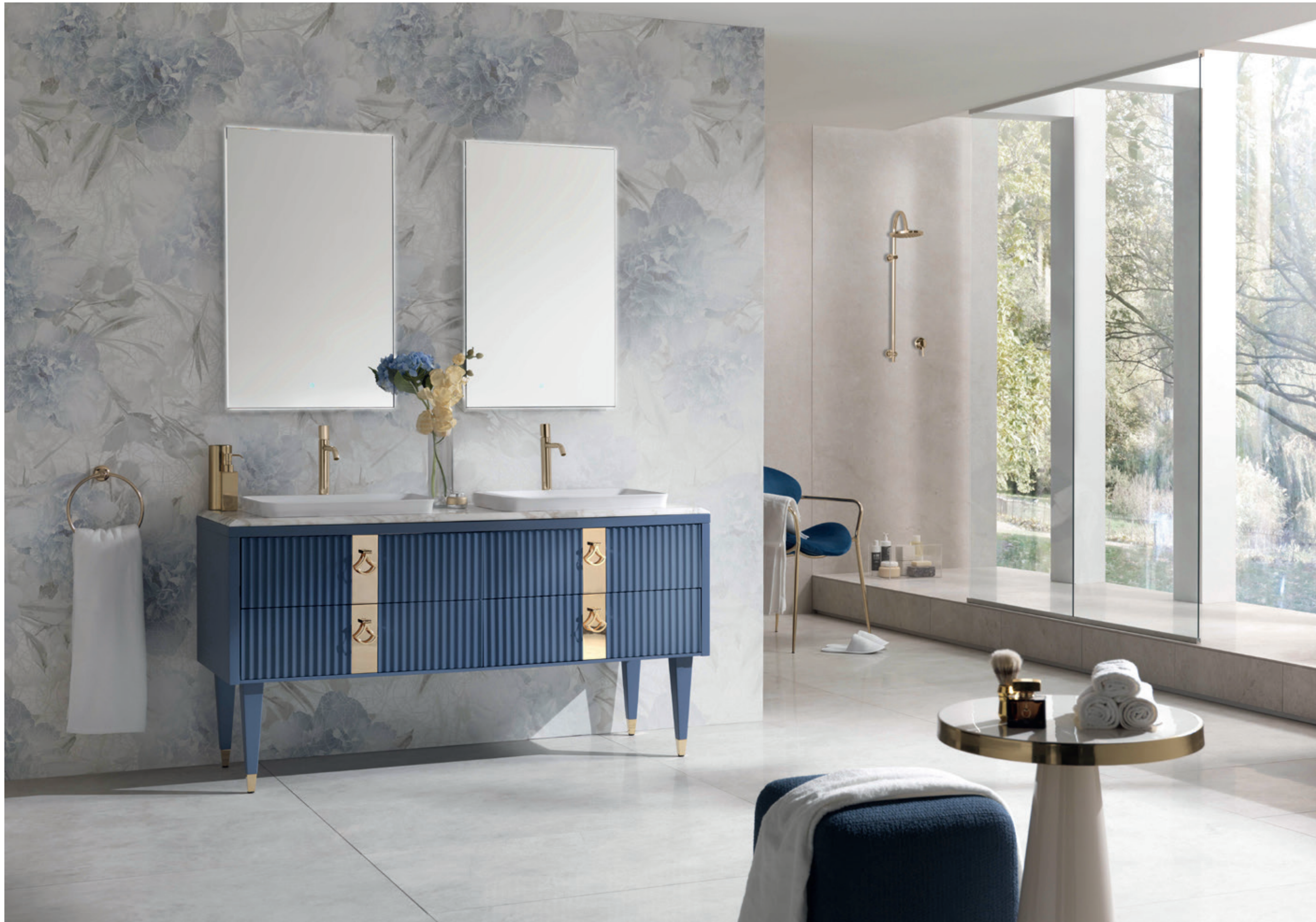
PORTOFINO 01 L 54 / P 156 / H 200 cm