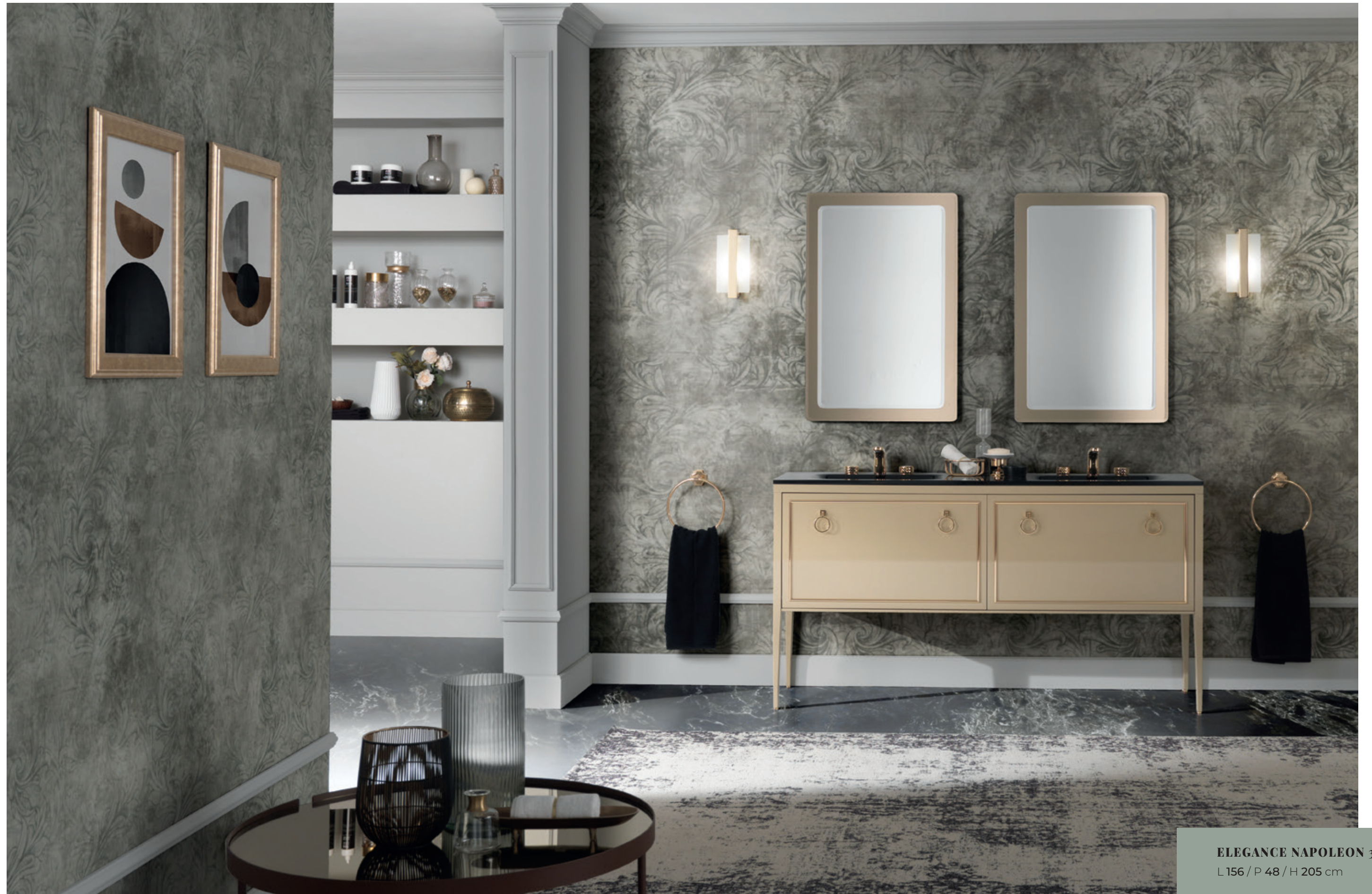
ELEGANCE NAPOLEON 31 L 156 / P 48 / H 205 cm