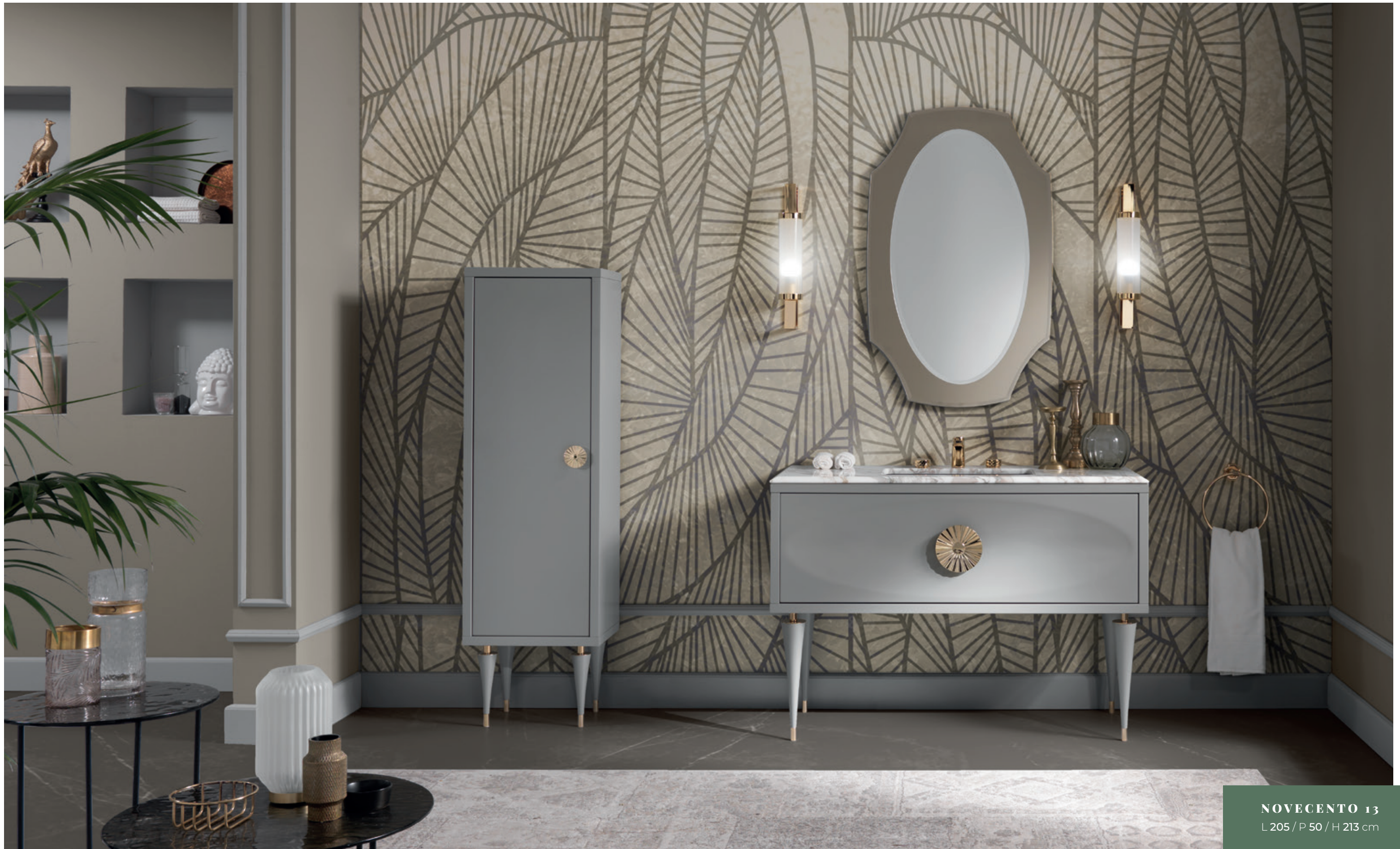
NOVECENTO 13 L 205 / P 50 / H 213 cm