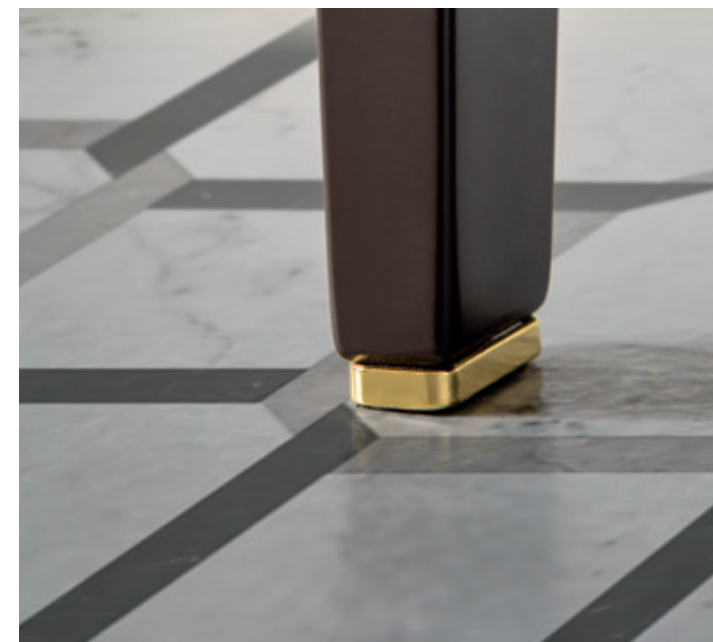
ELEGANCE NAPOLEON 23 L 180 / P 54 / H 200 cm