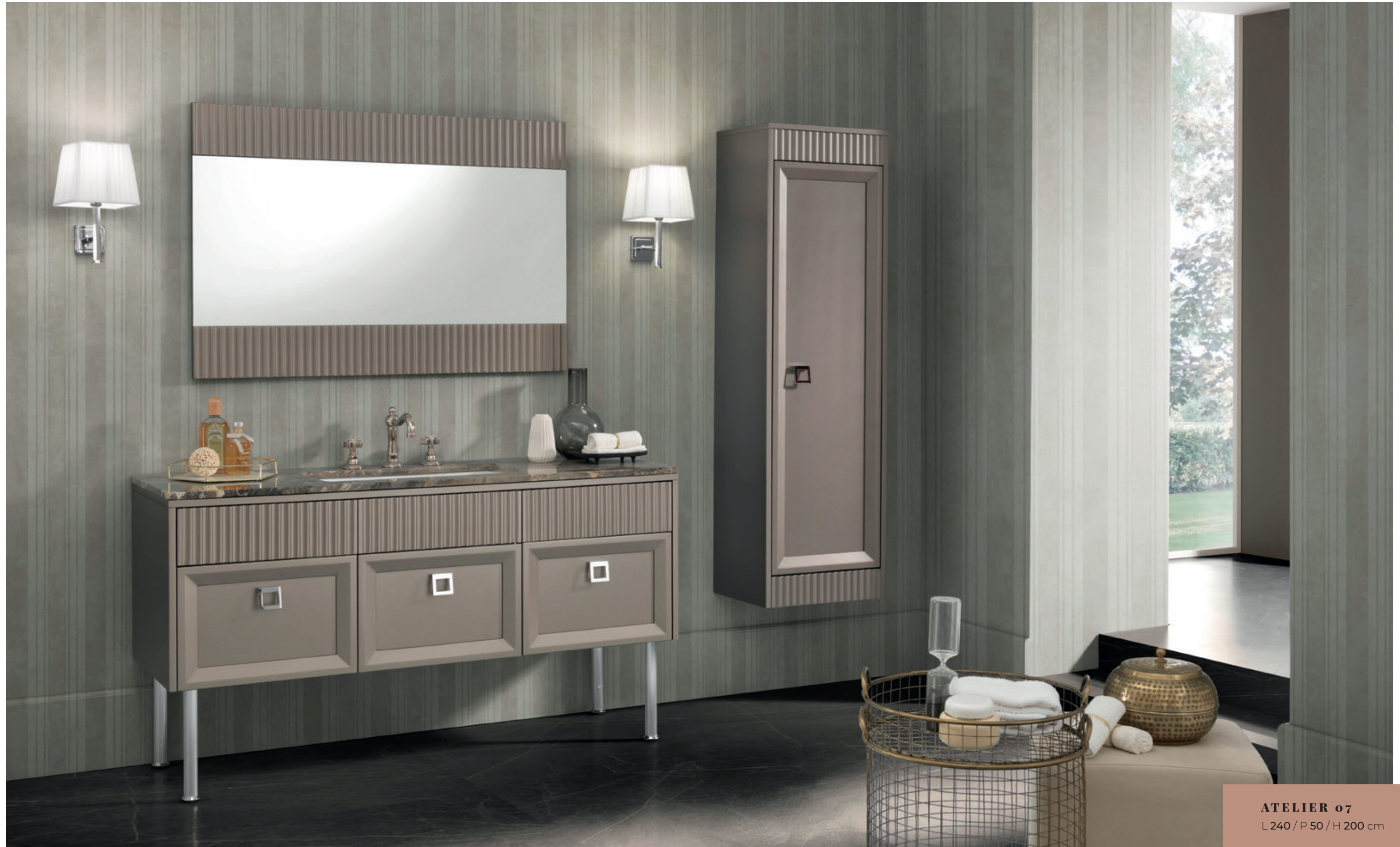
ATELIER 07 L 240 / P 50 / H 200 cm