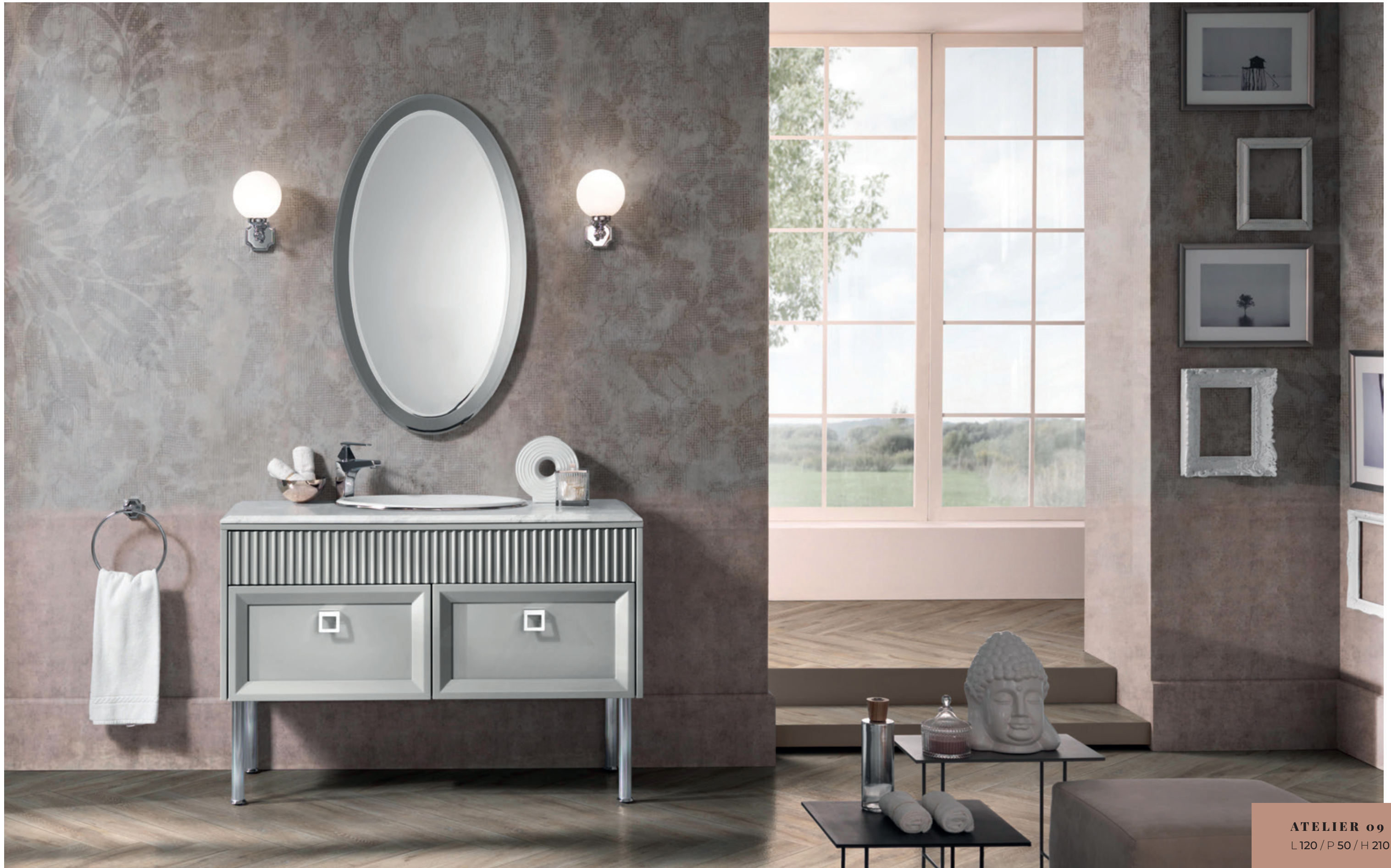
ATELIER 09 L 120 / P 50 / H 210 cm