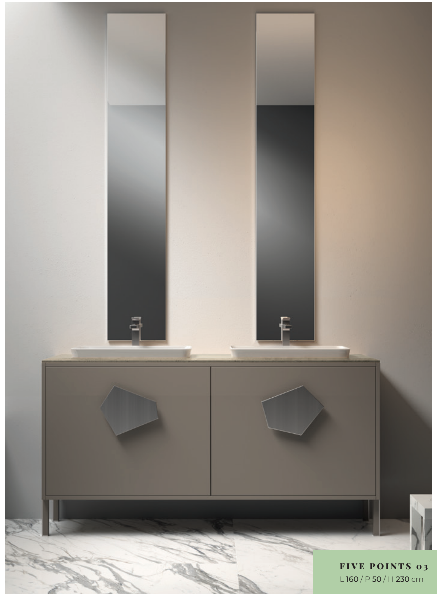
FIVE POINTS 03 L160 / P 50 / H 230 cm