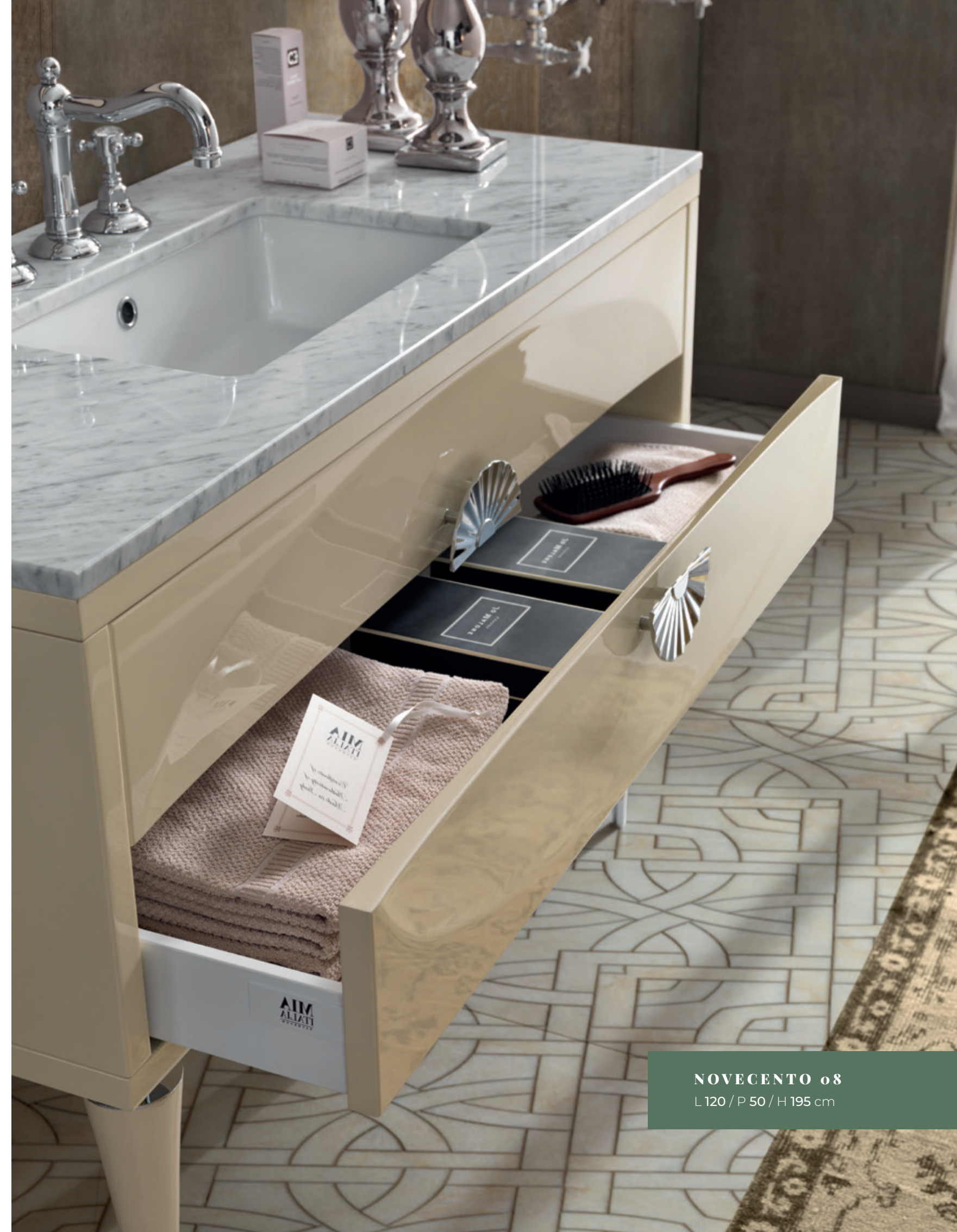
NOVECENTO o8 L120 / P 50 / H 195 cm