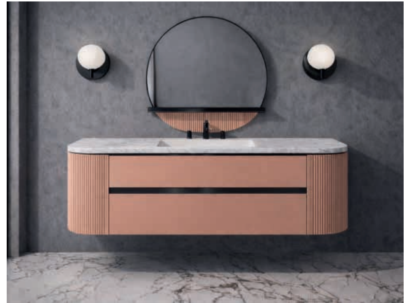
VENICE 04 L 55 / P 120 / H 200 cm