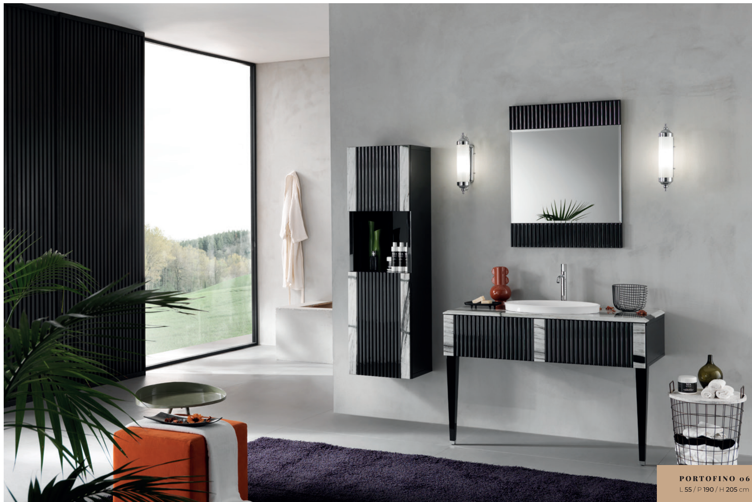
PORTOFINO 06 L 55 / P 190 / H 205 cm