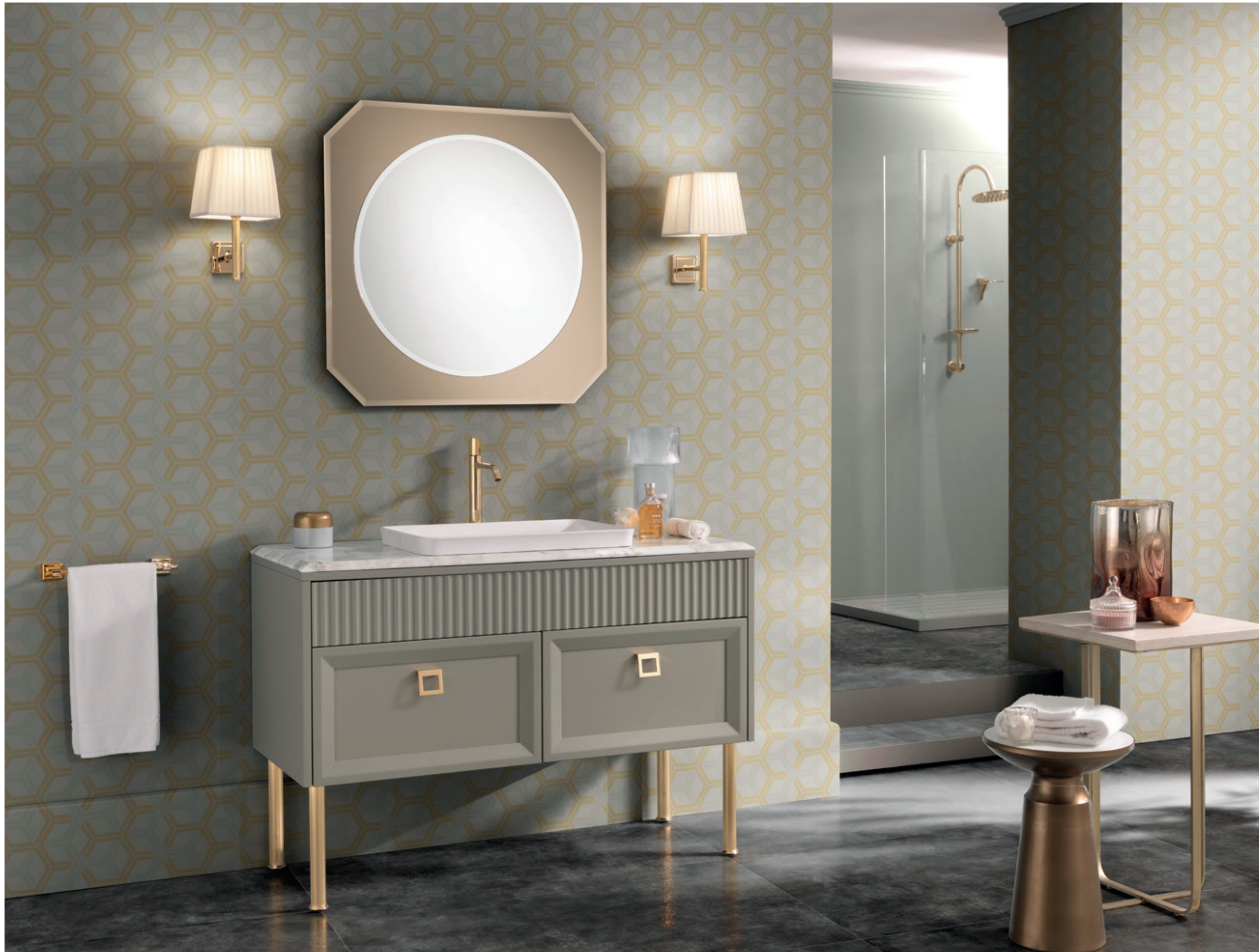
ATELIER 05 L 120 / P 50 / H 200 cm