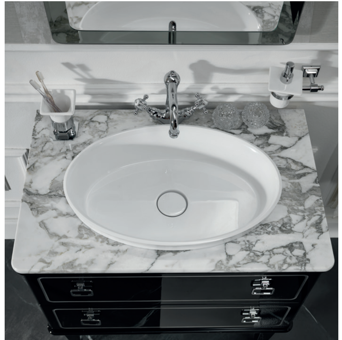
TORINO 03 L 51 / P 220 / H 200 cm