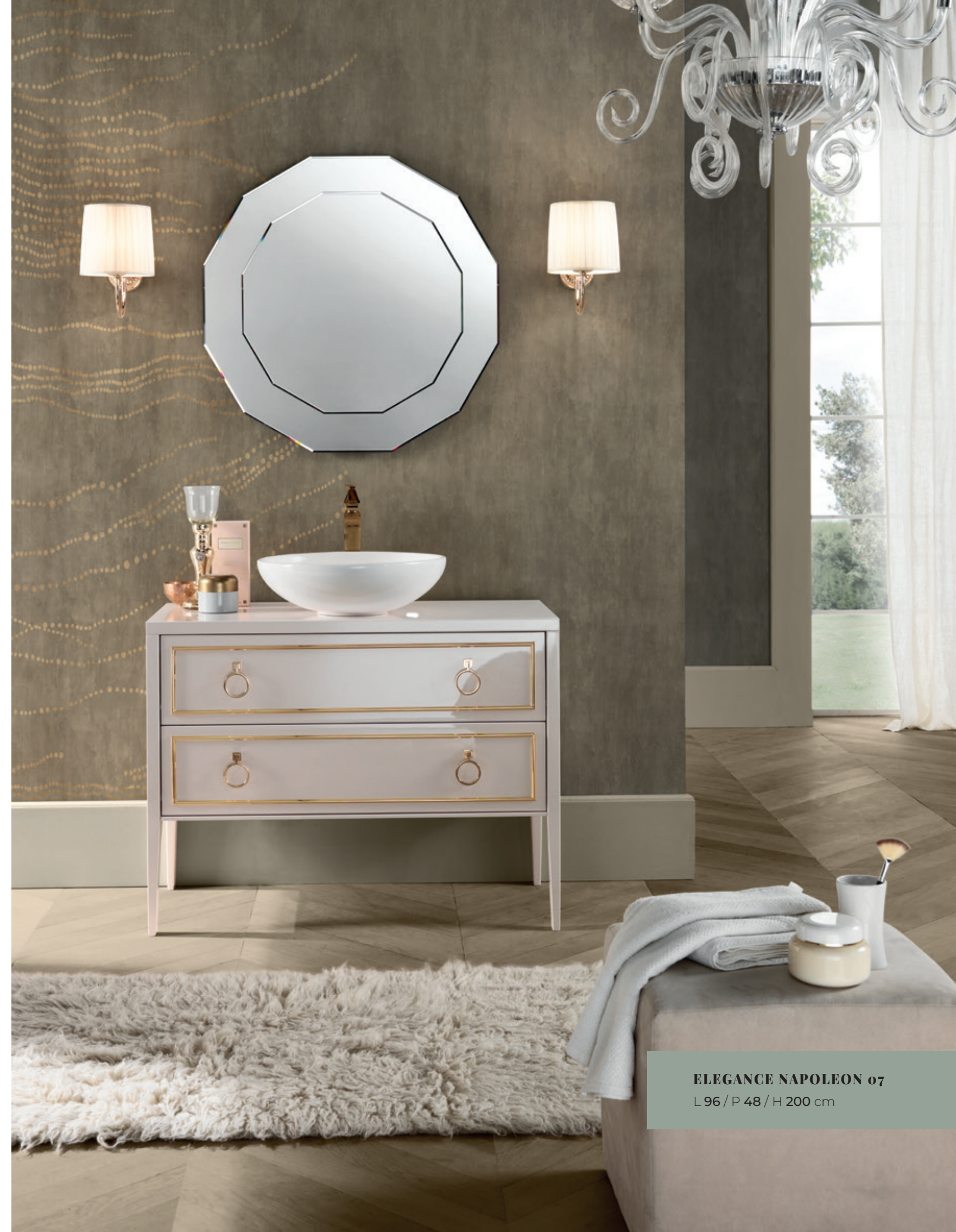
ELEGANCE NAPOLEON 07 L 96 / P 48 / H 200 cm