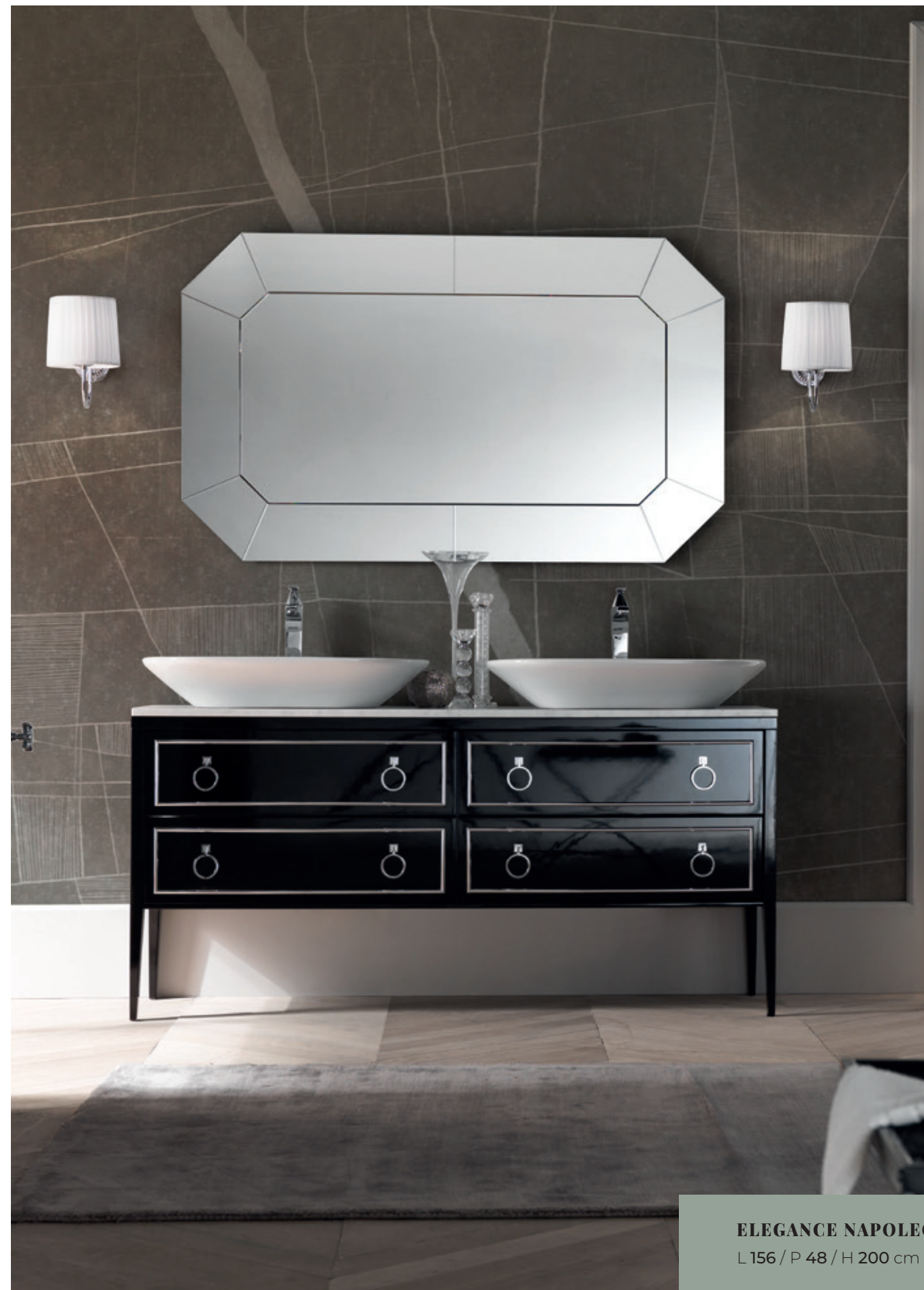
ELEGANCE NAPOLEON 02 L 156 / P 48 / H 200 cm