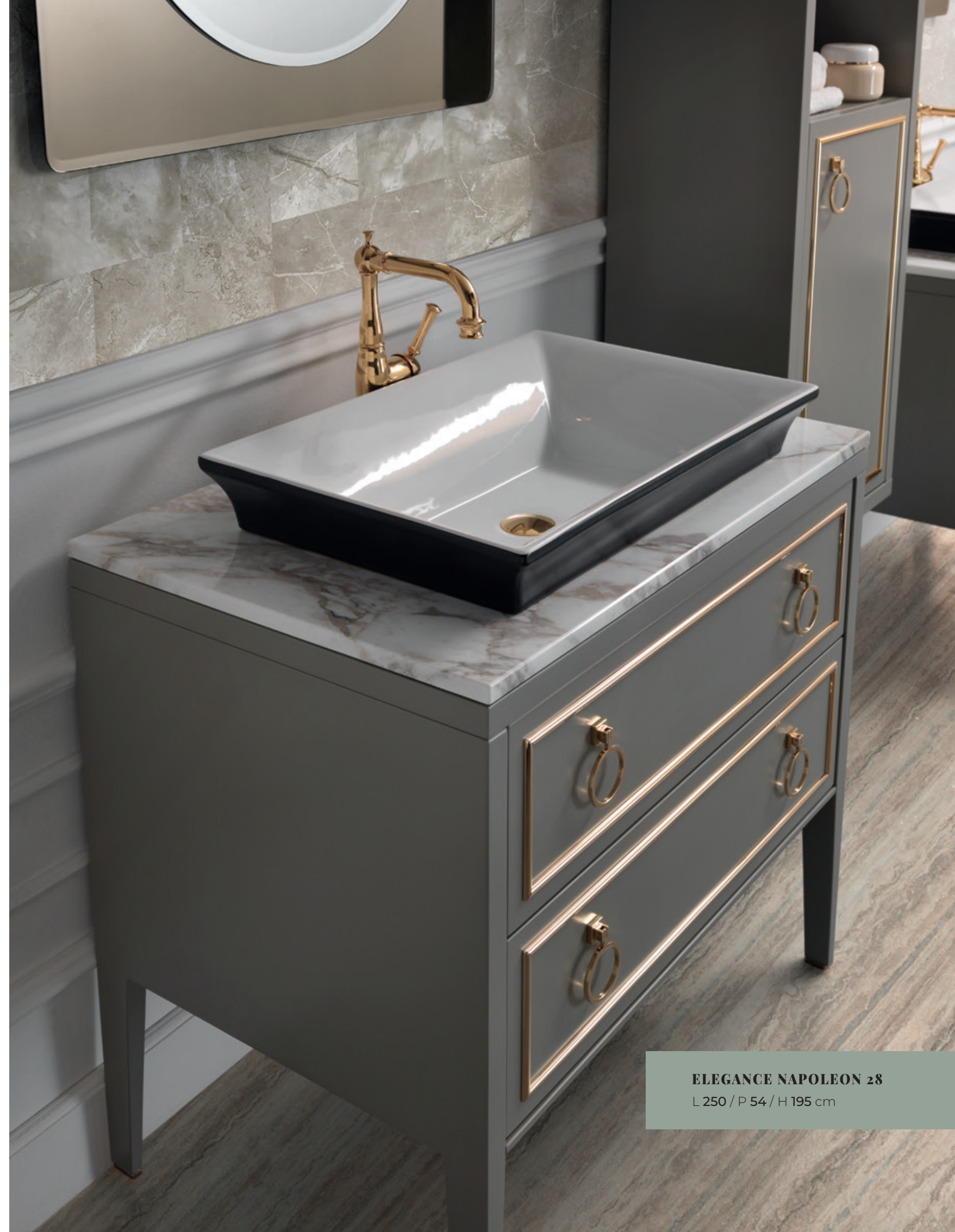
ELEGANCE NAPOLEON 28 L 250 / P 54 / H 195 cm