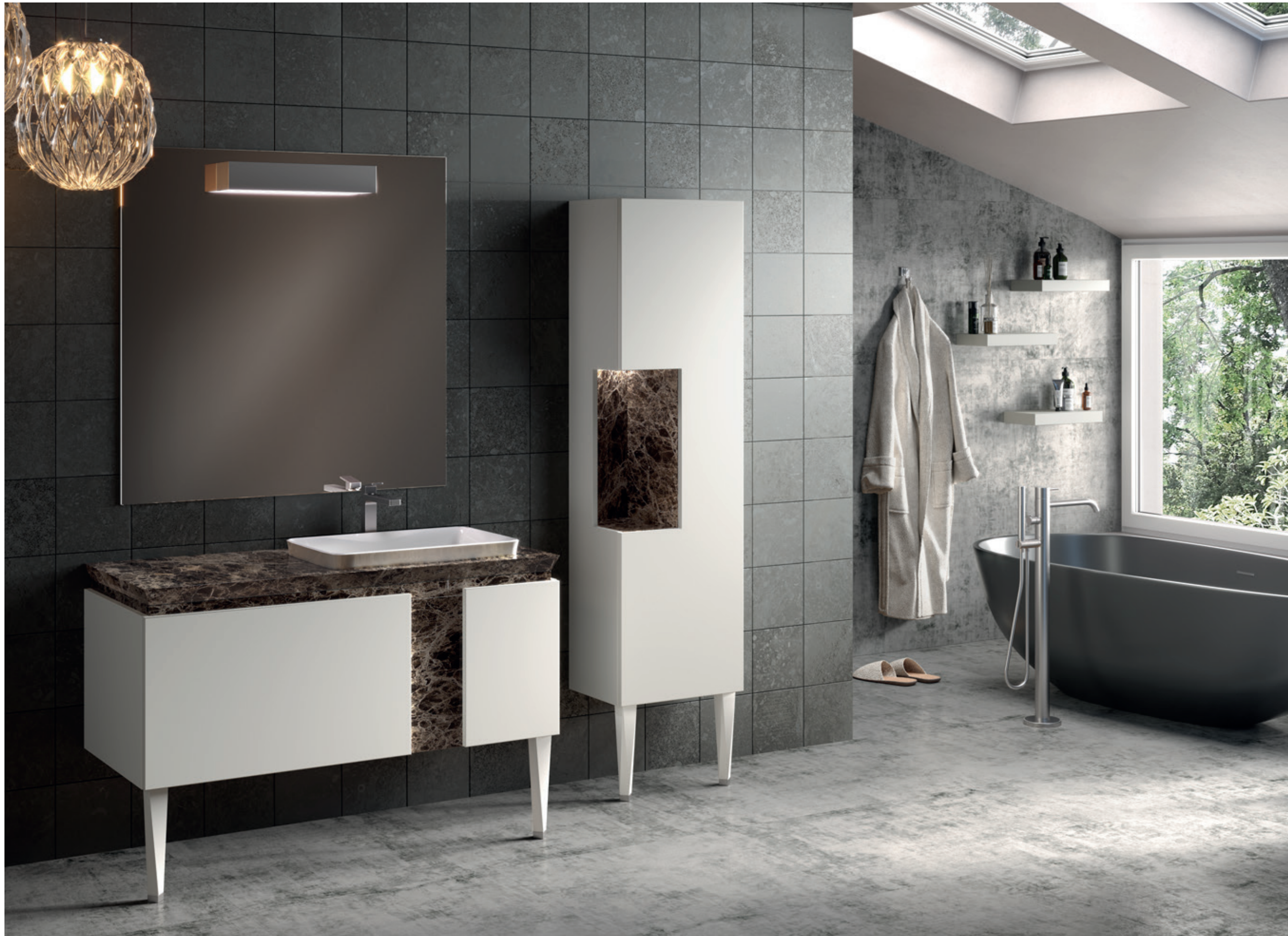
TANGO 04 L 195 / P 54 / H 200 cm