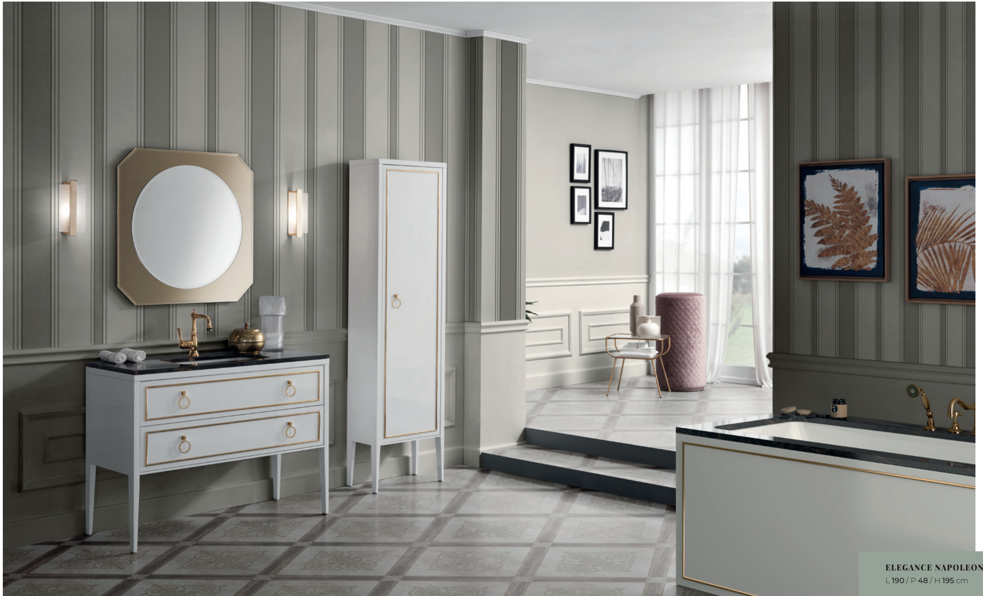
ELEGANCE NAPOLEON 26 L 190 / P 48 / H 195 cm