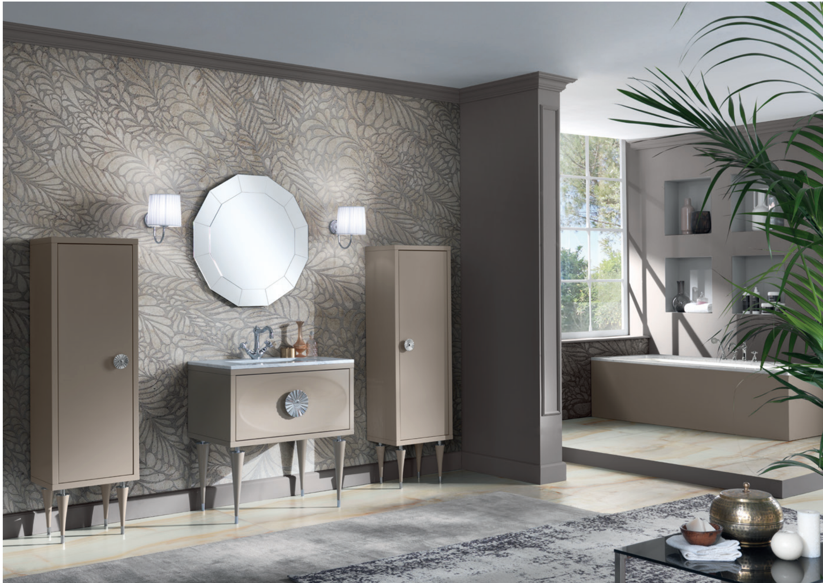
NOVECENTO 15 L 210 / P 50 / H 195 cm