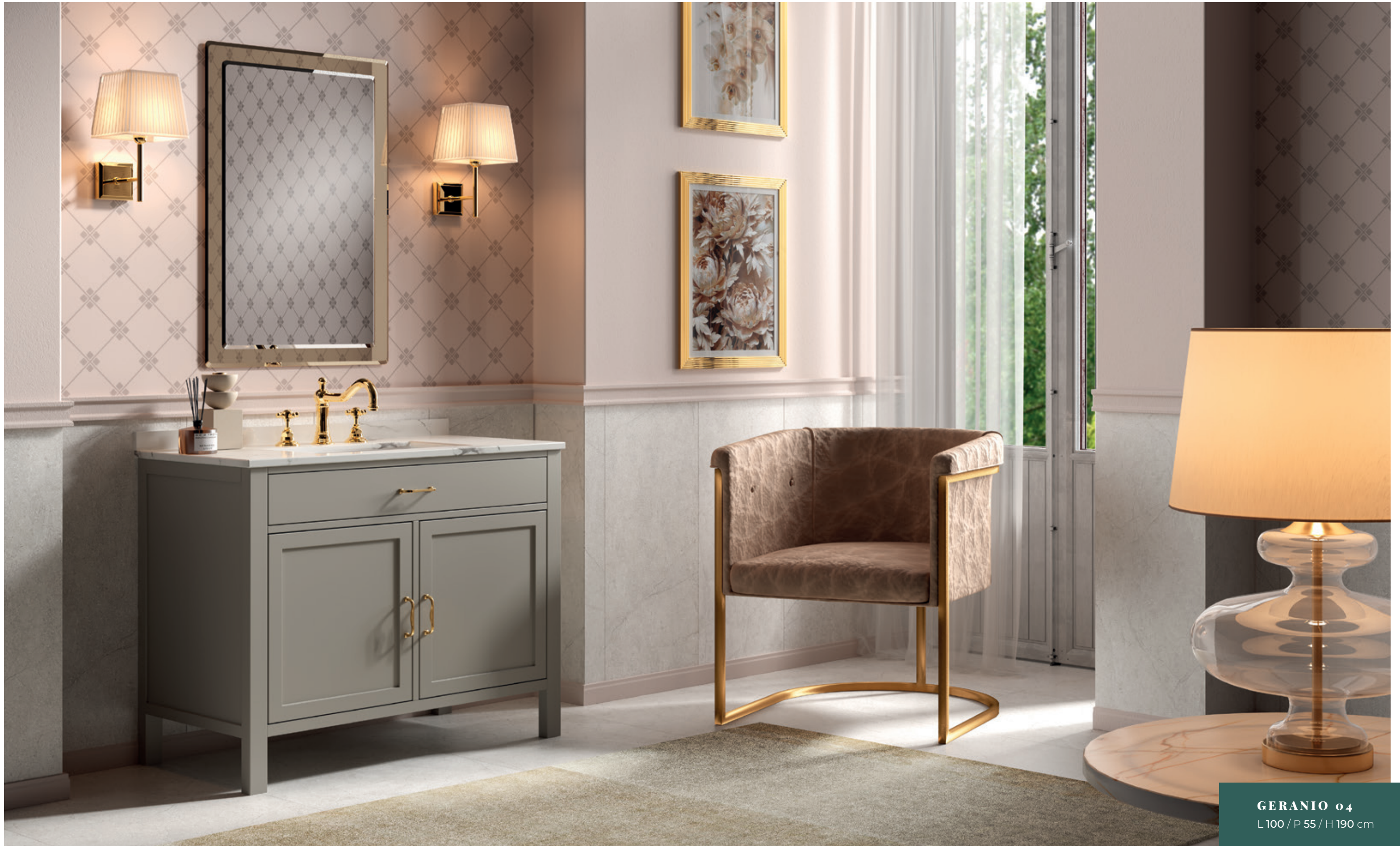
GERANIO 04 L100 / P 55 / H 190 cm