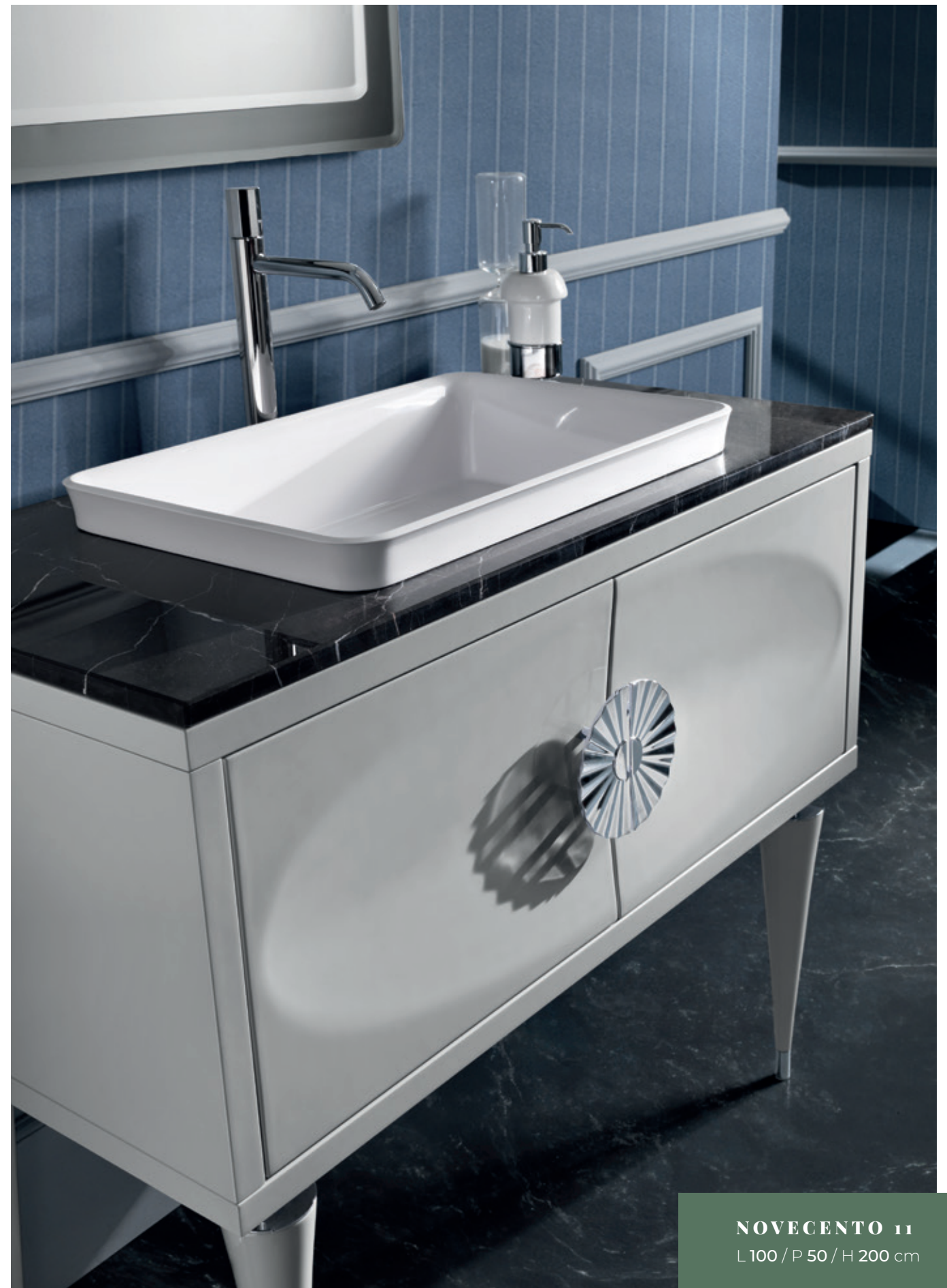
NOVECENTO 11 L100 / P 50 / H 200 cm