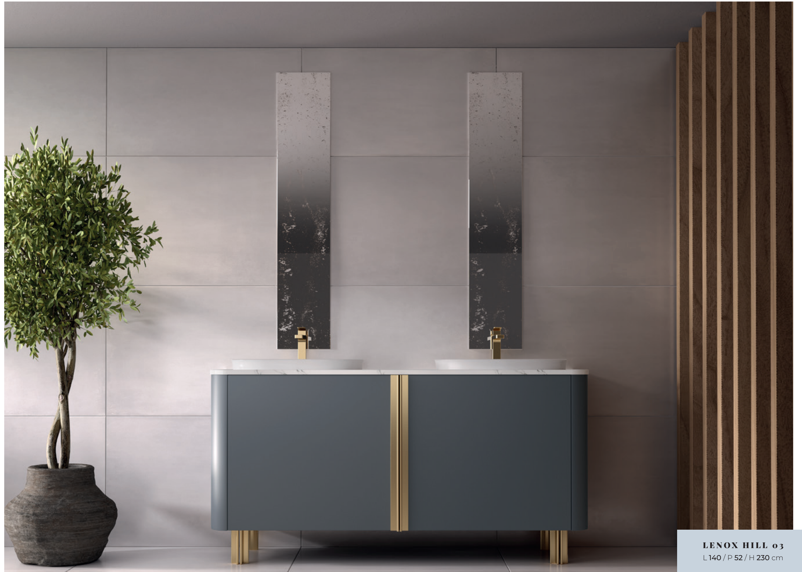
LENOX HILL 03 L140 / P 52 / H 230 cm