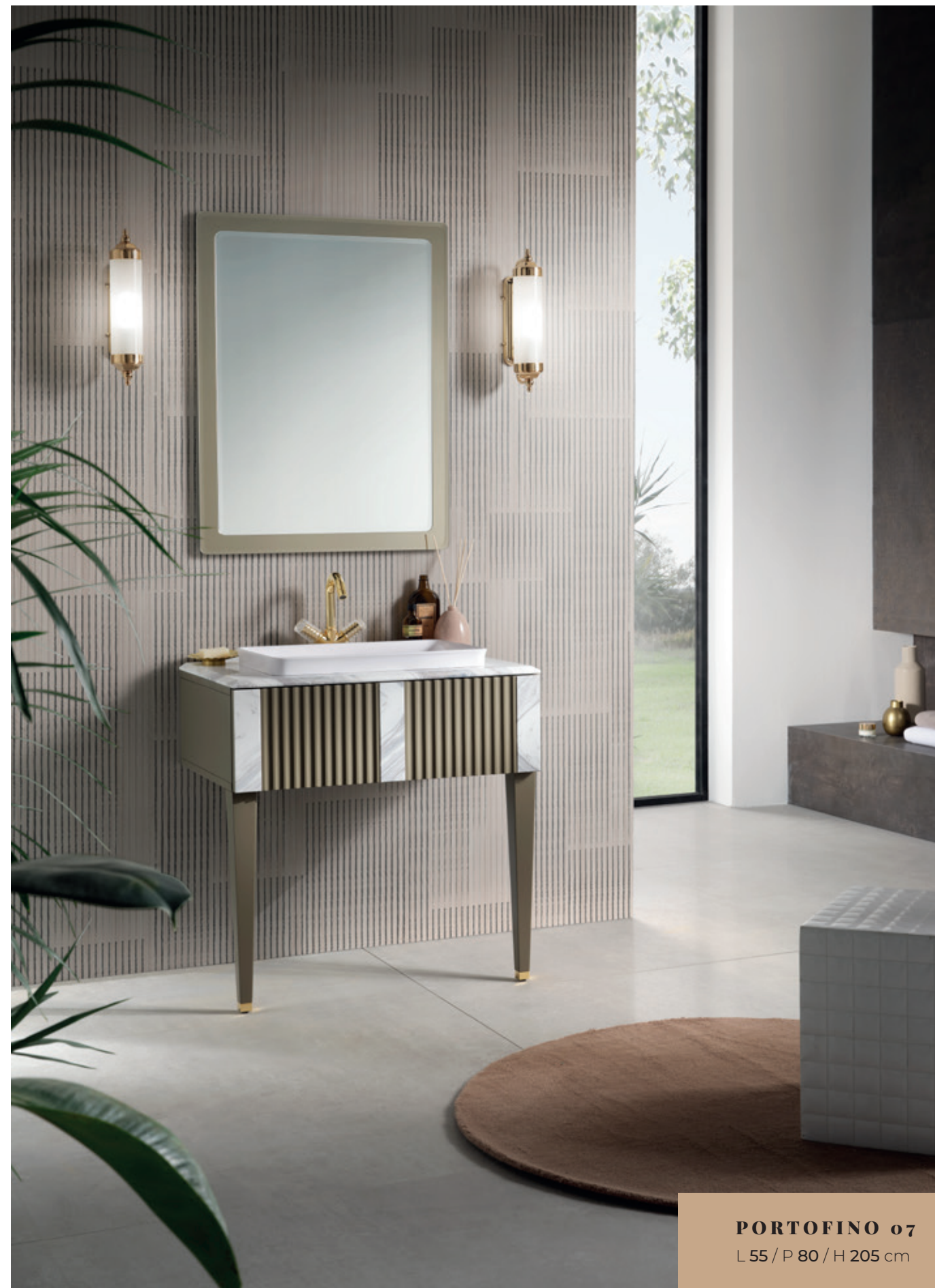
PORTOFINO 07 L 55 / P 80 / H 205 cm