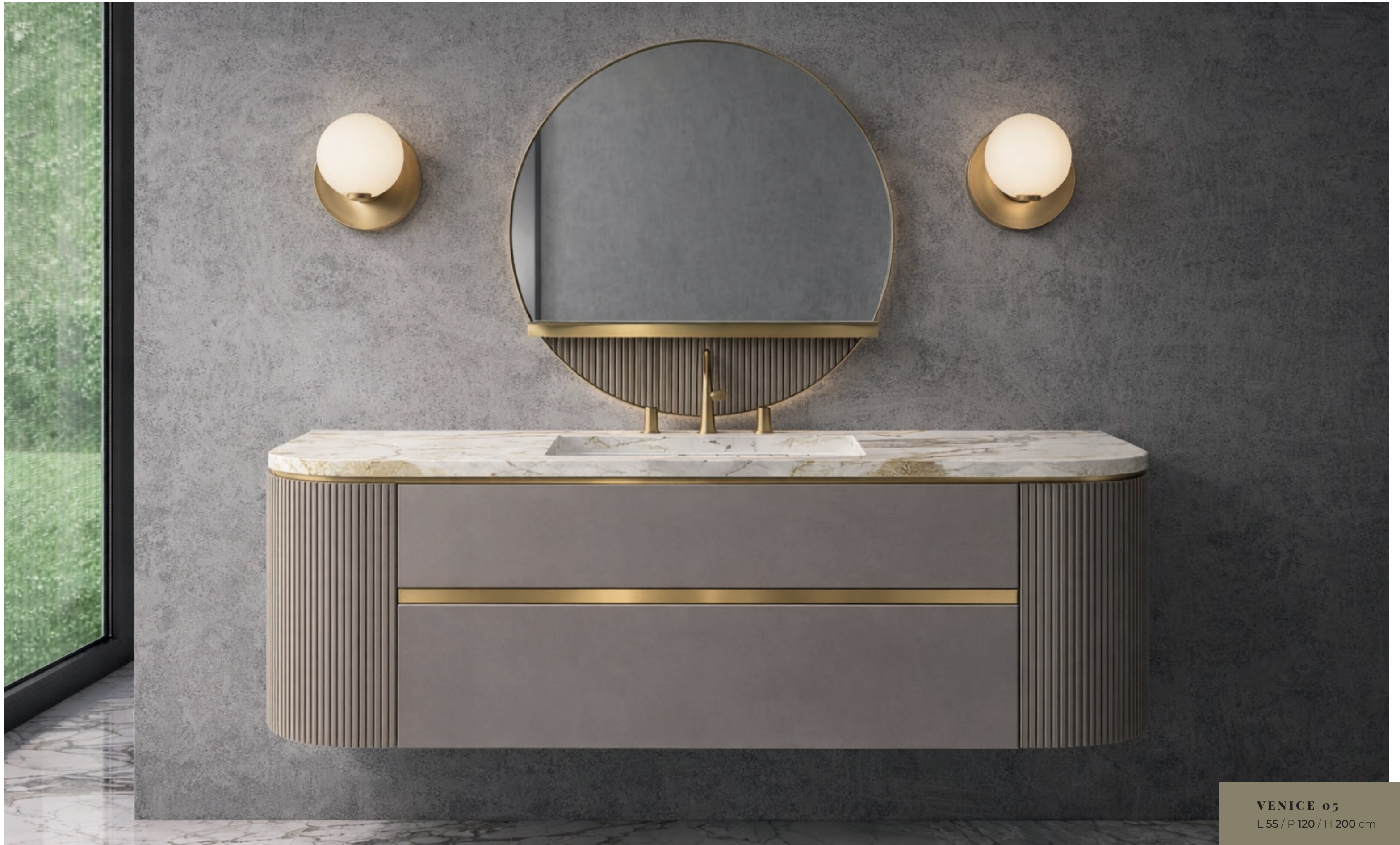
VENICE 05 L 55 / P 120 / H 200 cm