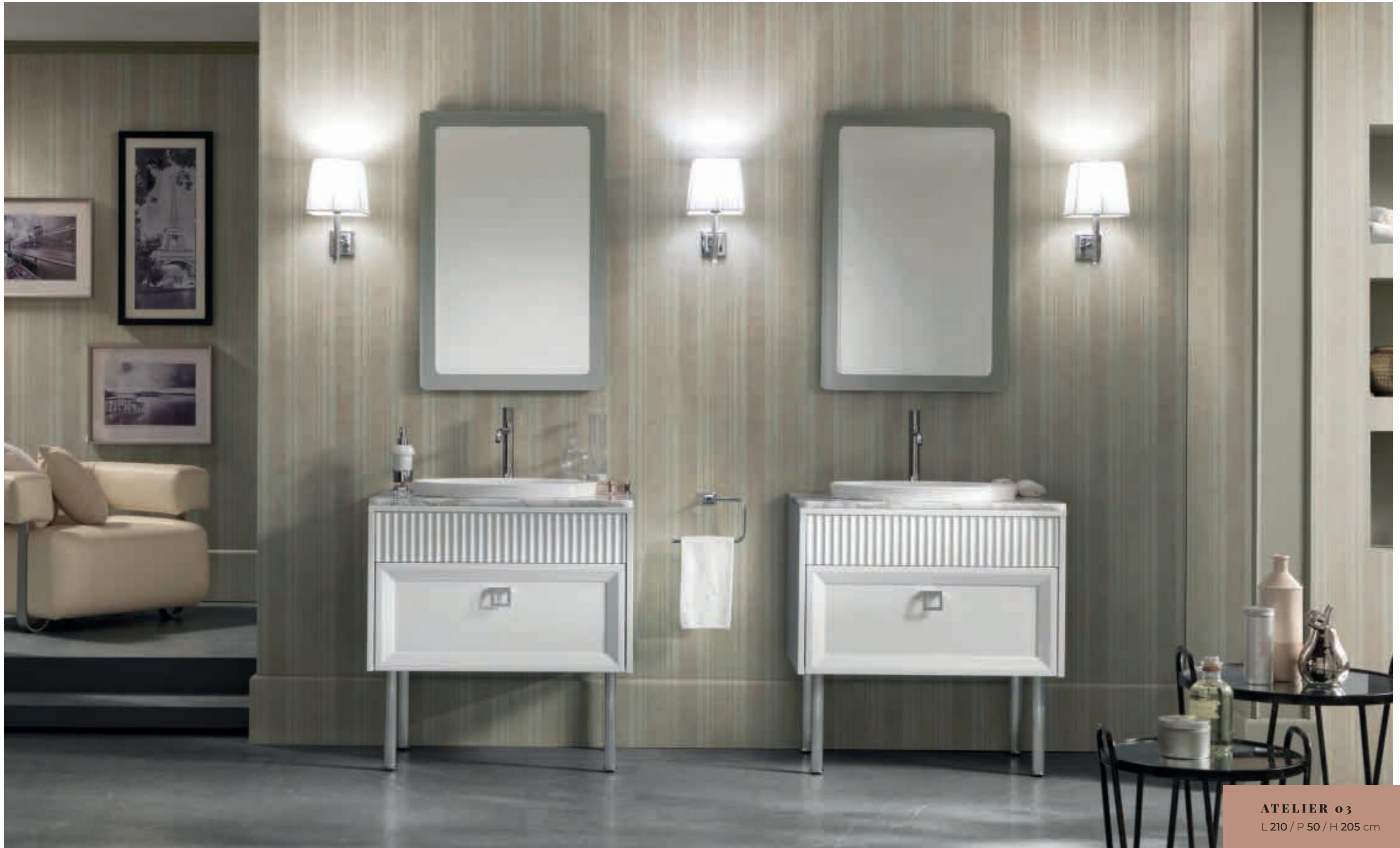
ATELIER 03 L 210 / P 50 / H 205 cm