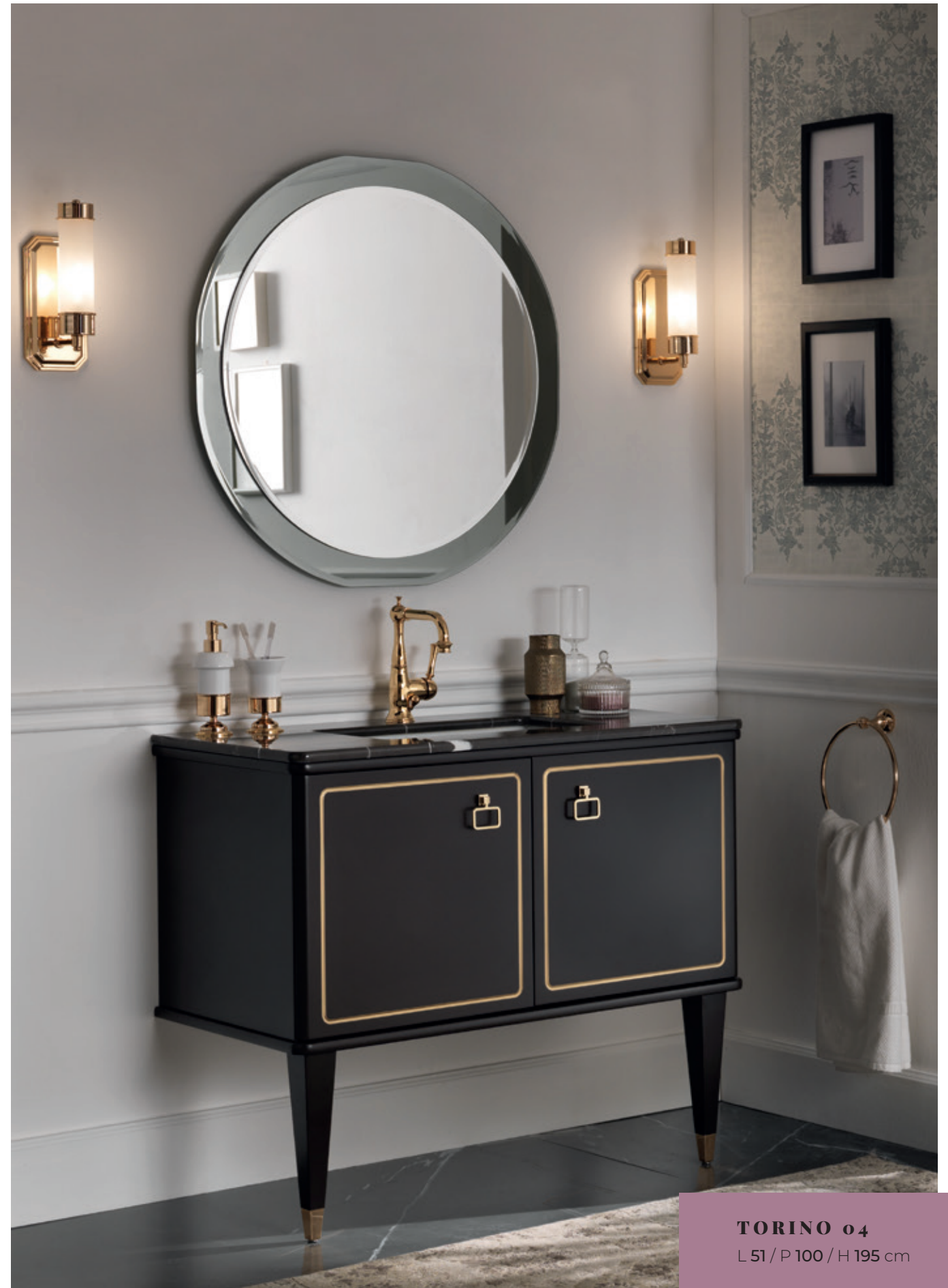
TORINO 04 L 51 / P 100 / H 195 cm