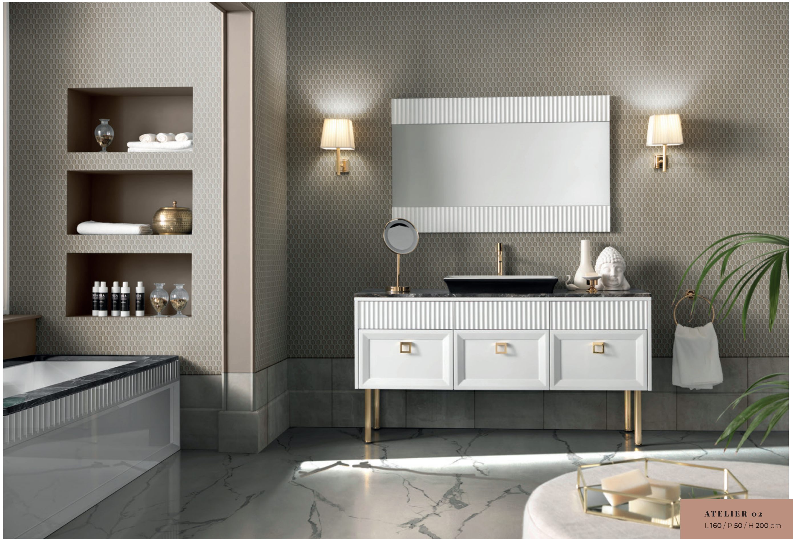
ATELIER o2 L160 / P 50 / H 200 cm