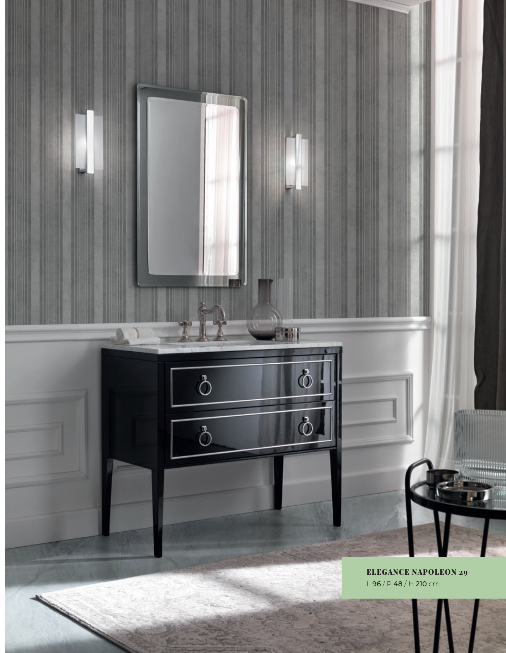
ELEGANCE NAPOLEON 29