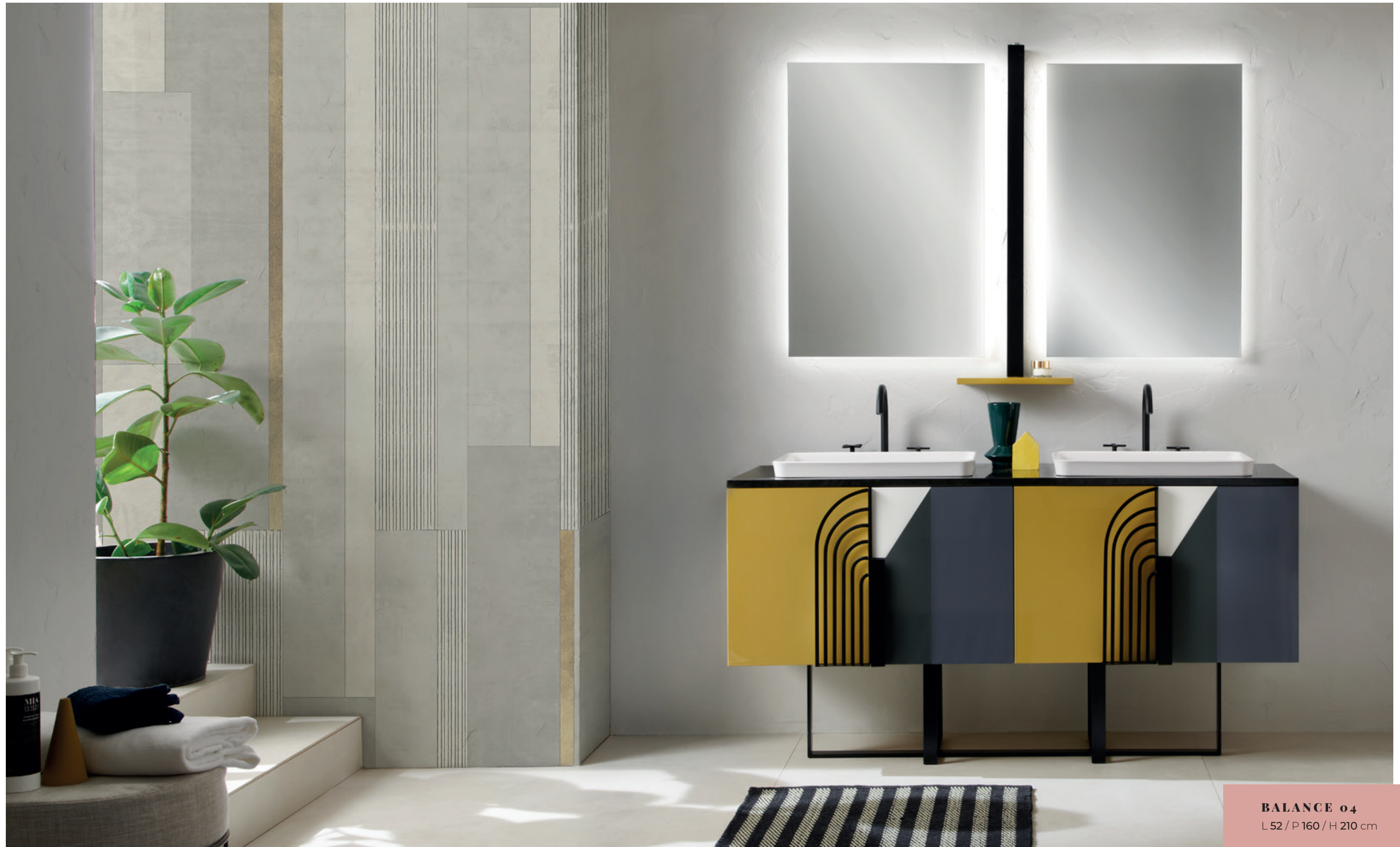
BALANCE 04 L 52 / P 160 / H 210 cm