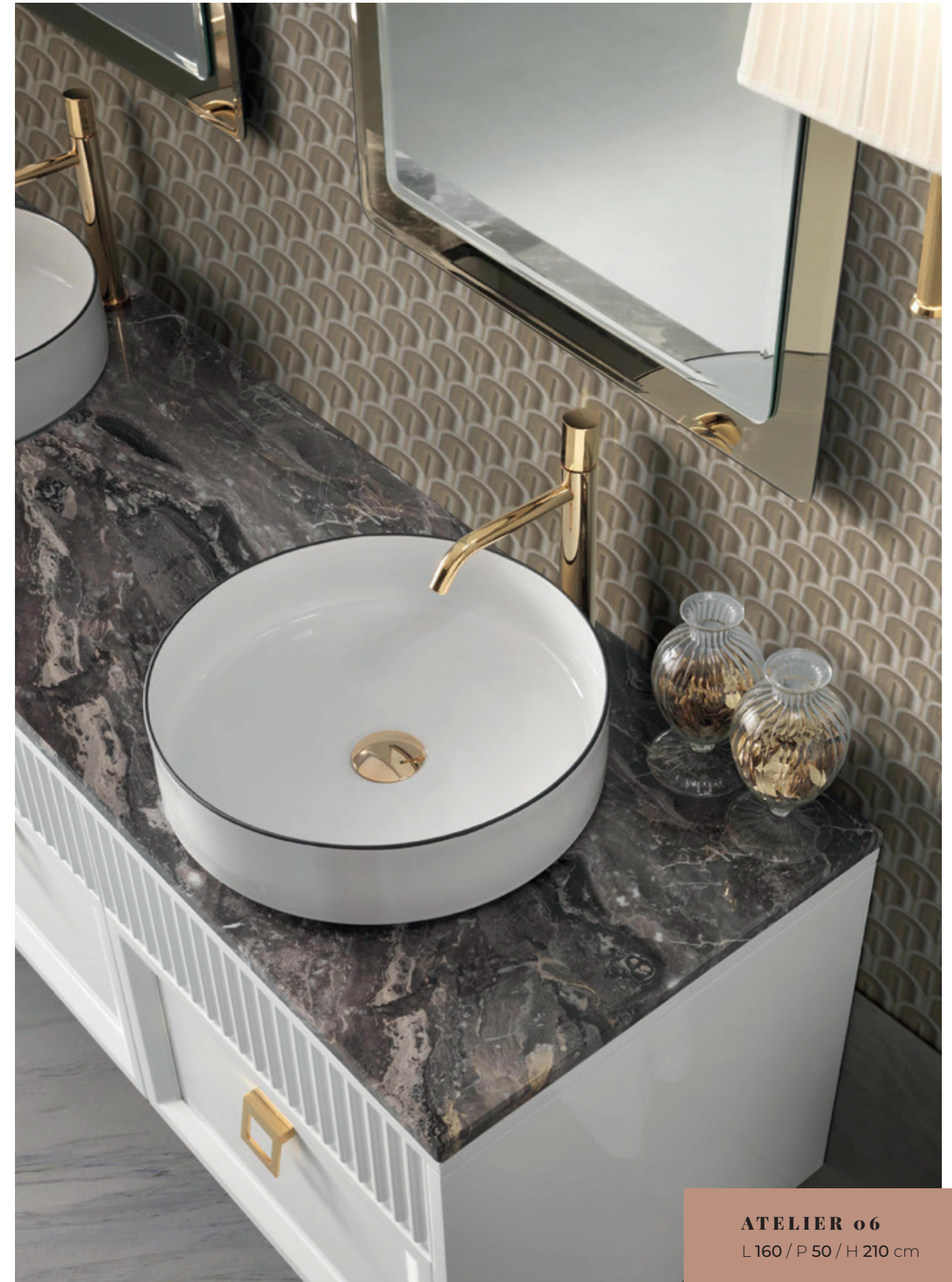
ATELIER o6 L 160 / P 50 / H 210 cm