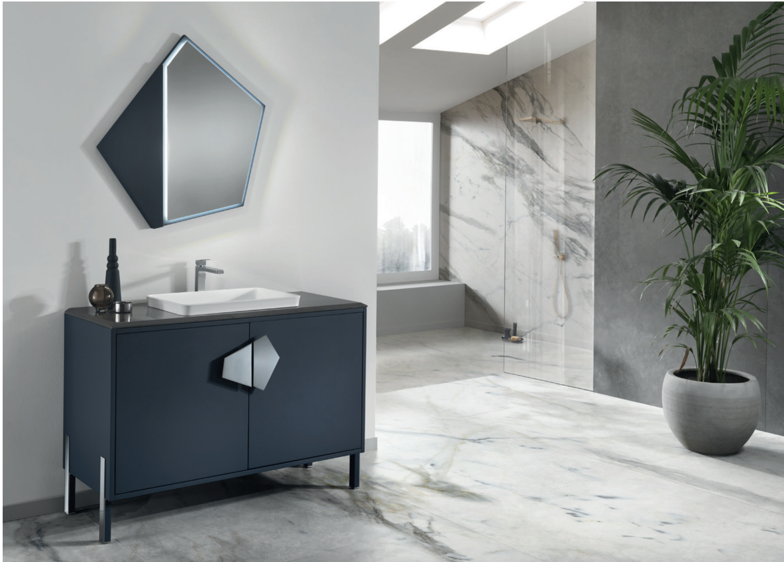
FIVE POINTS 01 L 120 / P 50 / H 200 cm