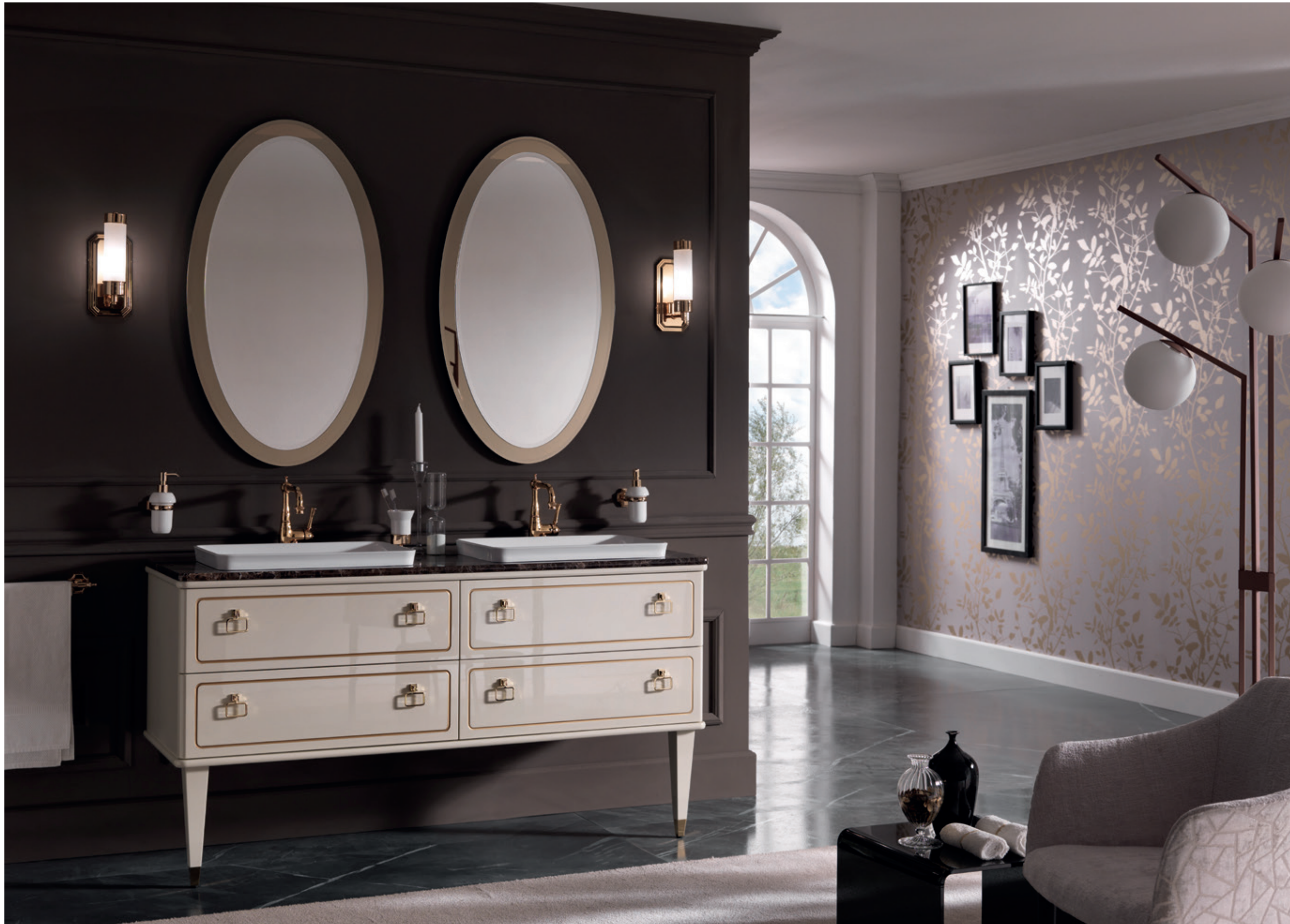
TORINO 07 L 51 / P 160 / H 200 cm