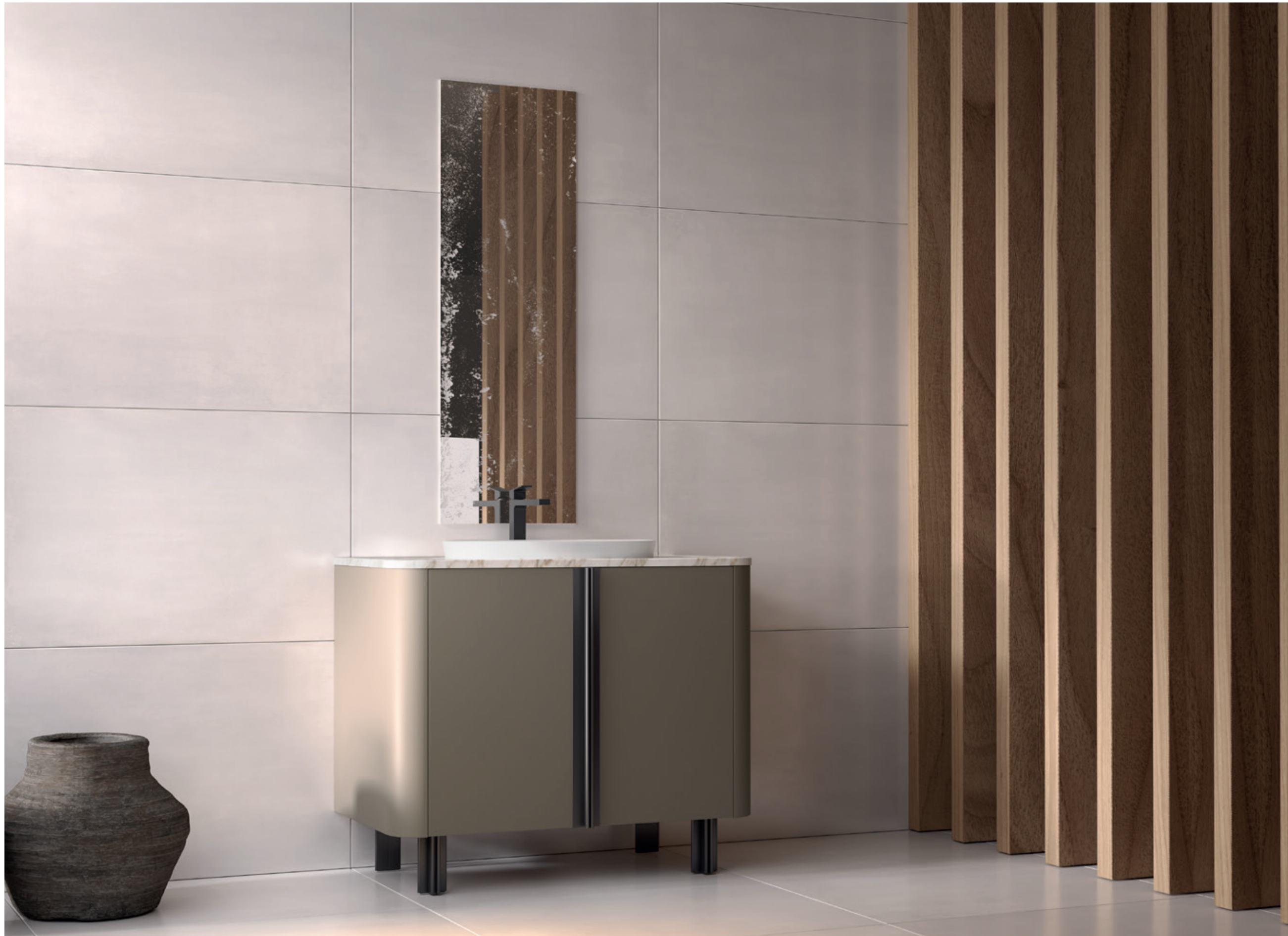
LENOX HILL 02 L 100 / P 52 / H 230 cm