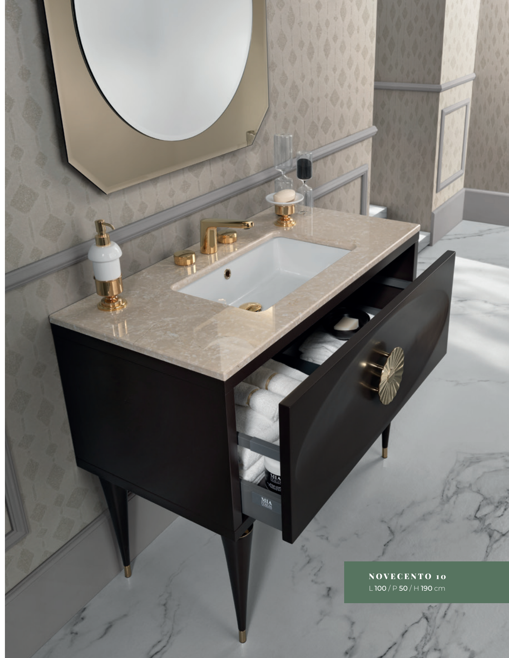
NOVECENTO 10 L100 / P 50 / H 190 cm