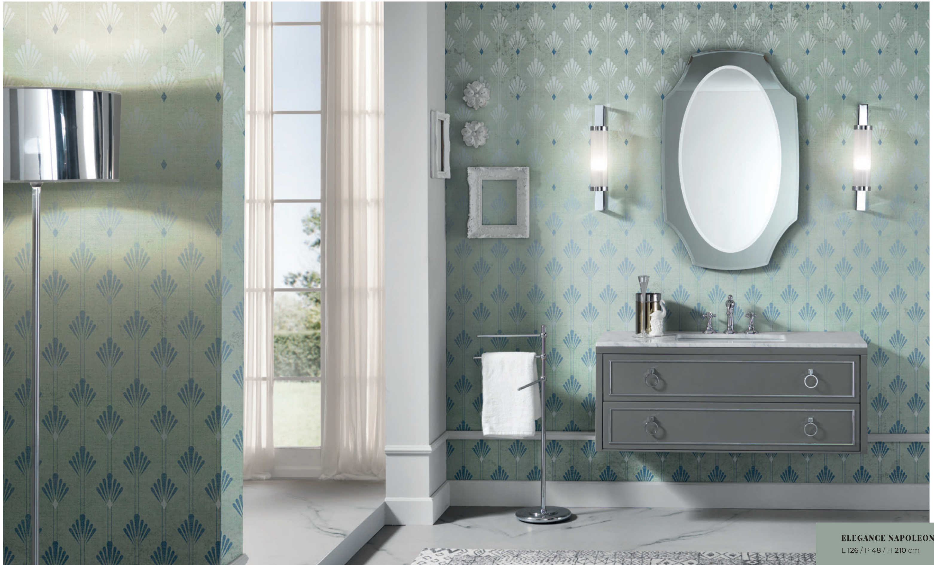
ELEGANCE NAPOLEON 33 L 126 / P 48 / H 210 cm