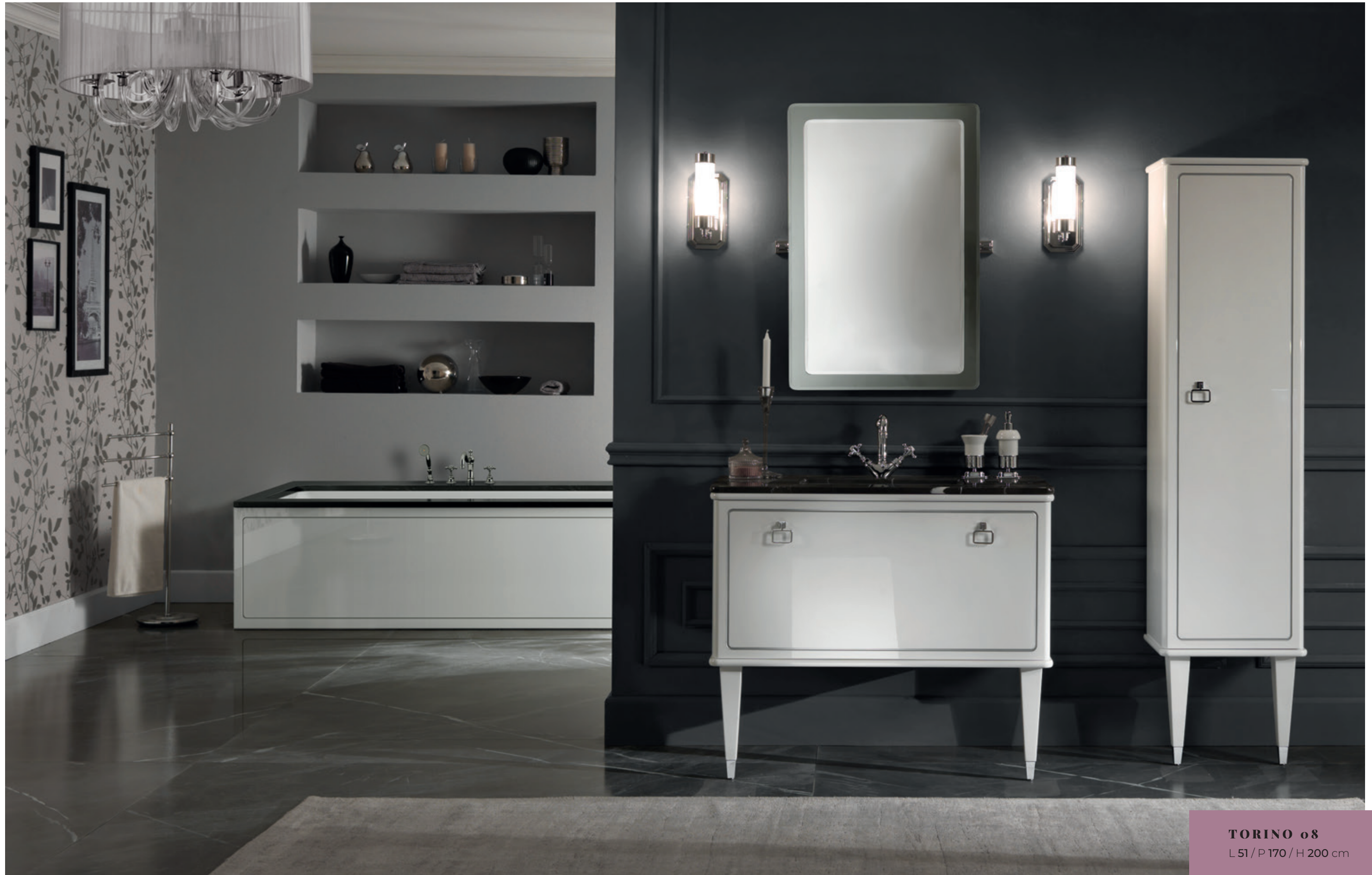
TORINO 08 L 51 / P 170 / H 200 cm