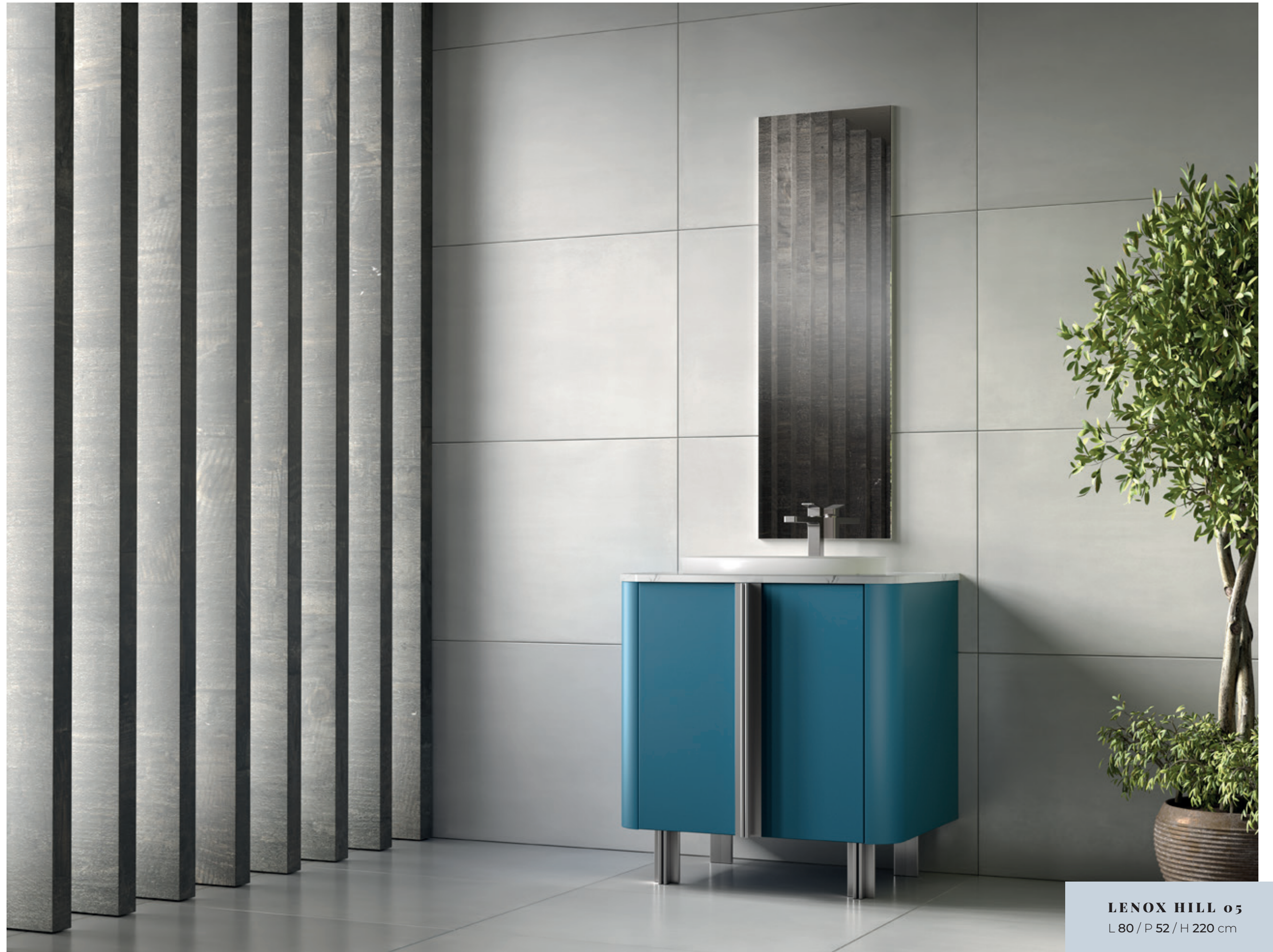
LENOX HILL 05 L 80 / P 52 / H 220 cm