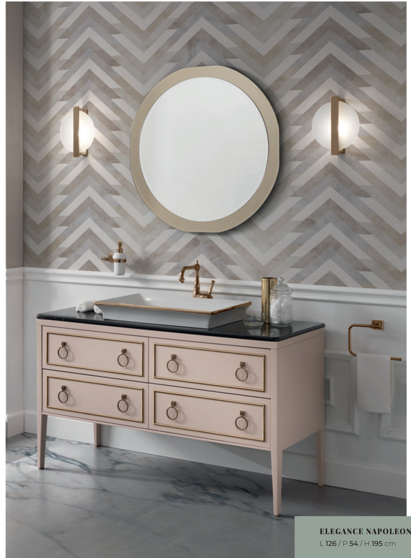
ELEGANCE NAPOLEON 24 L 126 / P 54 / H 195 cm