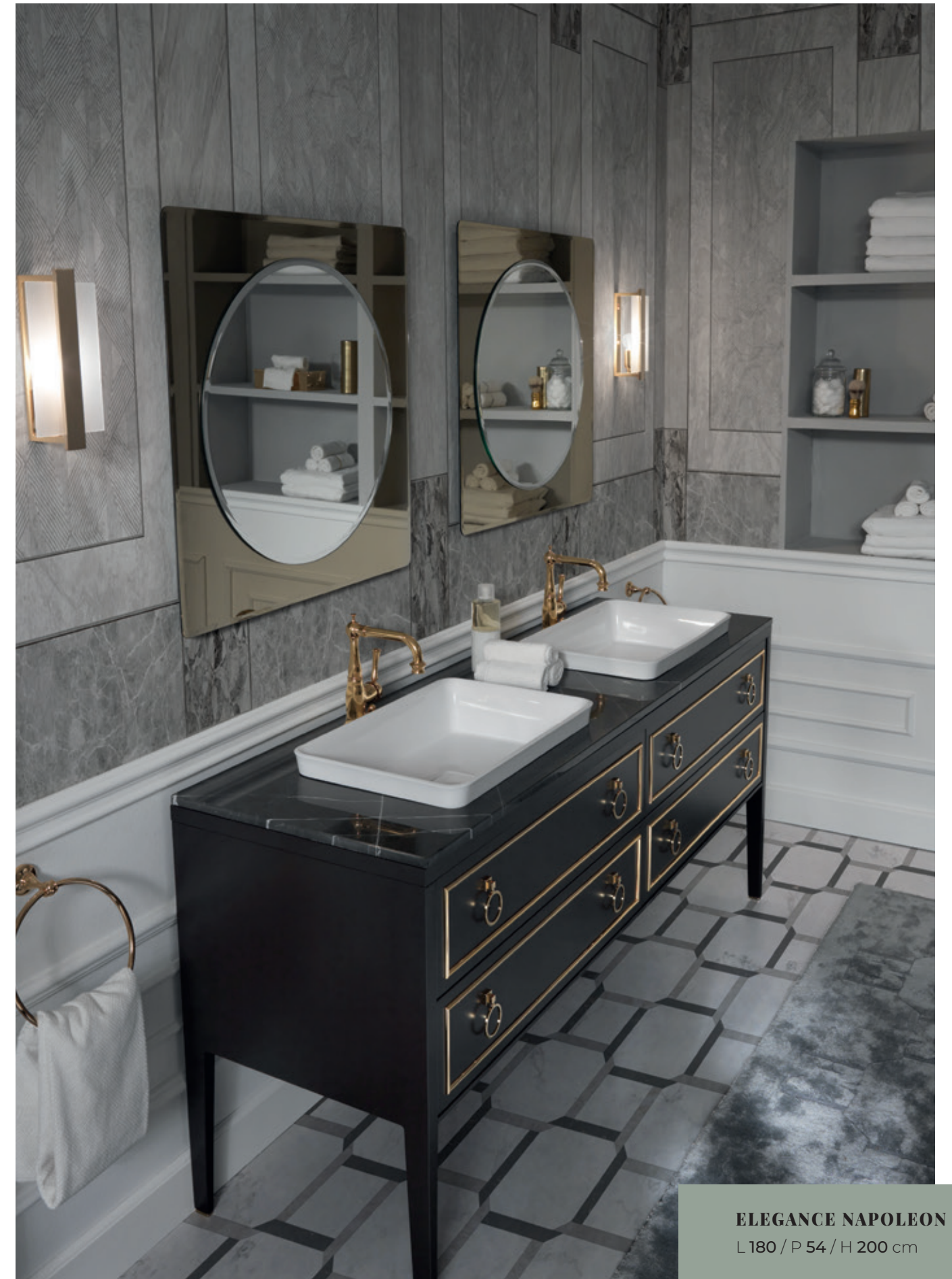
ELEGANCE NAPOLEON 22 L 180 / P 54 / H 200 cm