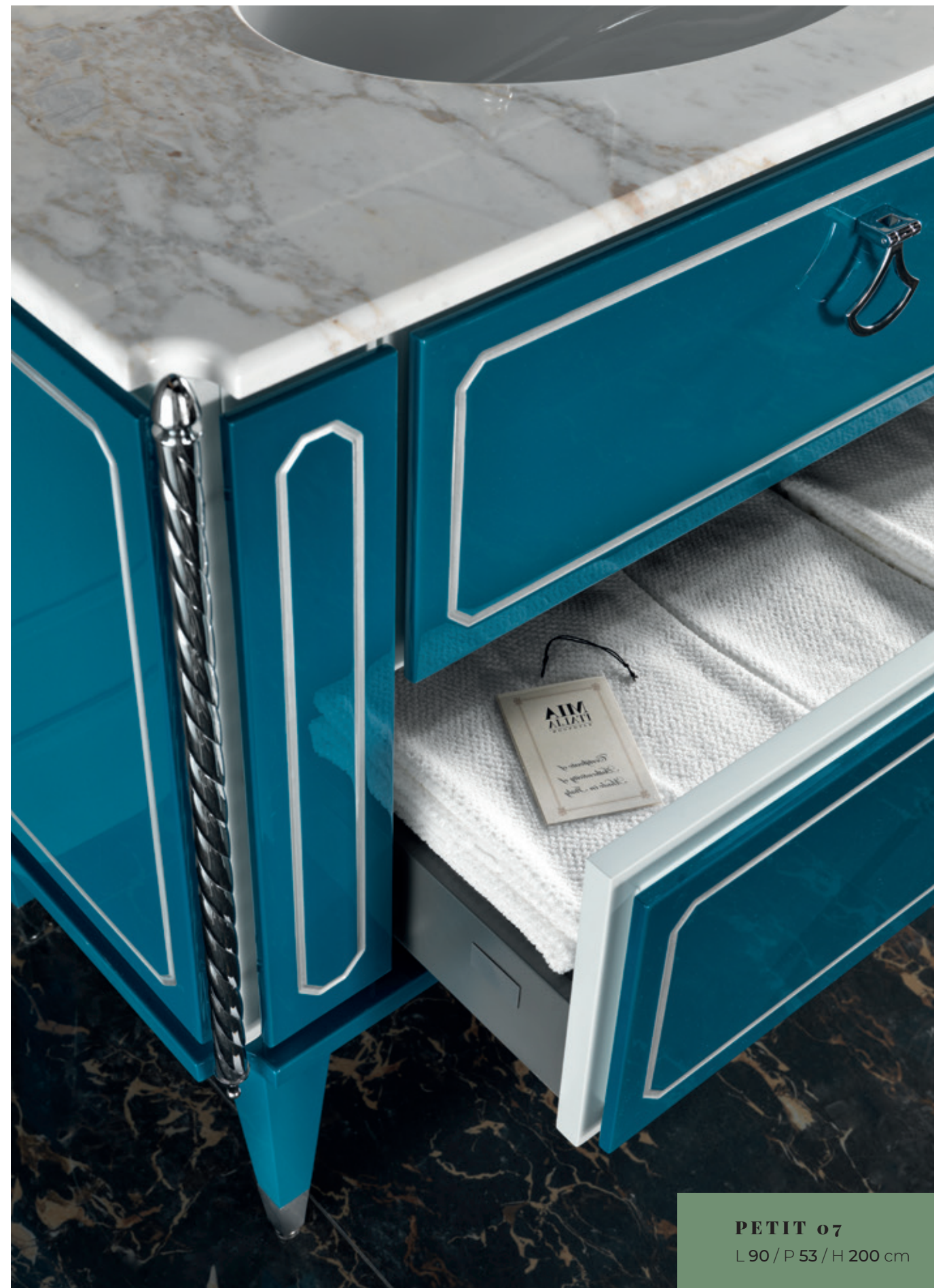
PETIT 07 L 90 / P 53 / H 200 cm