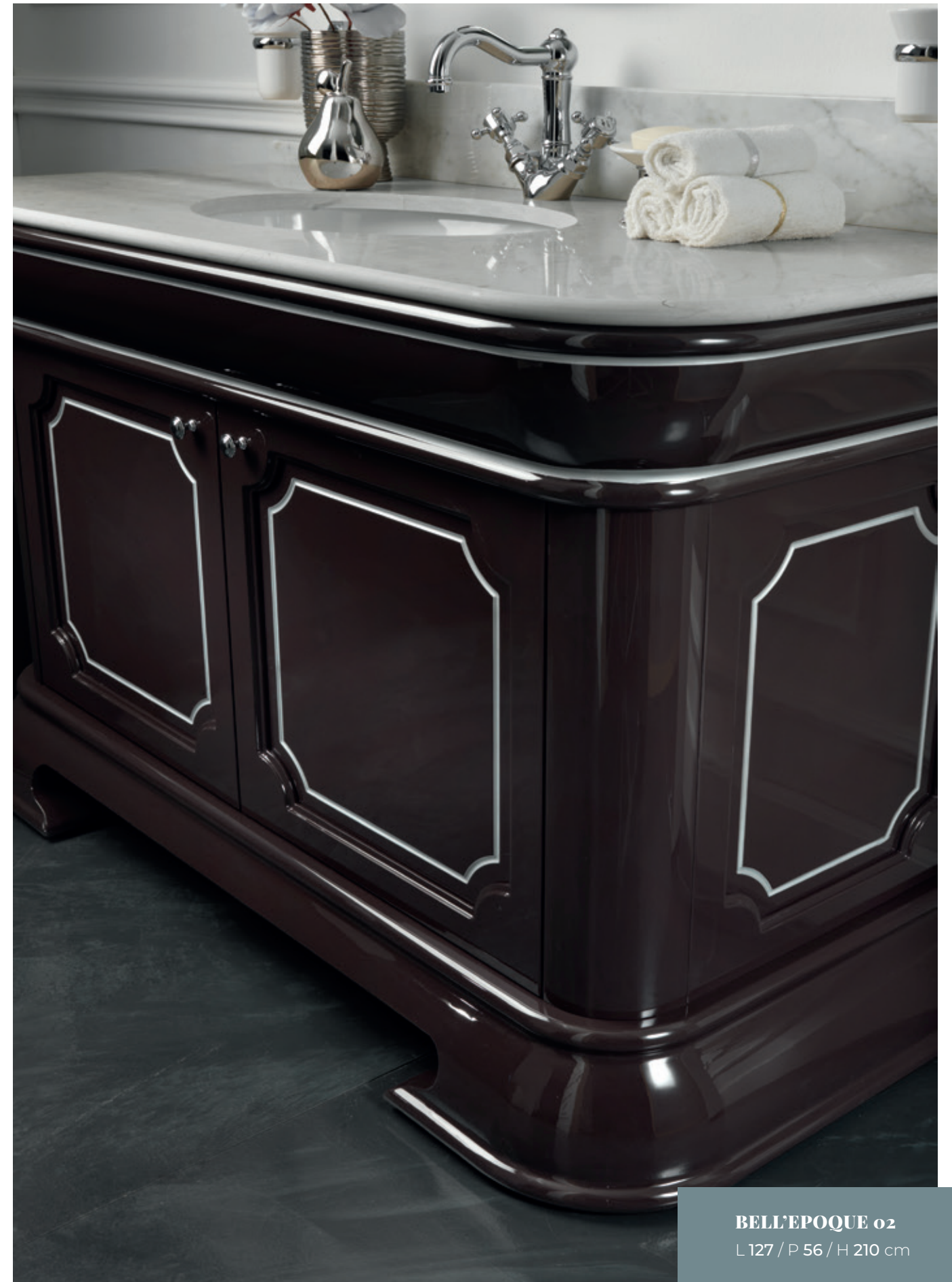
BELL'EPOQUE 02 L 127 / P 56 / H 210 cm