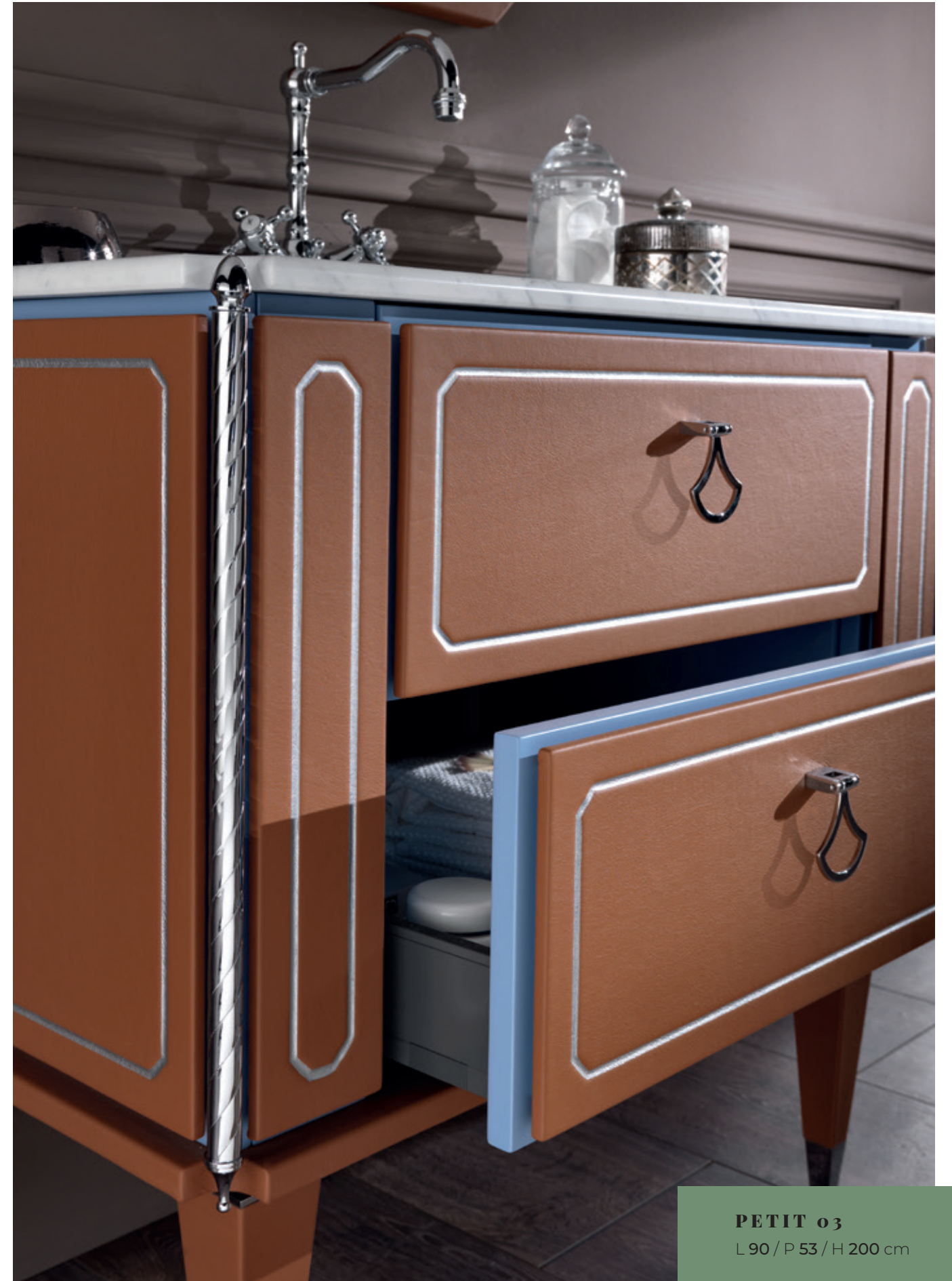
PETIT 03 L 90 / P 53 / H 200 cm