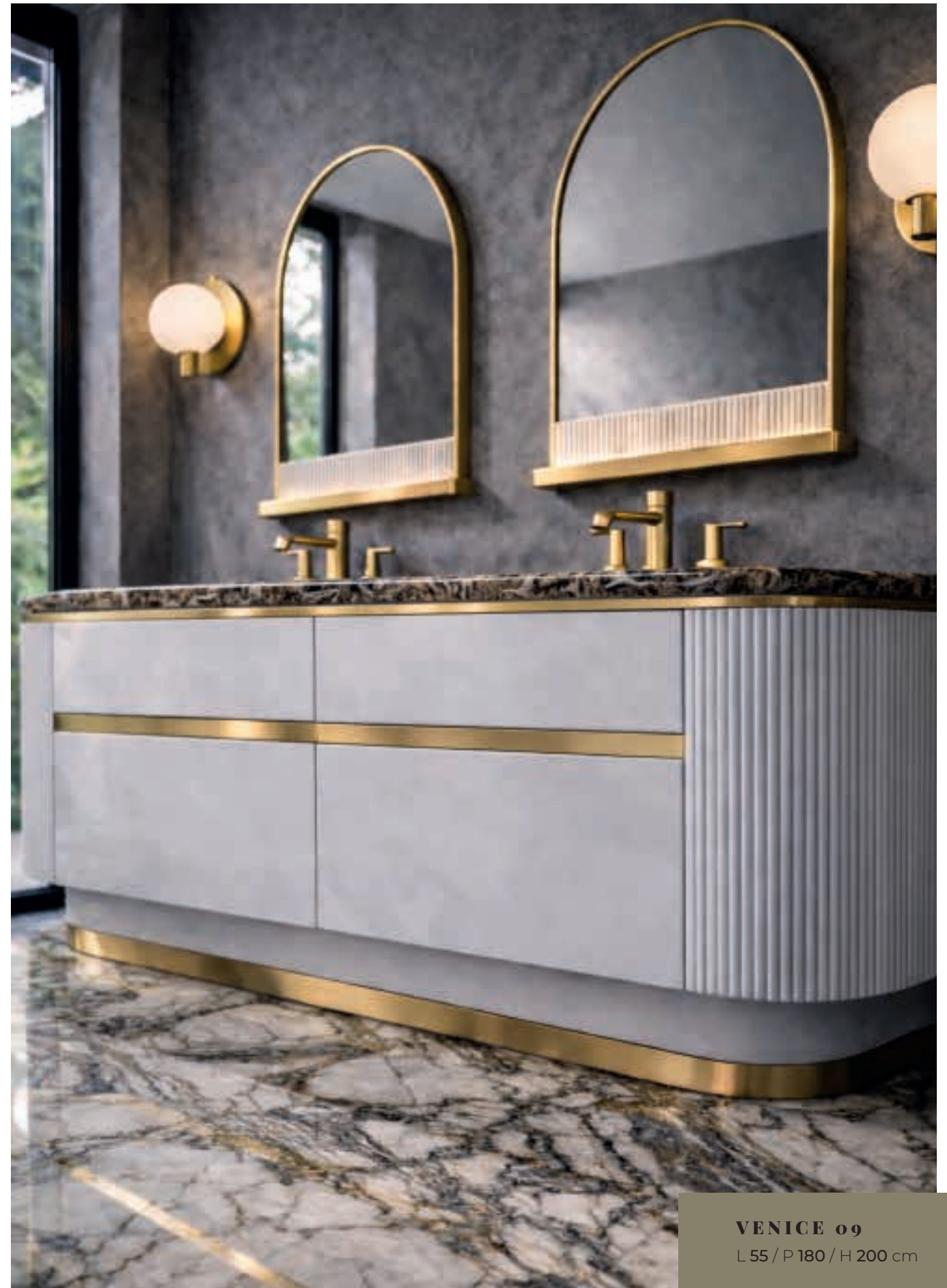
VENICE 09 L 55 / P 180 / H 200 cm