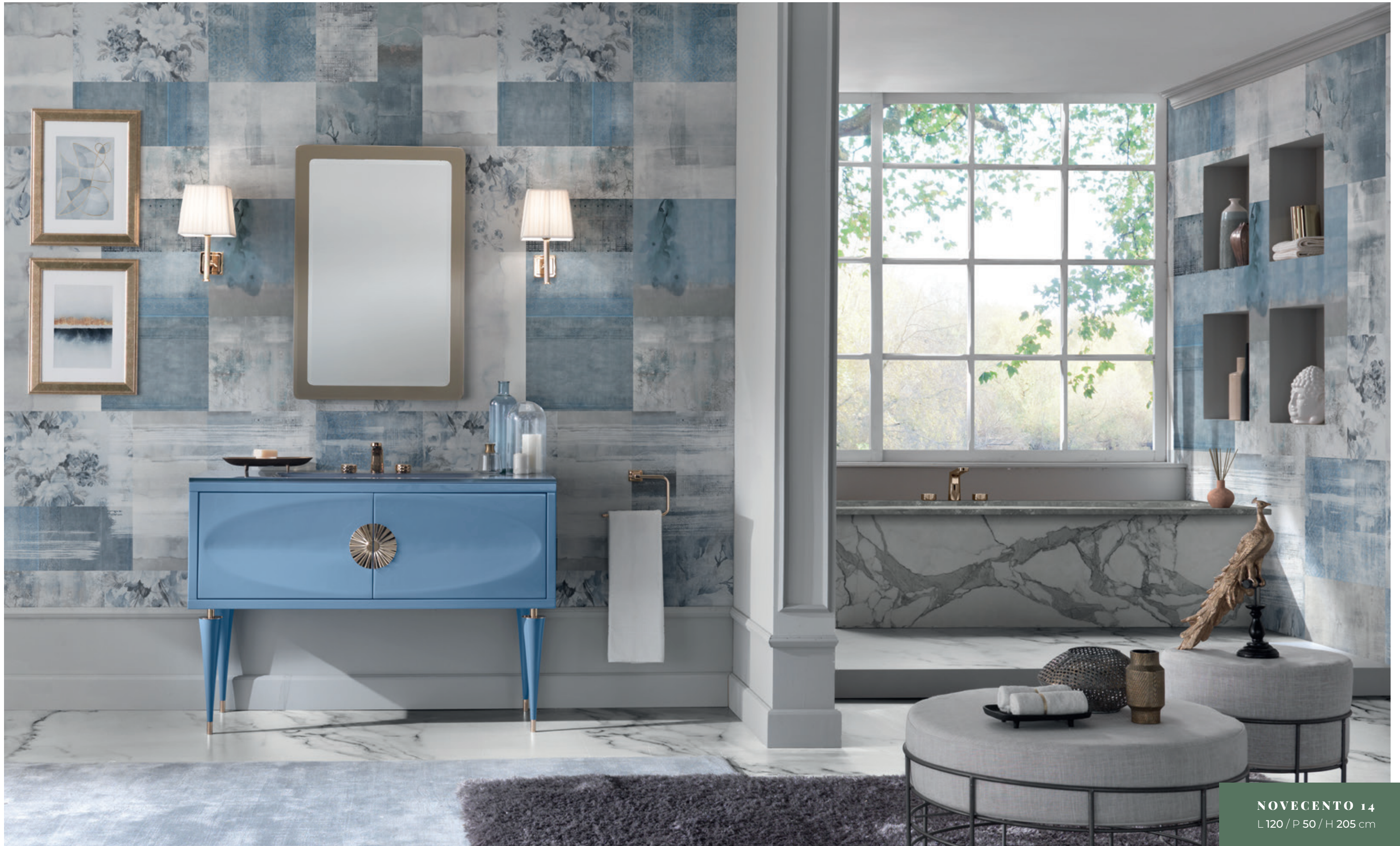
NOVECENTO 14 L120 / P 50 / H 205 cm