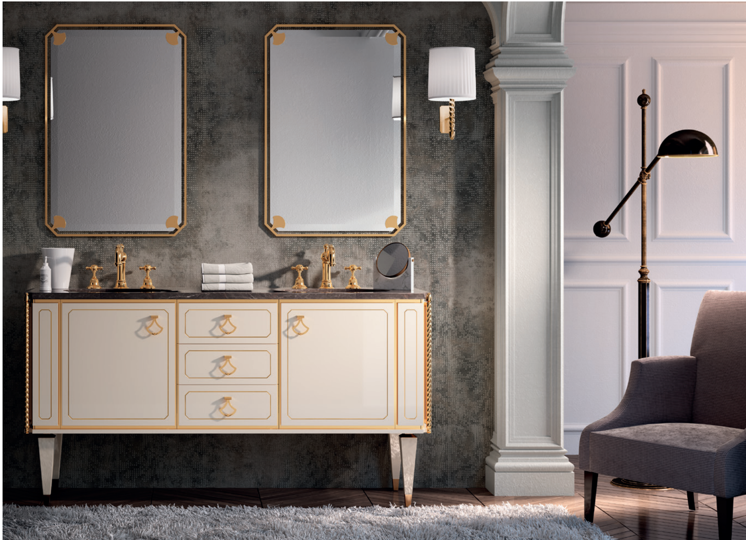
PETIT o4 L160 / P 53 / H 200 cm