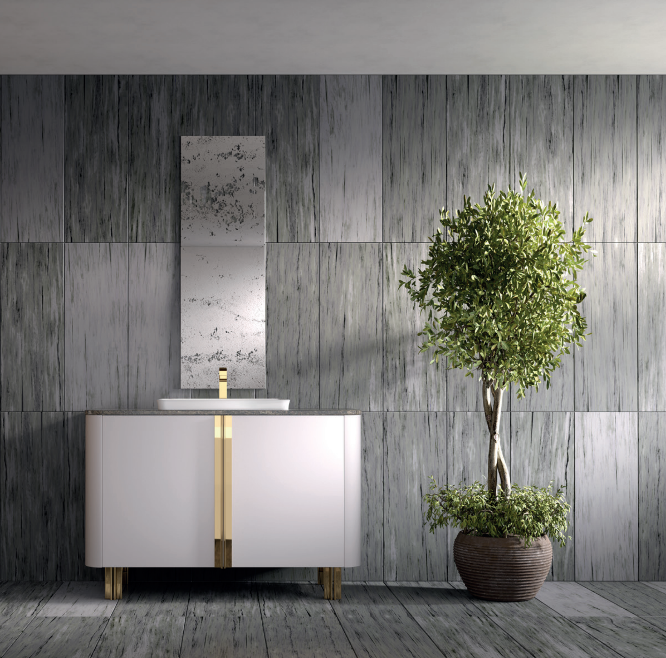
LENOX HILL 04 L 120 / P 52 / H 220 cm