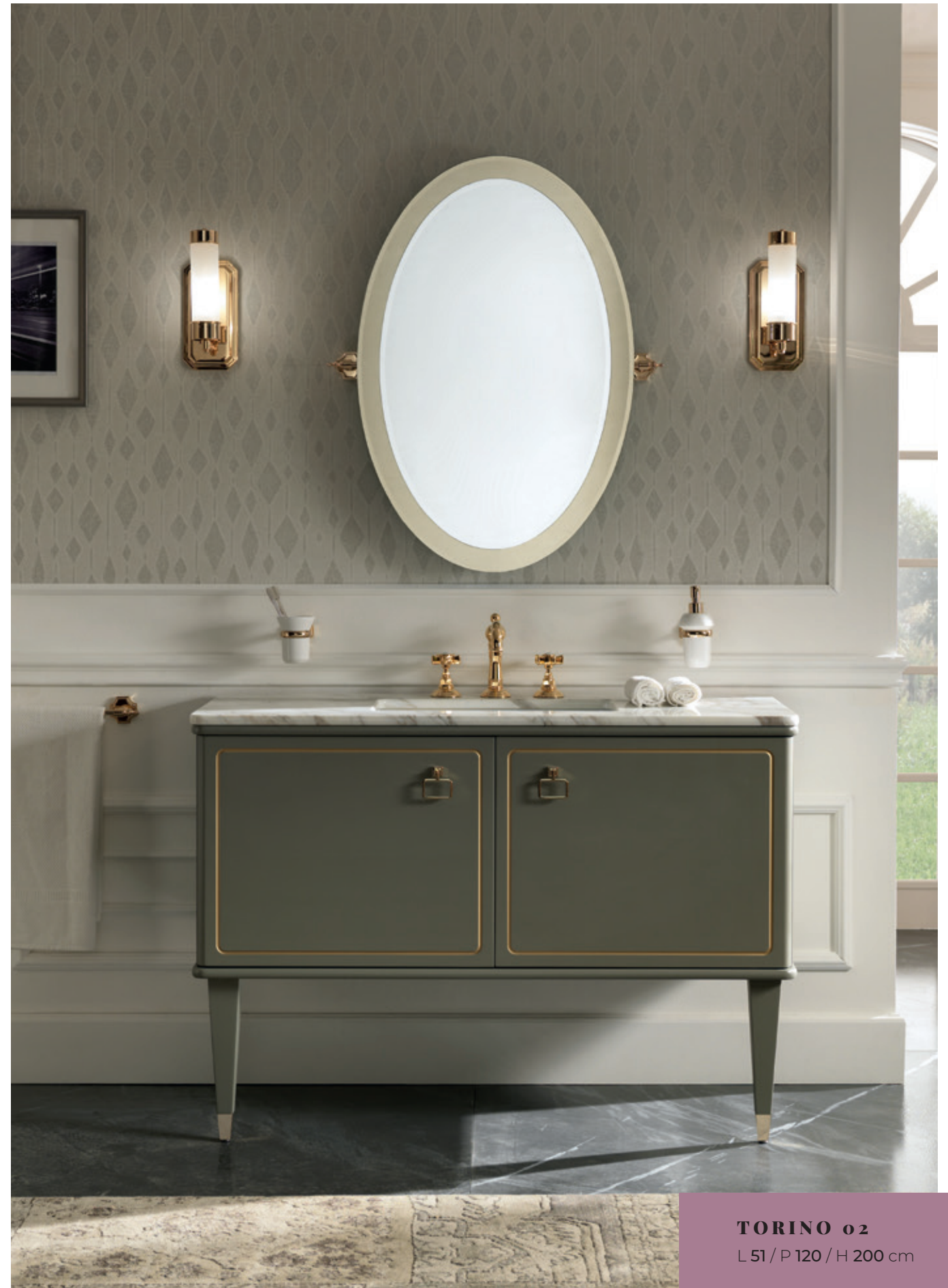
TORINO 02 L 51 / P 120 / H 200 cm