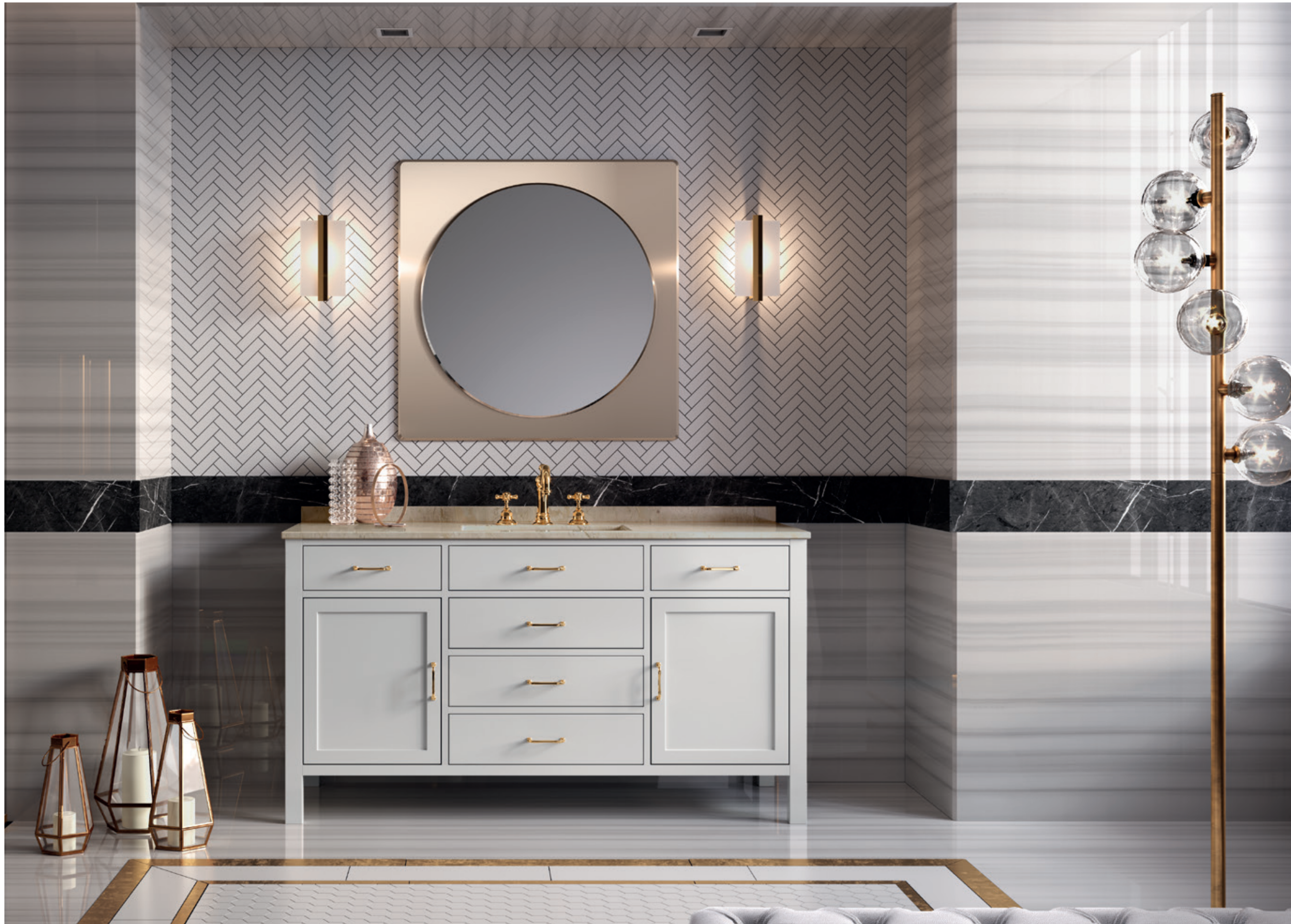
GERANIO 03 L 150 / P 55 / H 195 cm