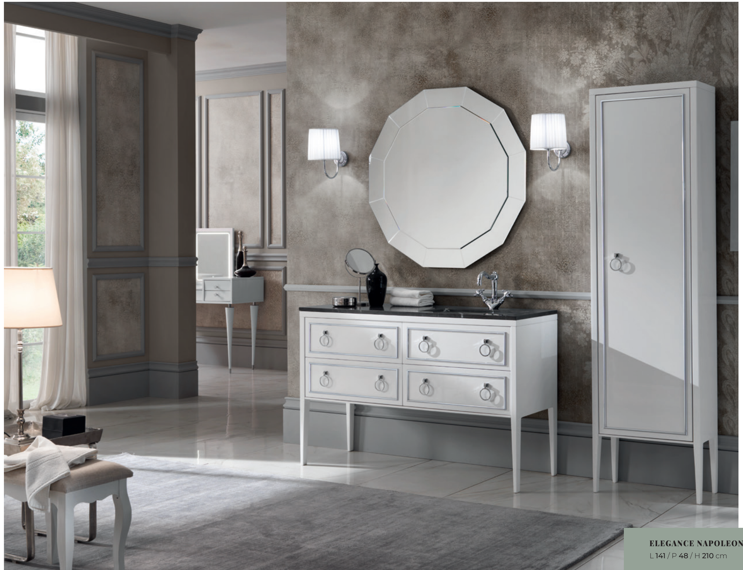
ELEGANCE NAPOLEON 03 L 141 / P 48 / H 210 cm