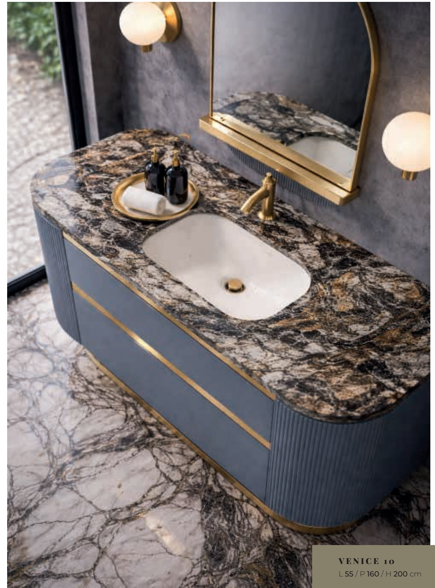
VENICE 10 L 55 / P 160 / H 200 cm