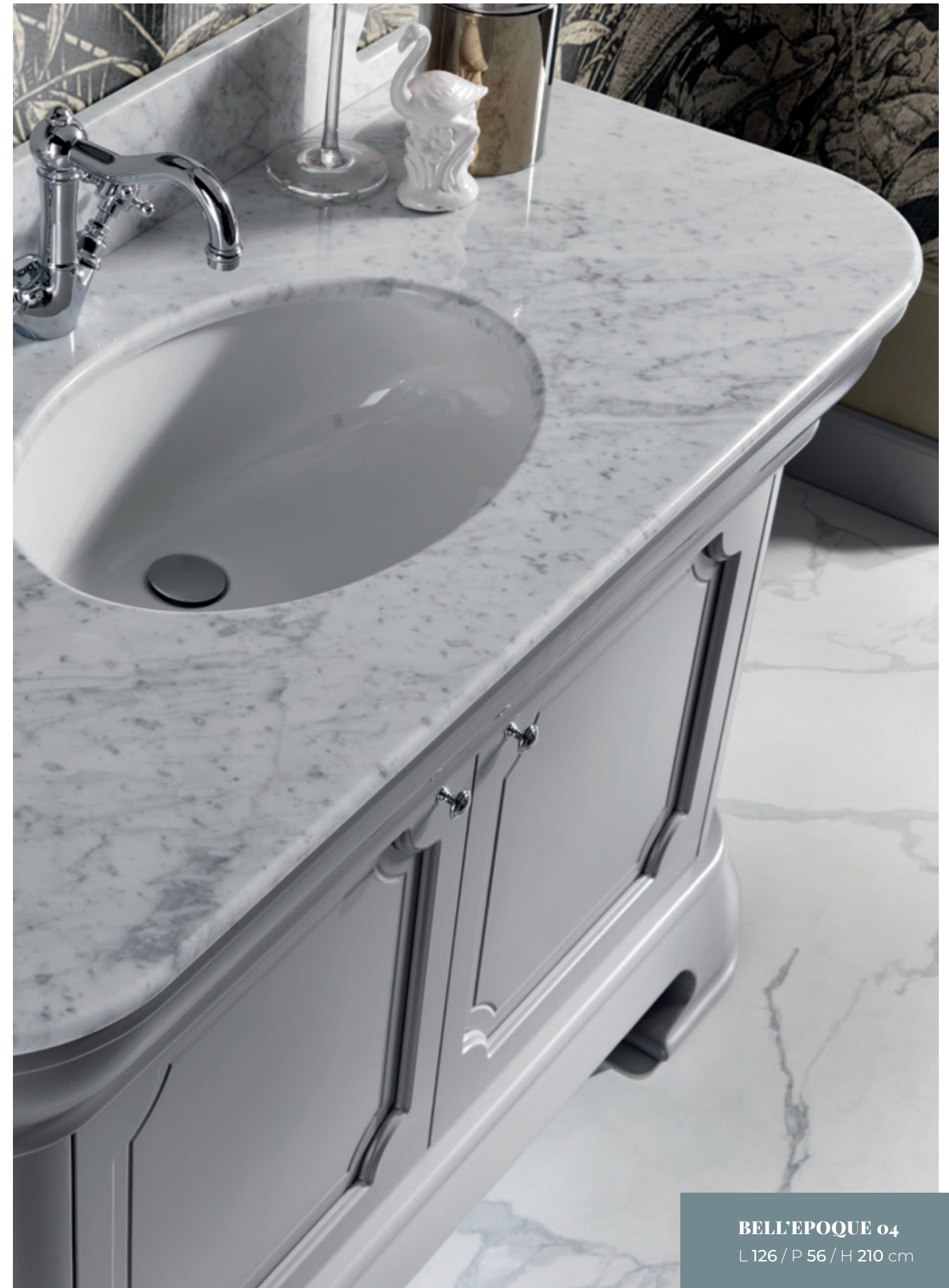
BELLEPOQUE 04 L 126 / P 56 / H 210 cm