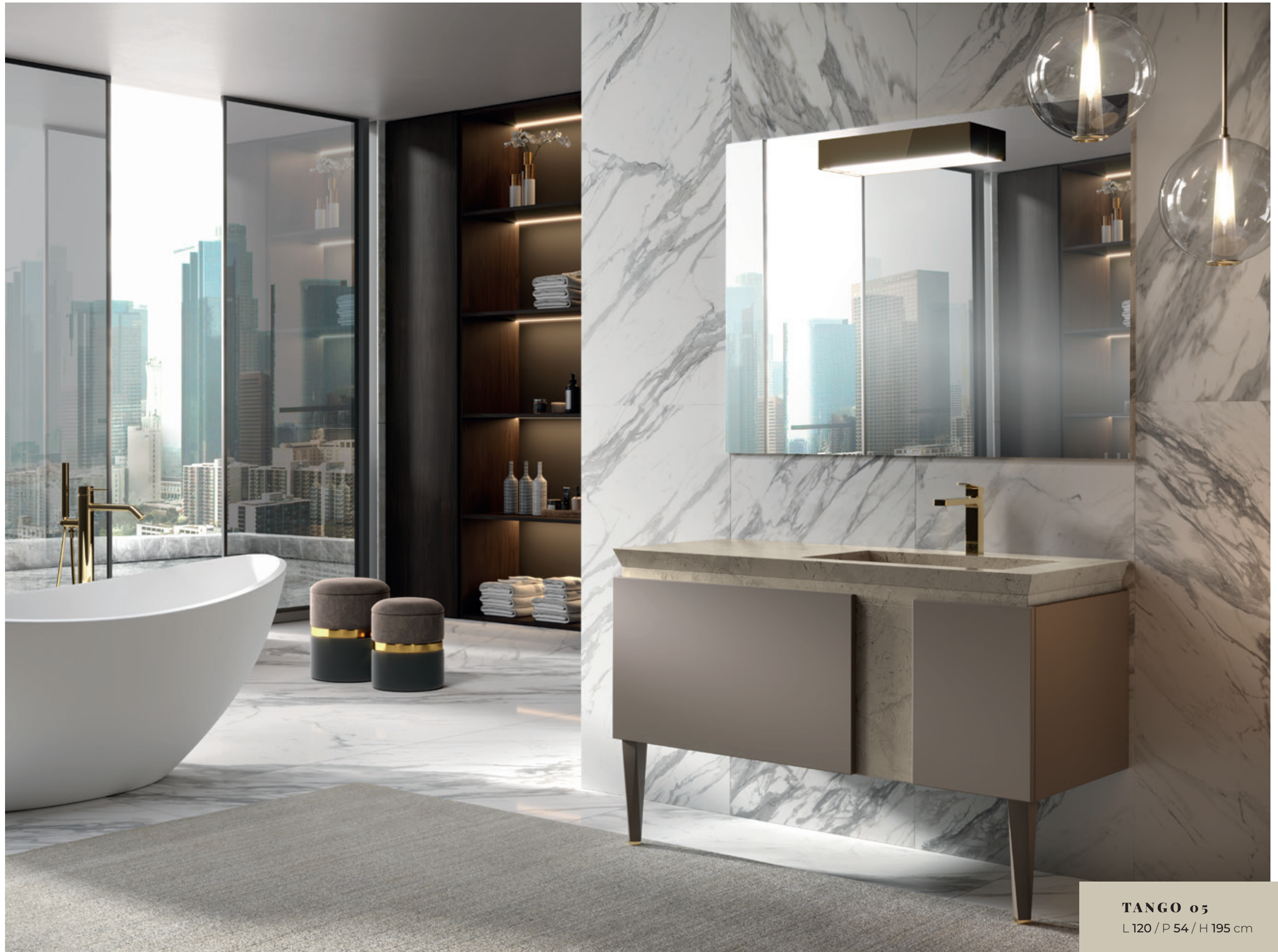
TANGO 05 L 120 / P 54 / H 195 cm