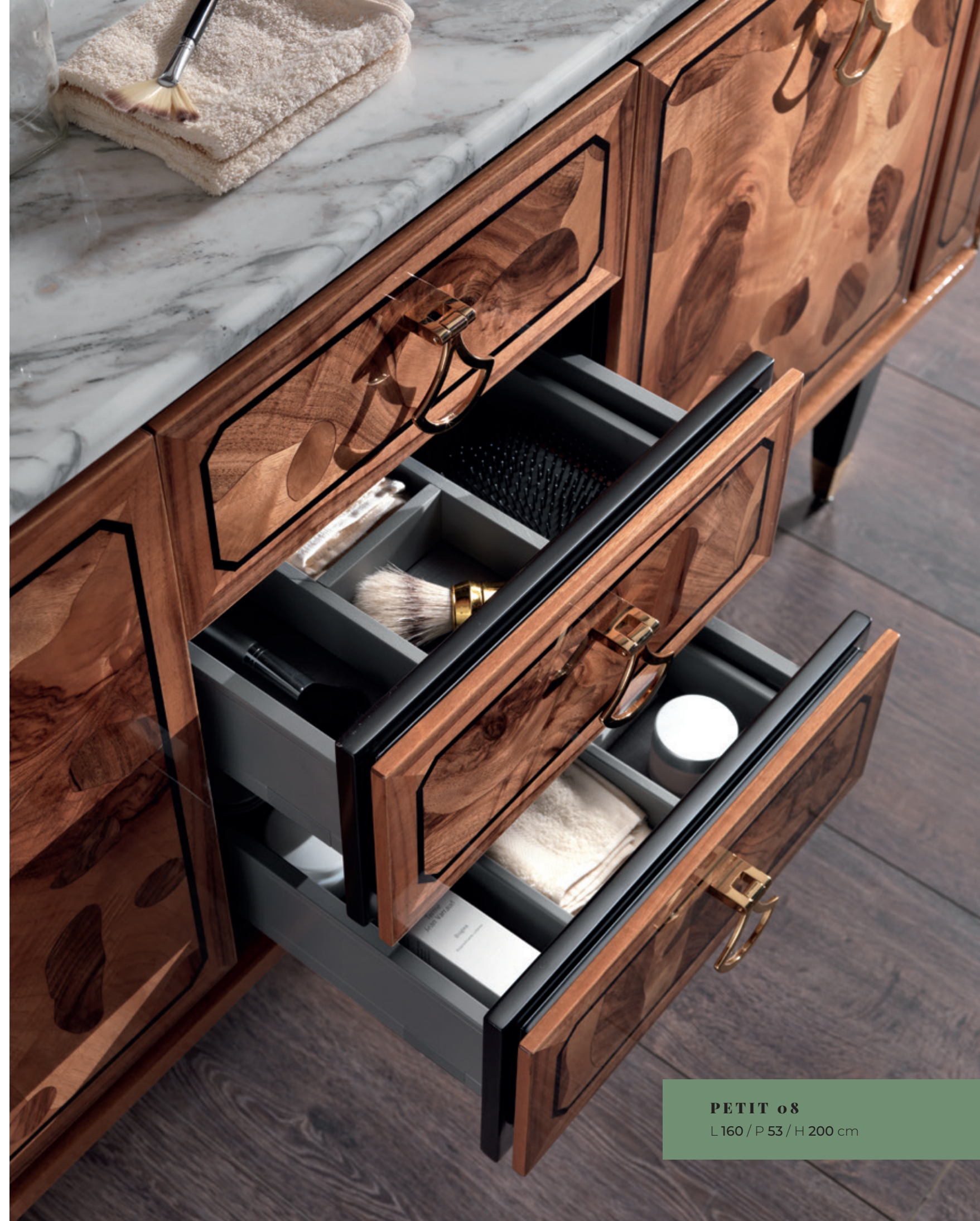
PETIT o8 L160 / P 53 / H 200 cm