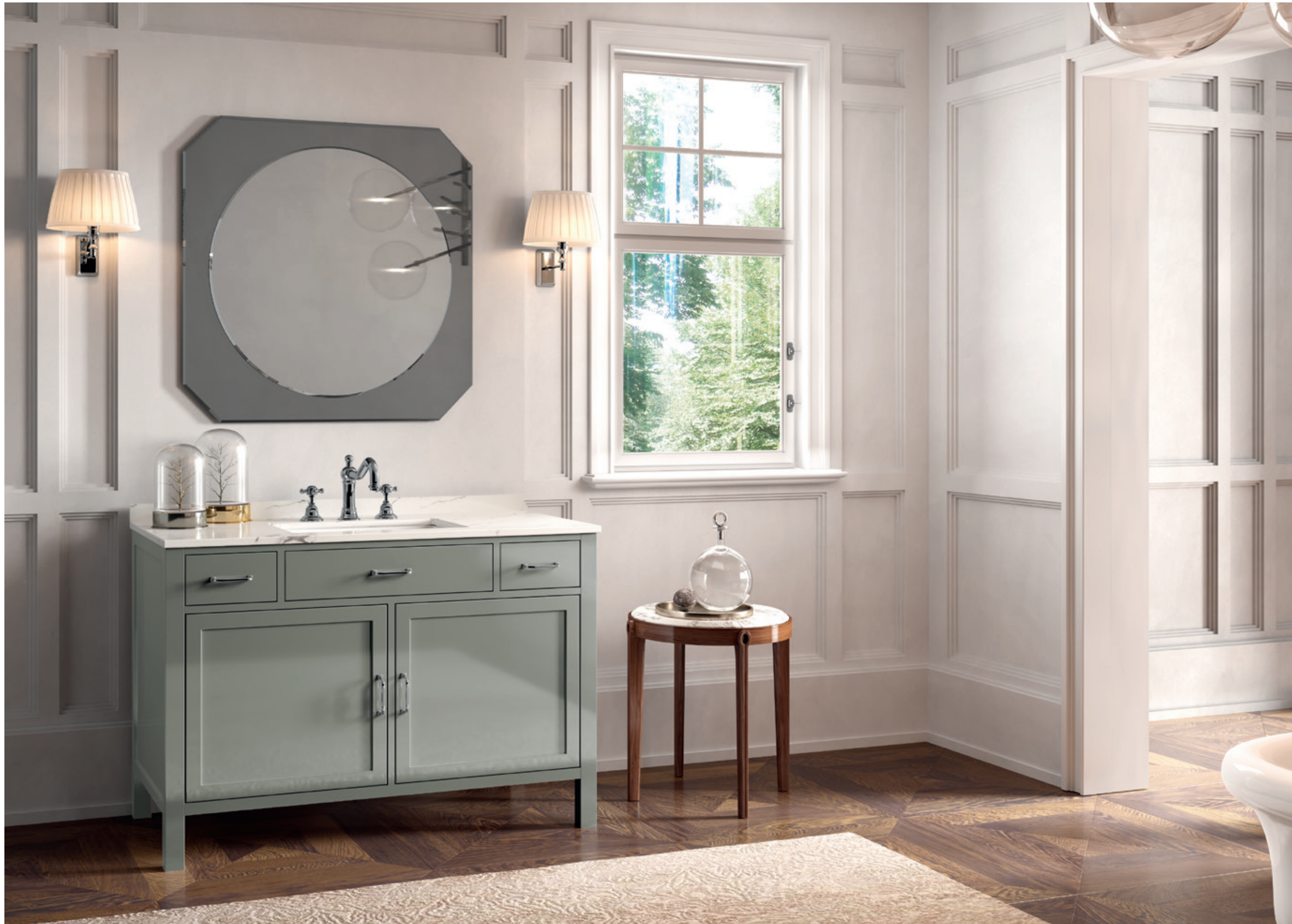
GERANIO o2 L 120 / P 55 / H 195 cm