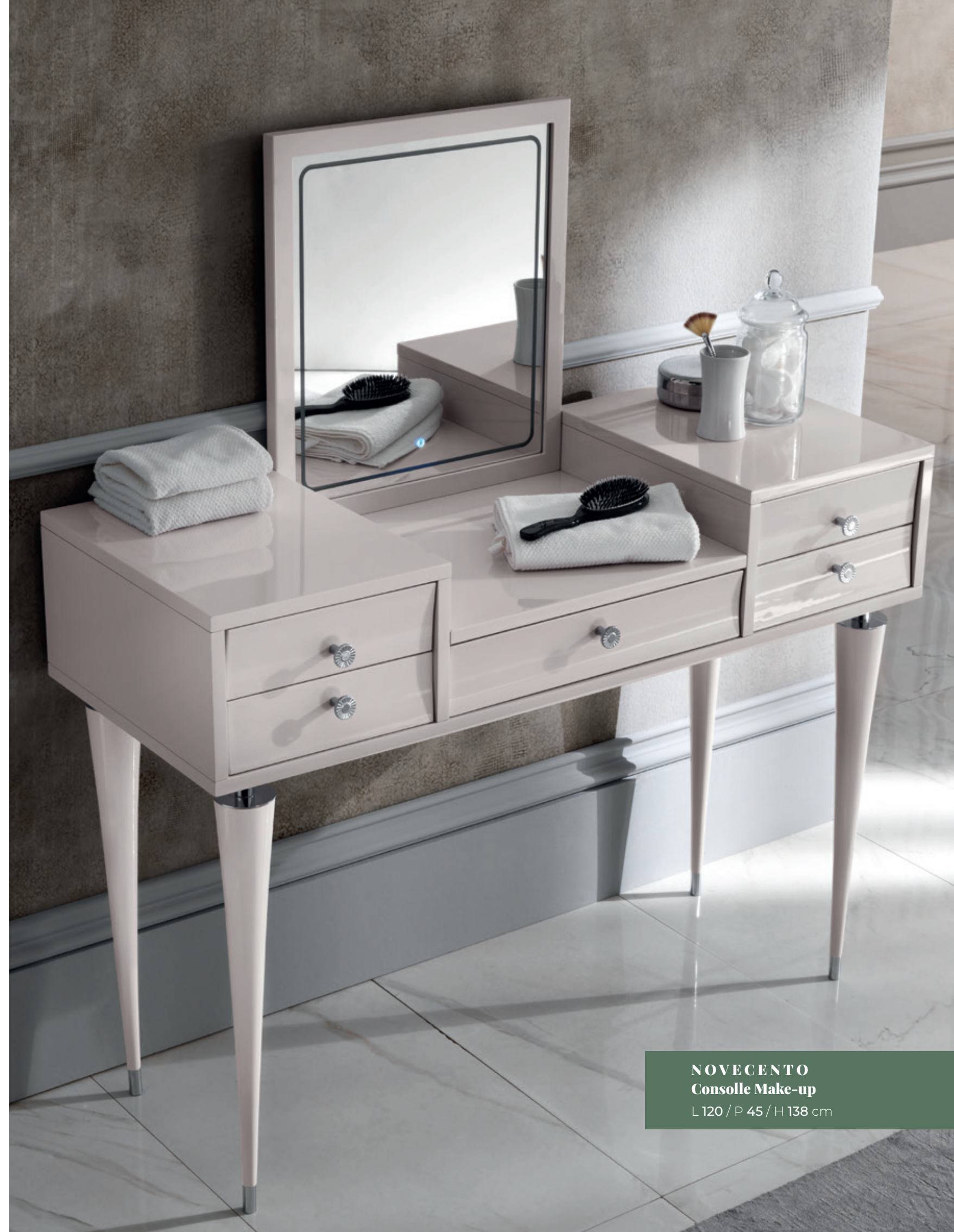
NOVECENTO Consolle Make-up L120 / P 45 / H 138 cm