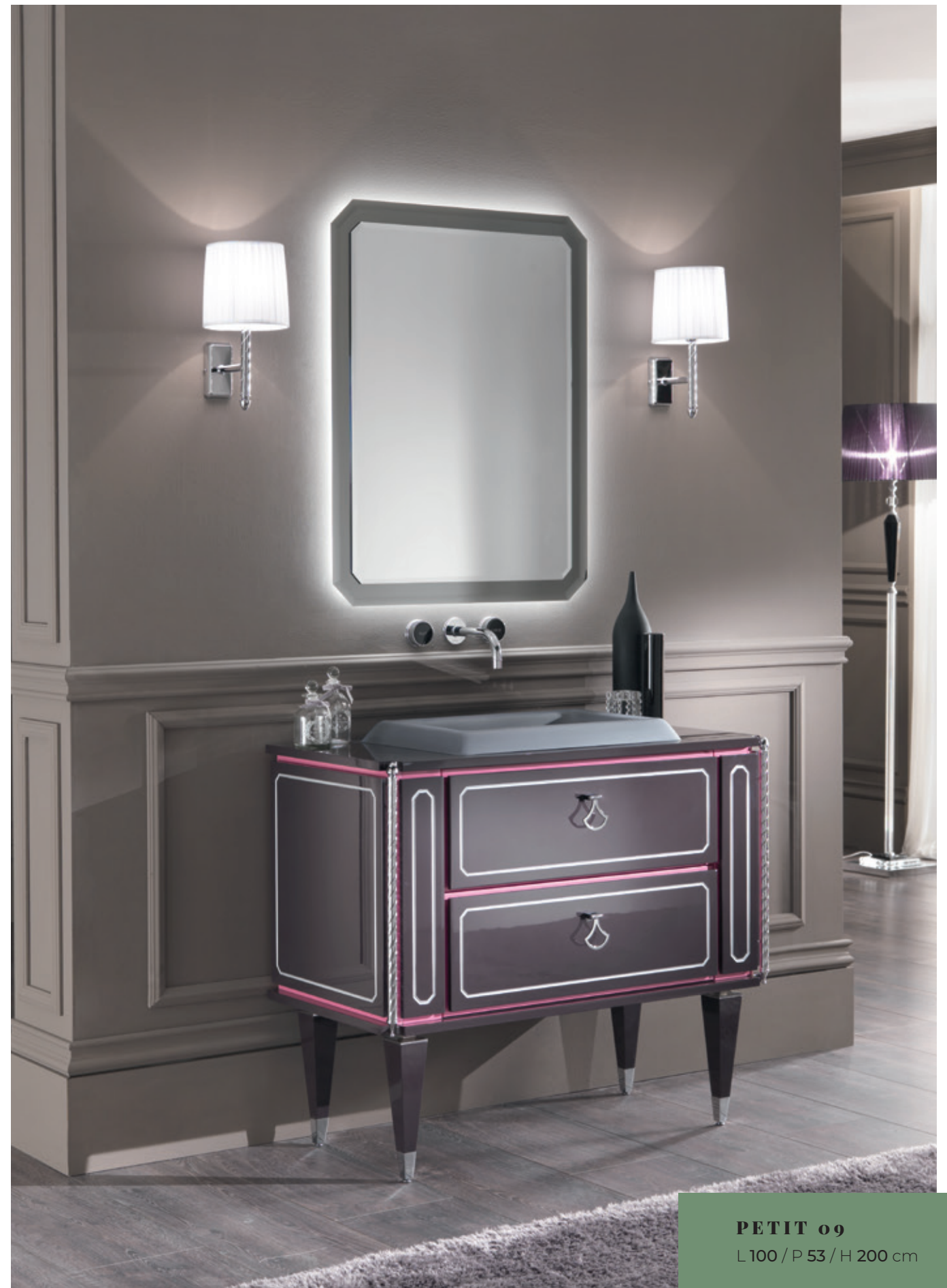
PETIT 09 L100 / P 53 / H 200 cm