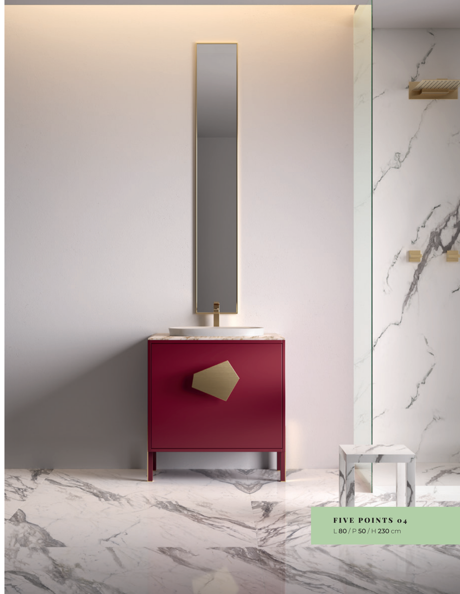
FIVE POINTS 04 L 80 / P 50 / H 230 cm