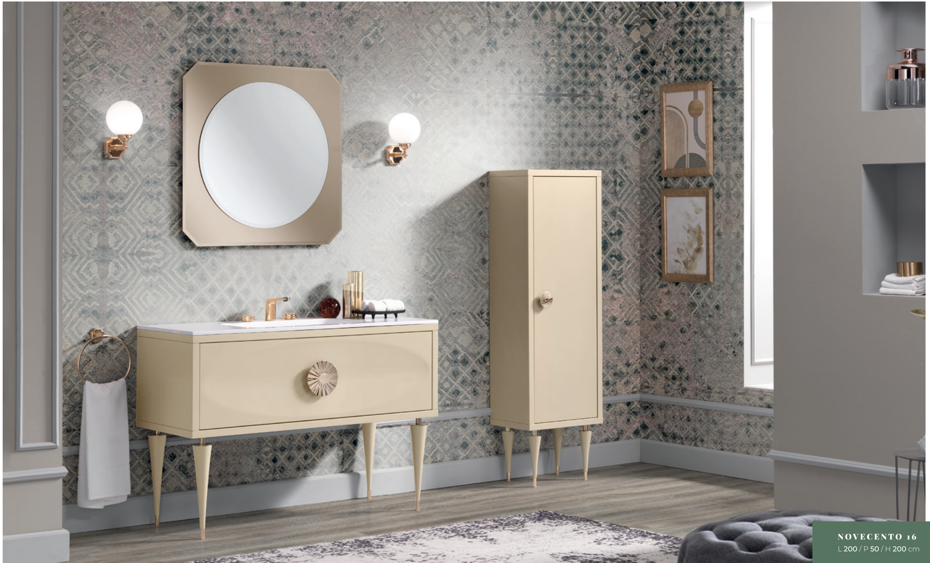
NOVECENTO 16 L 200 / P 50 / H 200 cm