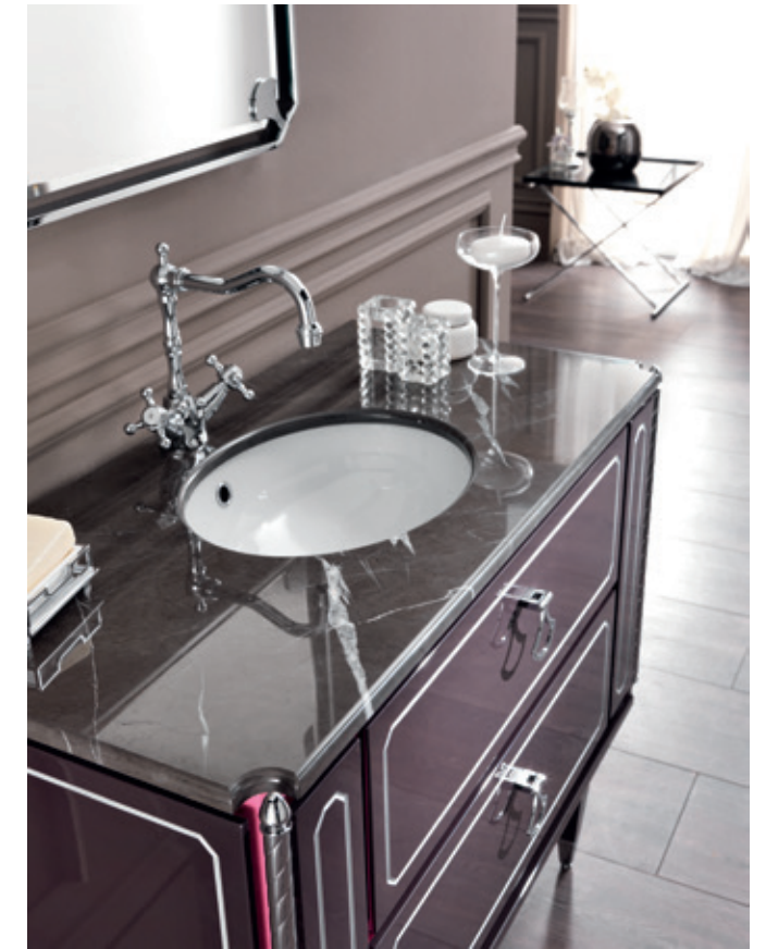
PETIT 05 L100 / P 53 / H 200 cm