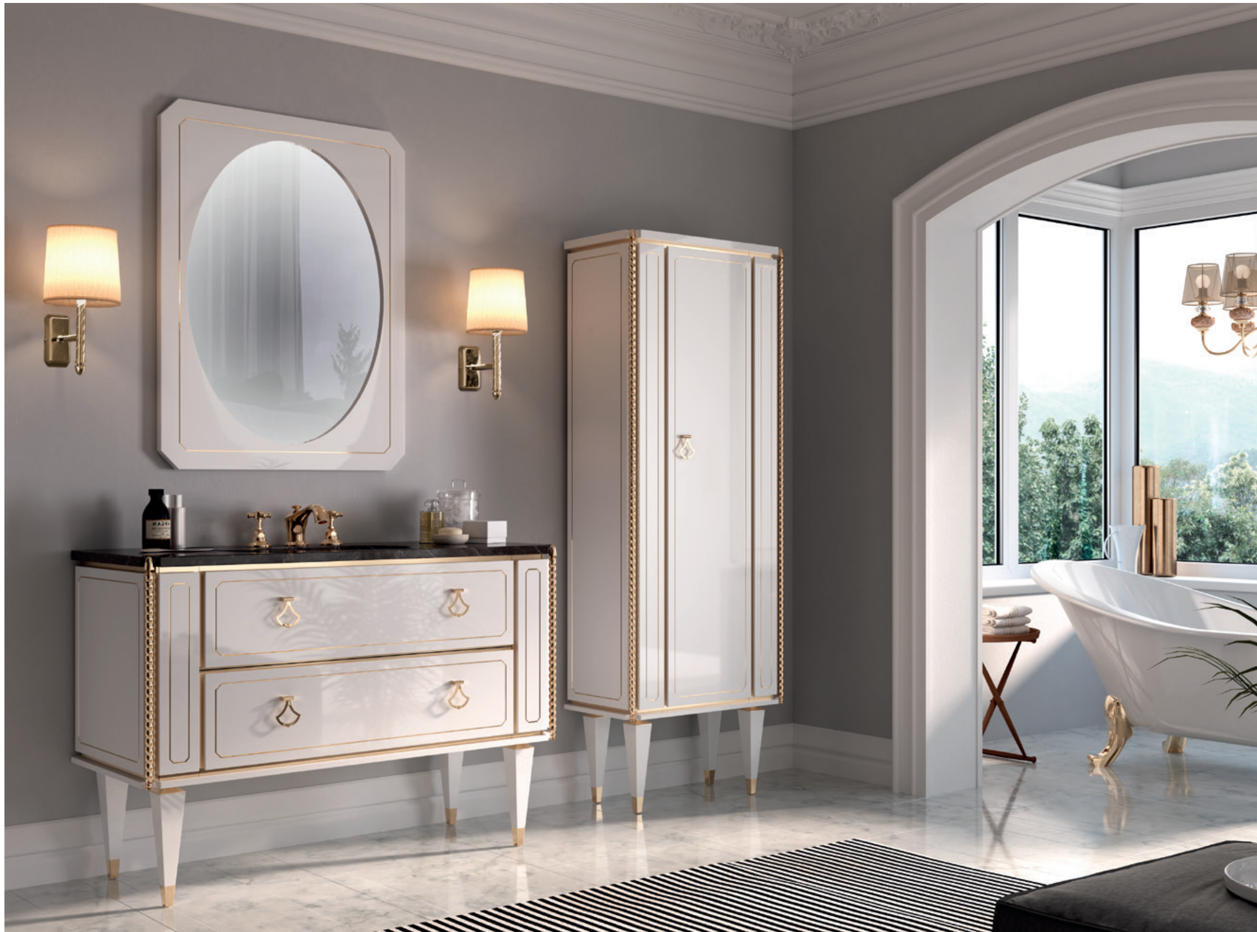
PETIT 01 L 120 / P 53 / H 200 cm