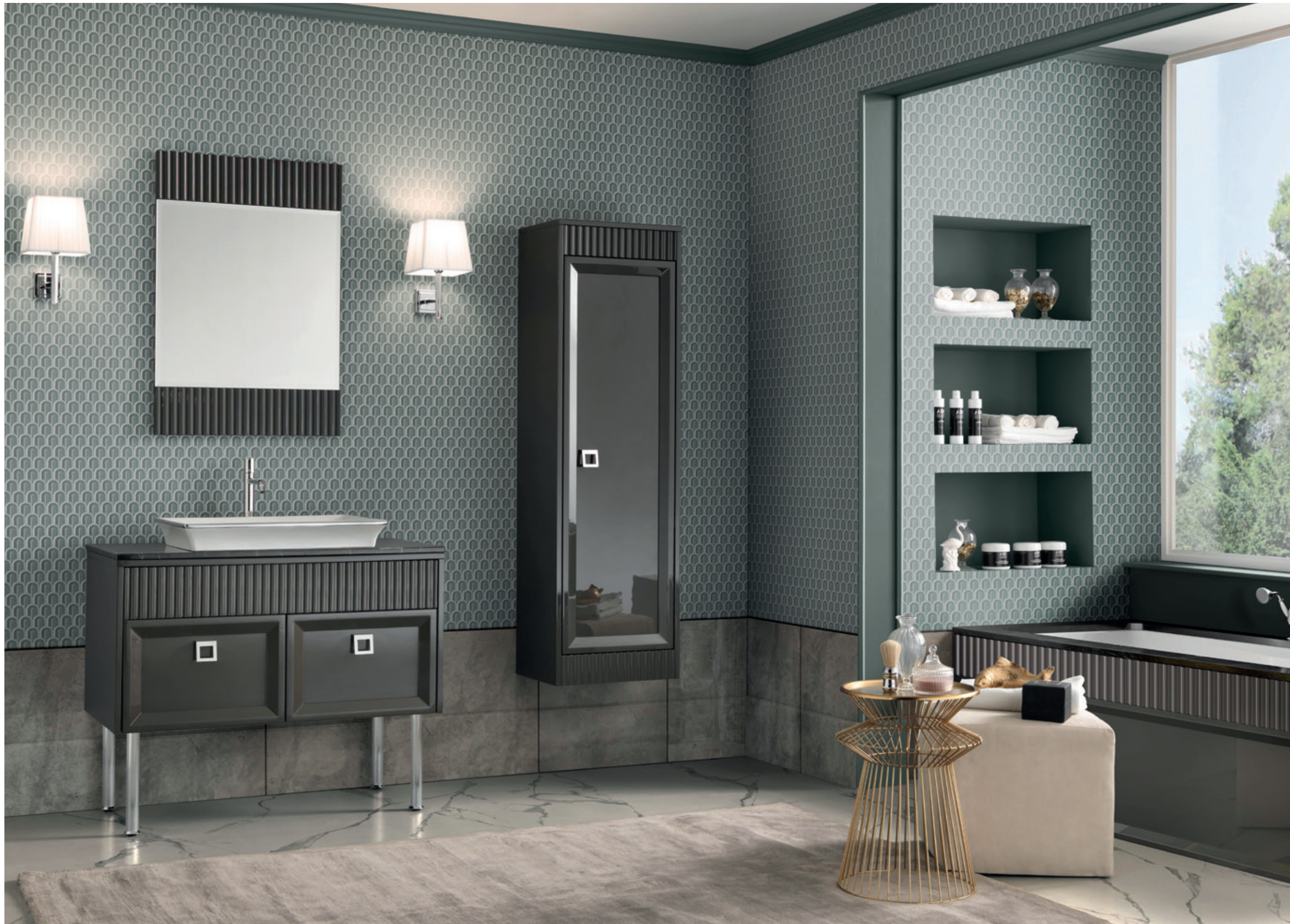
ATELIER 01 L 180 / P 50 / H 205 cm