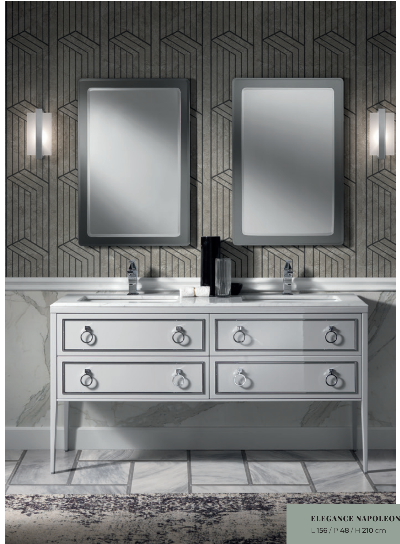
ELEGANCE NAPOLEON 27 L 156 / P 48 / H 210 cm