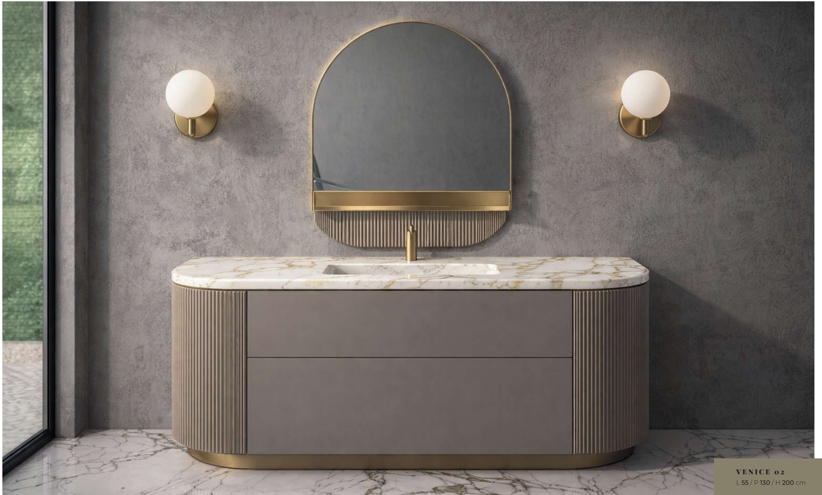
VENICE 02 L 55 / P 130 / H 200 cm