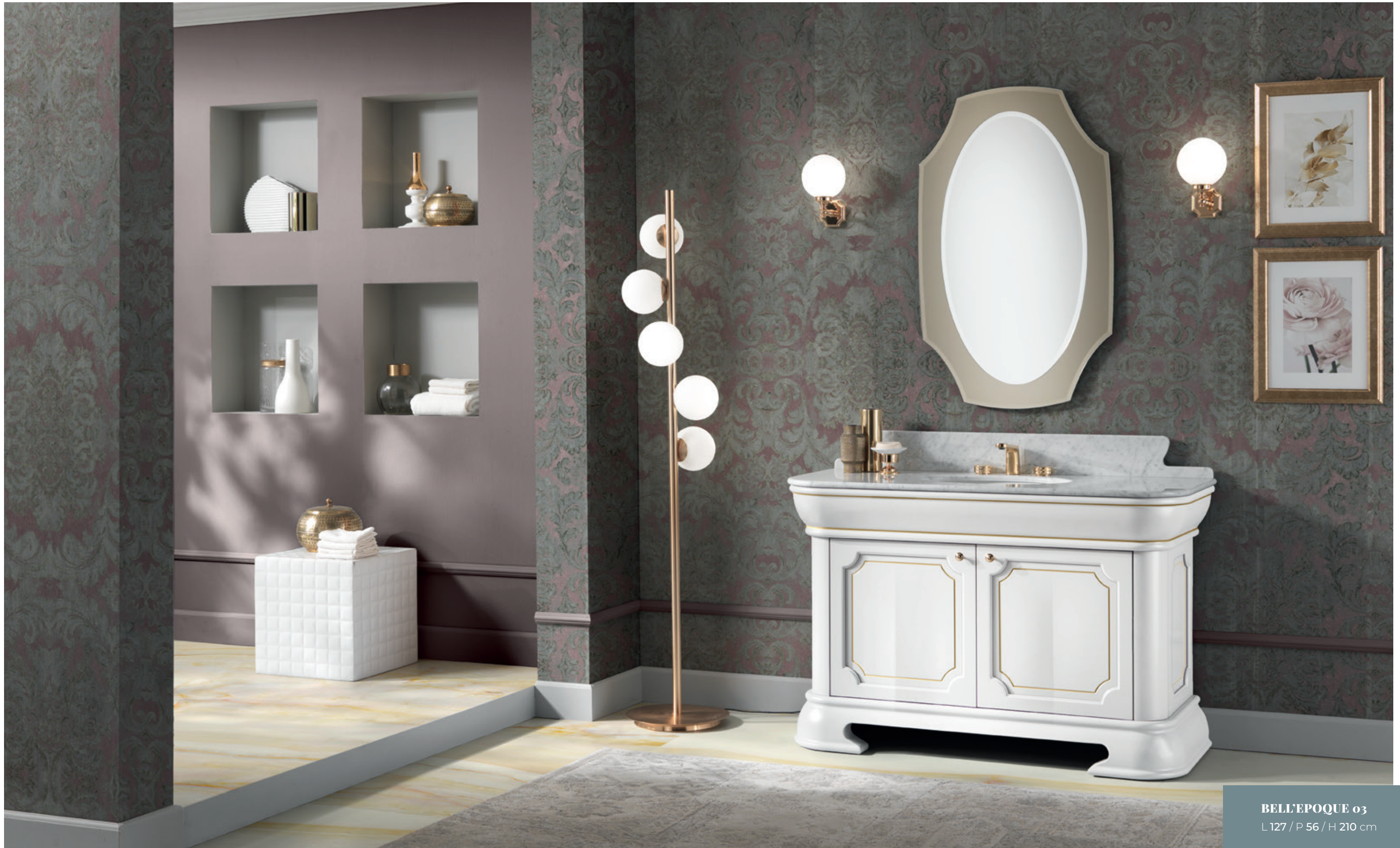
BELL'EPOQUE 03 L 127 / P 56 / H 210 cm