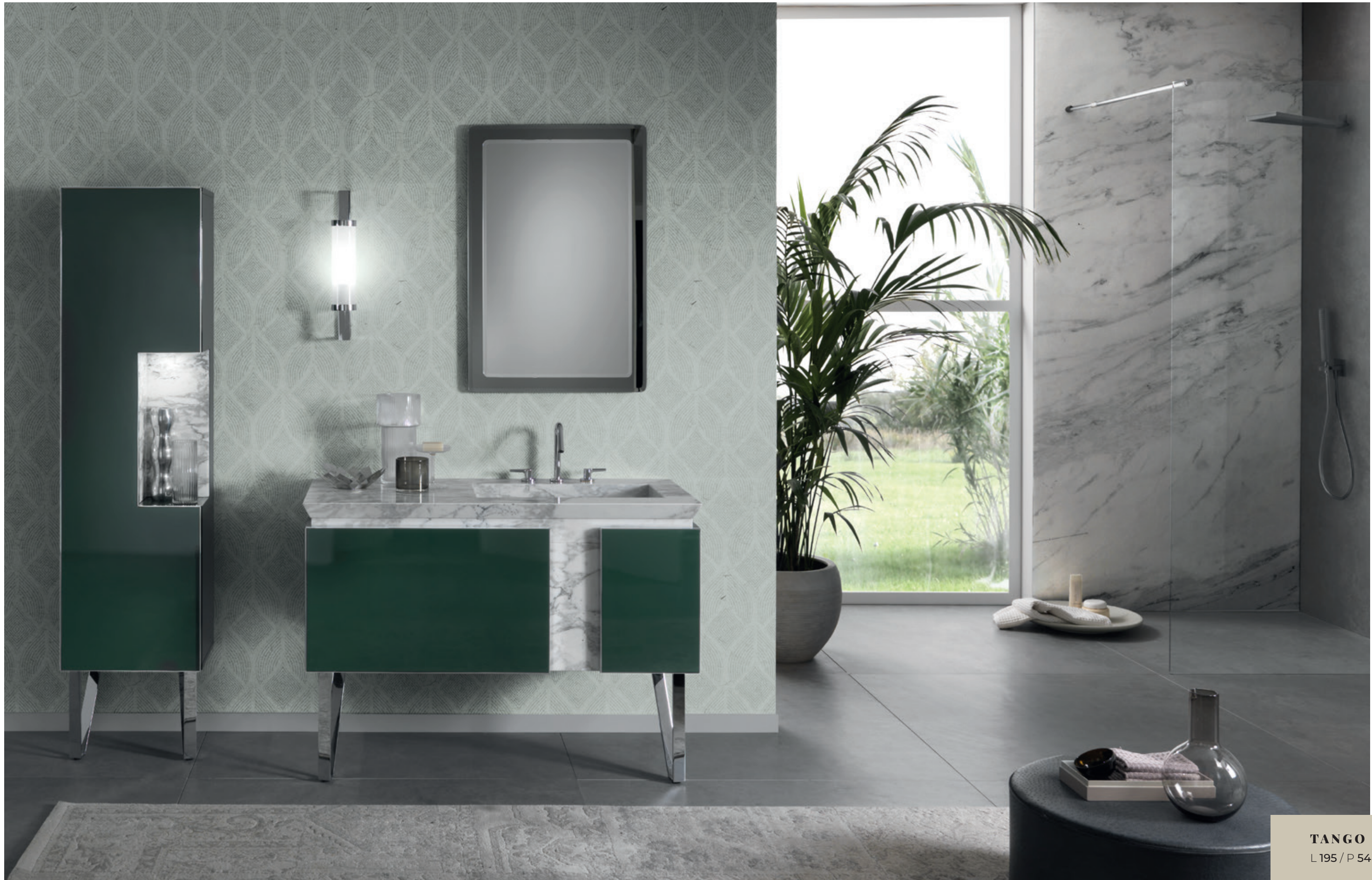
TANGO 03 L 195 / P 54 / H 205 cm