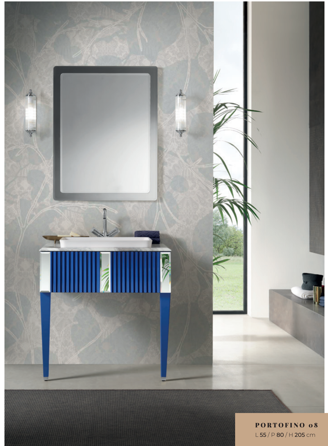
PORTOFINO o8 L 55 / P 80 / H 205 cm