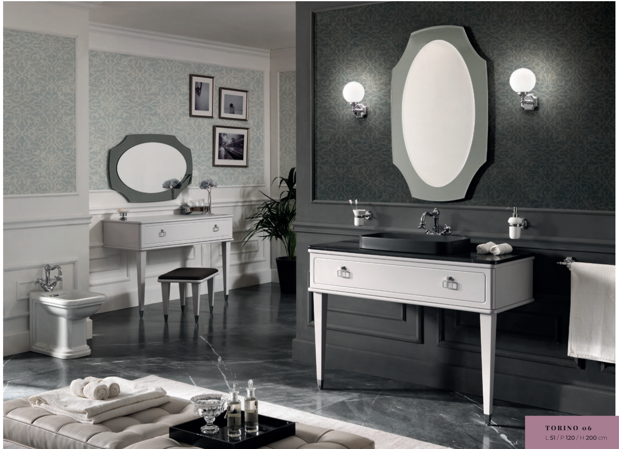
TORINO 06 L 51 / P 120 / H 200 cm