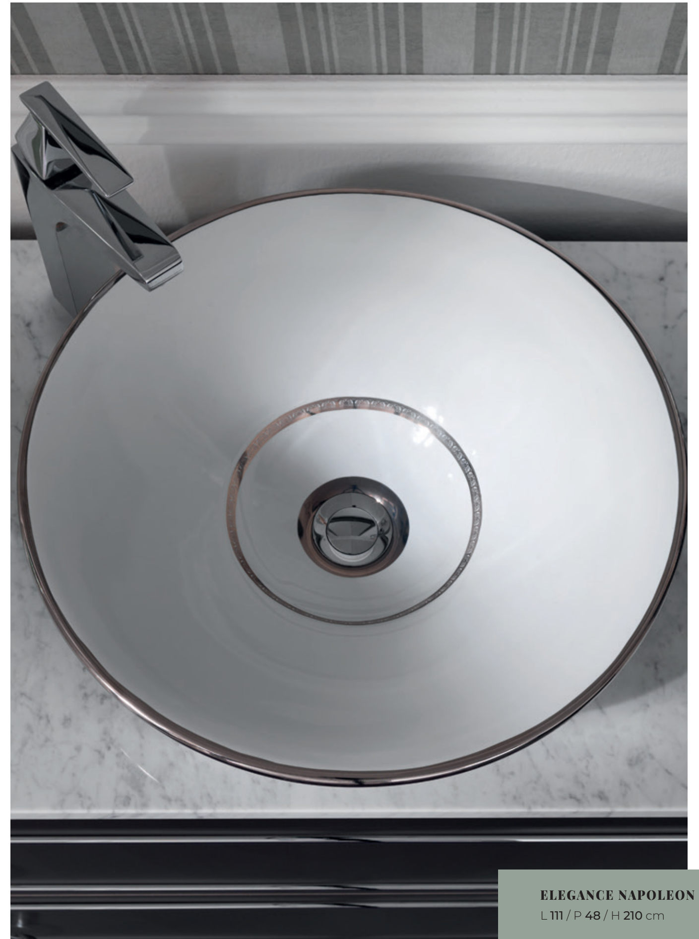
ELEGANCE NAPOLEON 30 L 111 / P 48 / H 210 cm