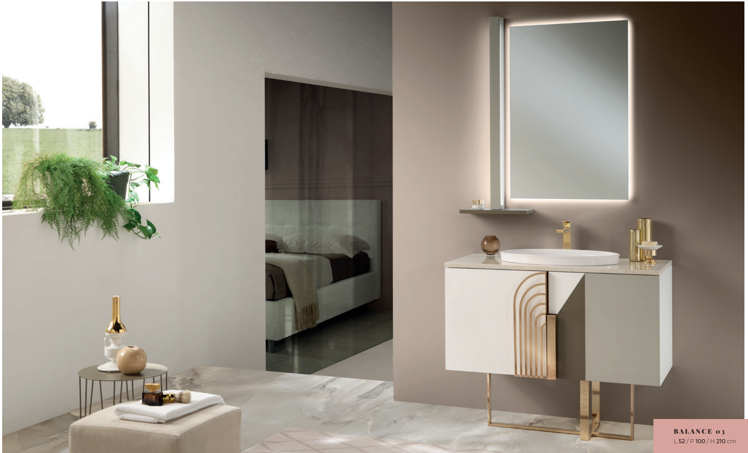
BALANCE 03 L 52 / P 100 / H 210 cm