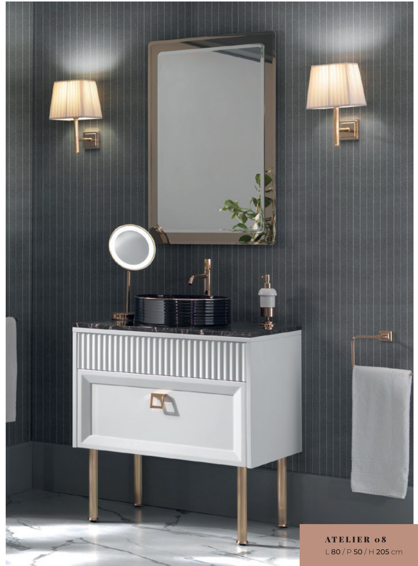
ATELIER o8 L 80 / P 50 / H 205 cm