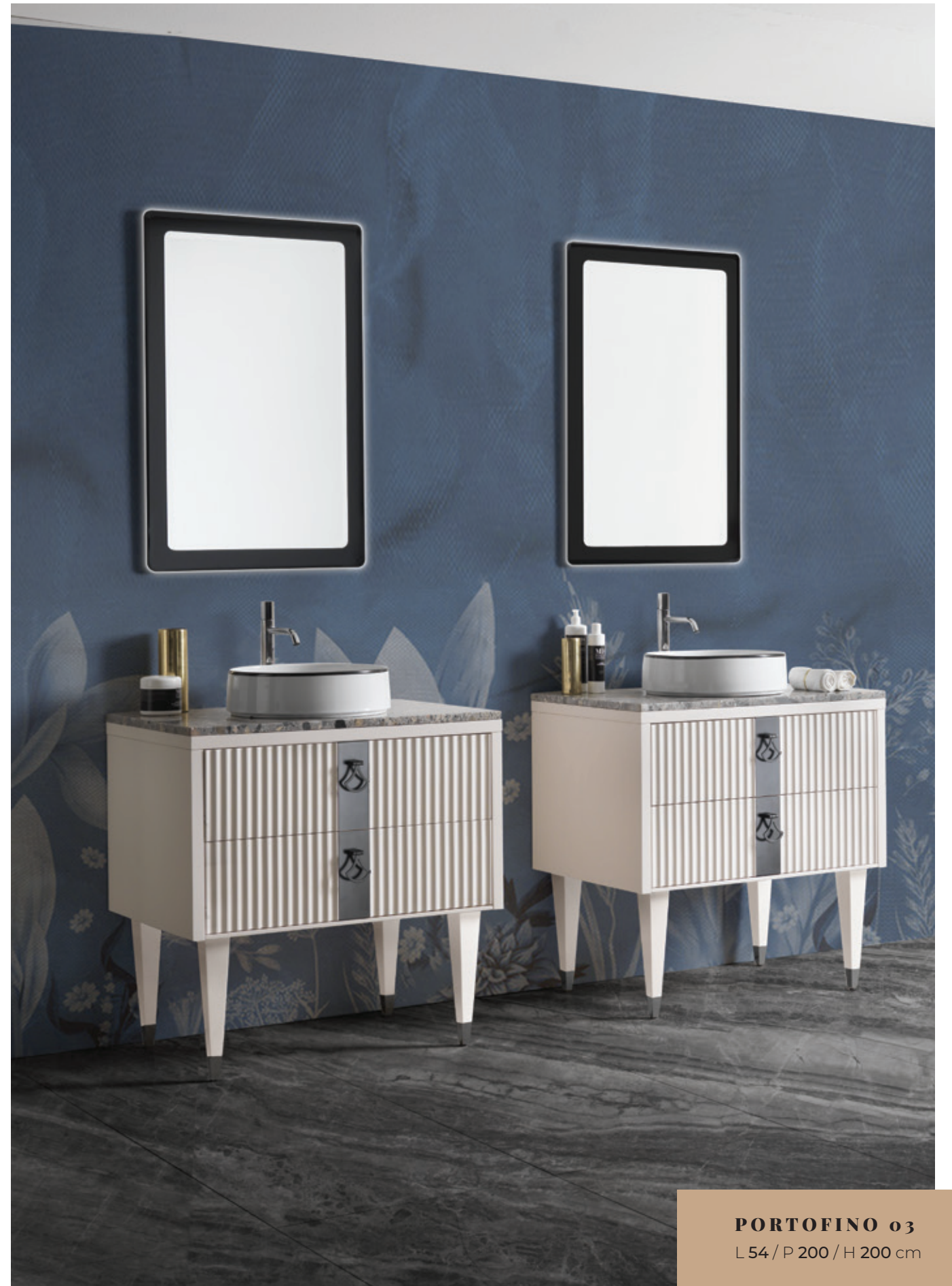
PORTOFINO 03 L 54 / P 200 / H 200 cm