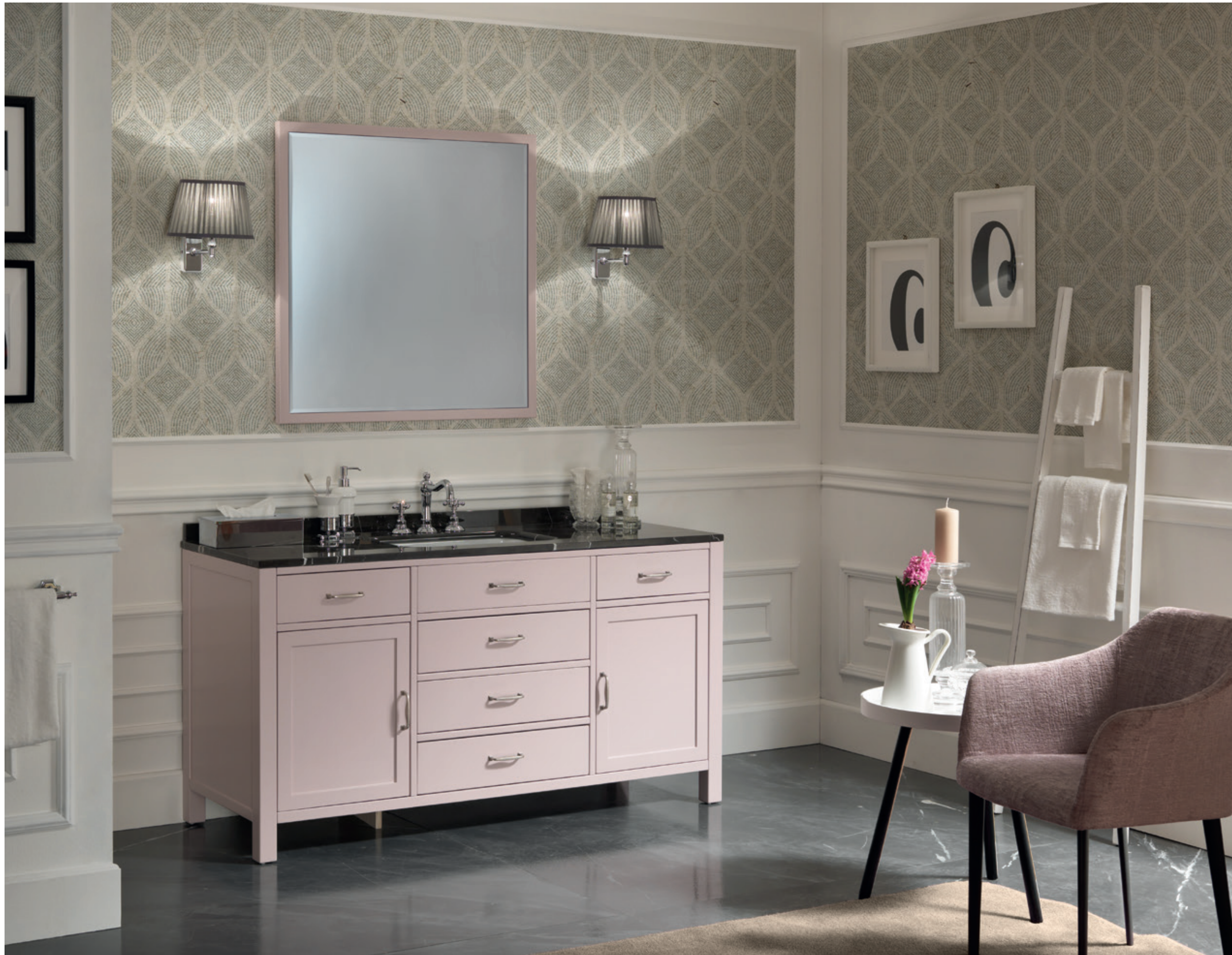
GERANIO 01 L 150 / P 55 / H 200 cm