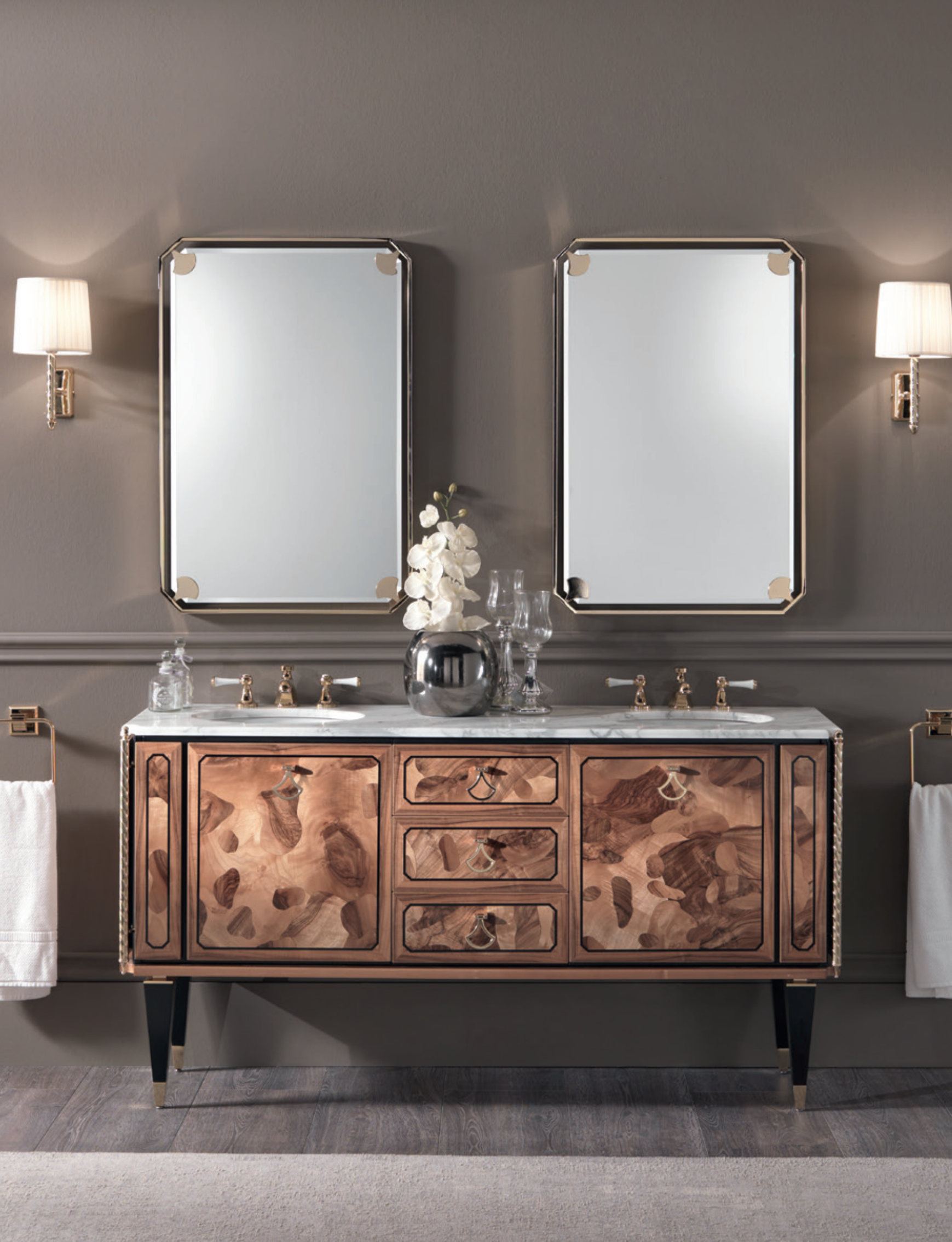
PETIT o6 L160 / P 53 / H 200 cm