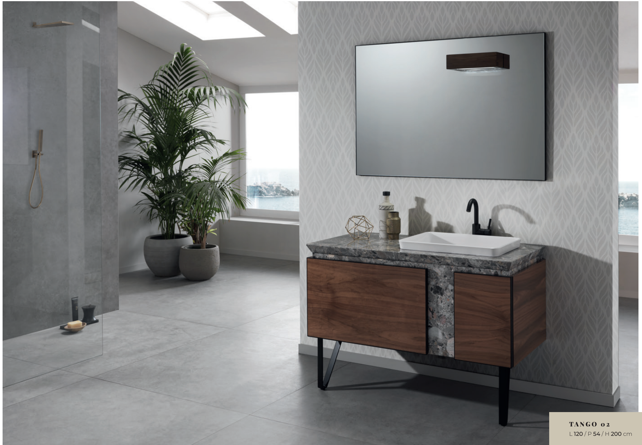
TANGO o2 L 120 / P 54 / H 200 cm