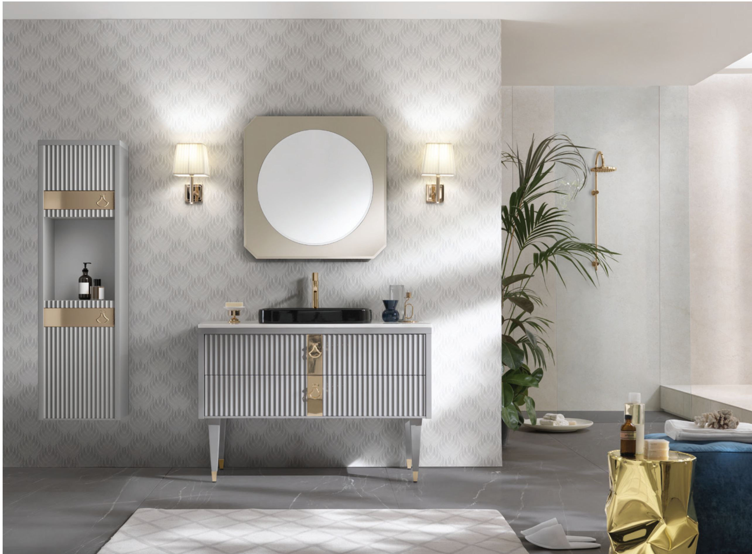
PORTOFINO 05 L 54 / P 205 / H 200 cm