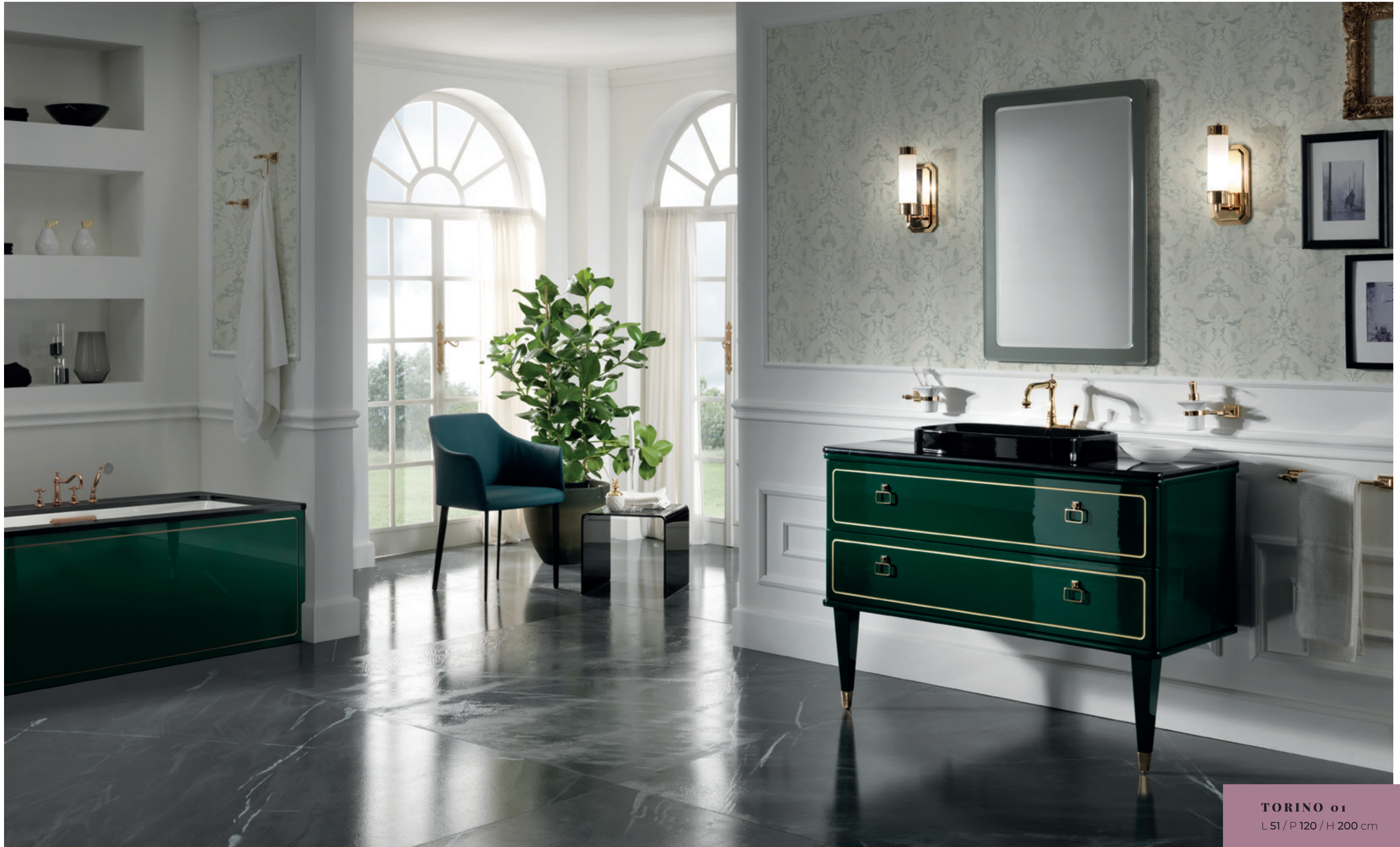
TORINO 01 L 51 / P 120 / H 200 cm